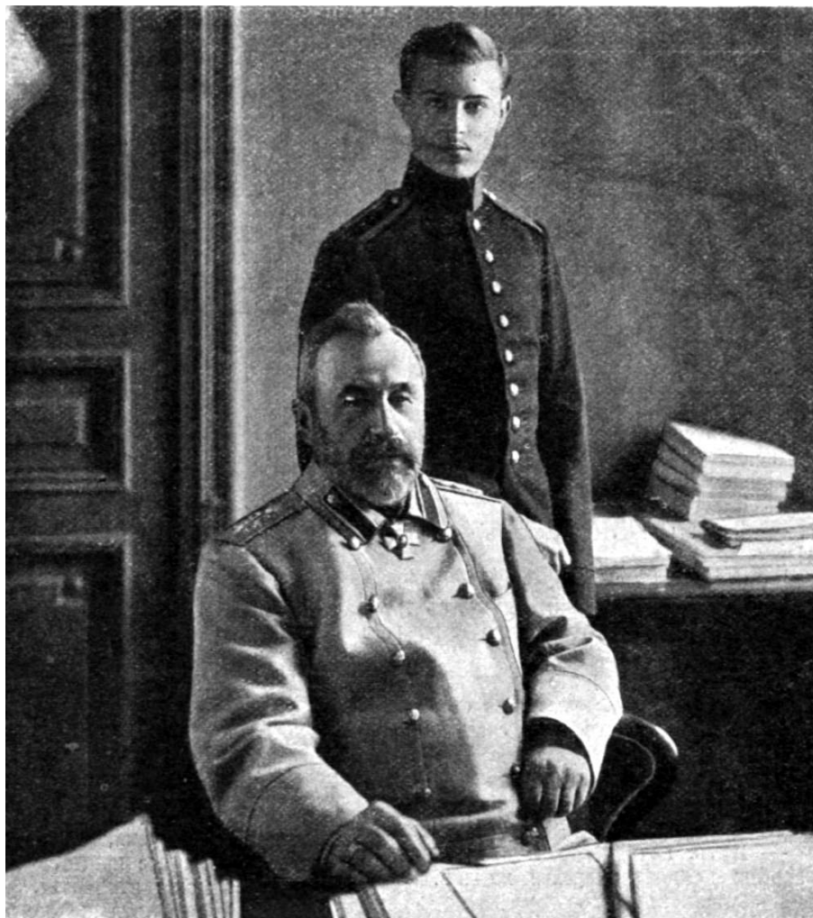
Рис. 6. Куропаткин А. Н. с сыном.