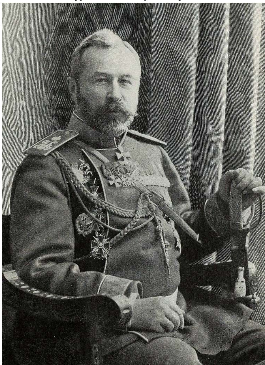
Рис. 3. Военный министр А.Н. Куропаткин.