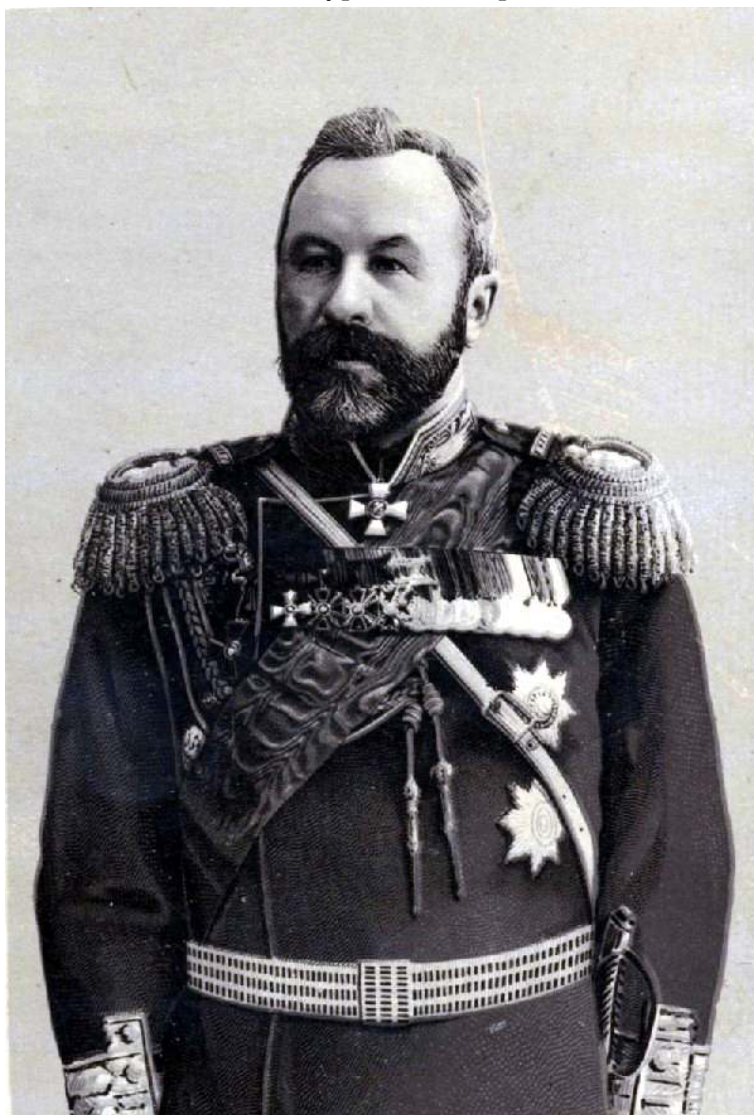
Рис. 5. Генерал-адъютант А. Н. Куропаткин.