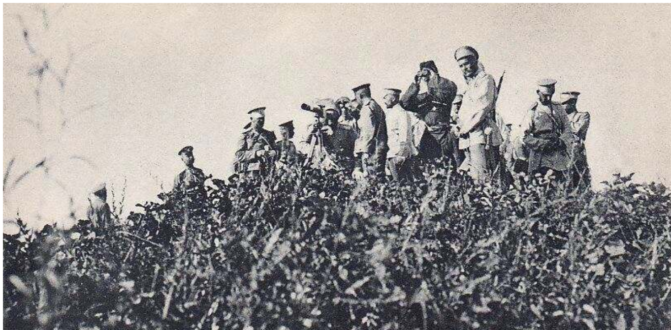
Рис. 2. А. Н. Куропаткин осматривает вражеские позиции.