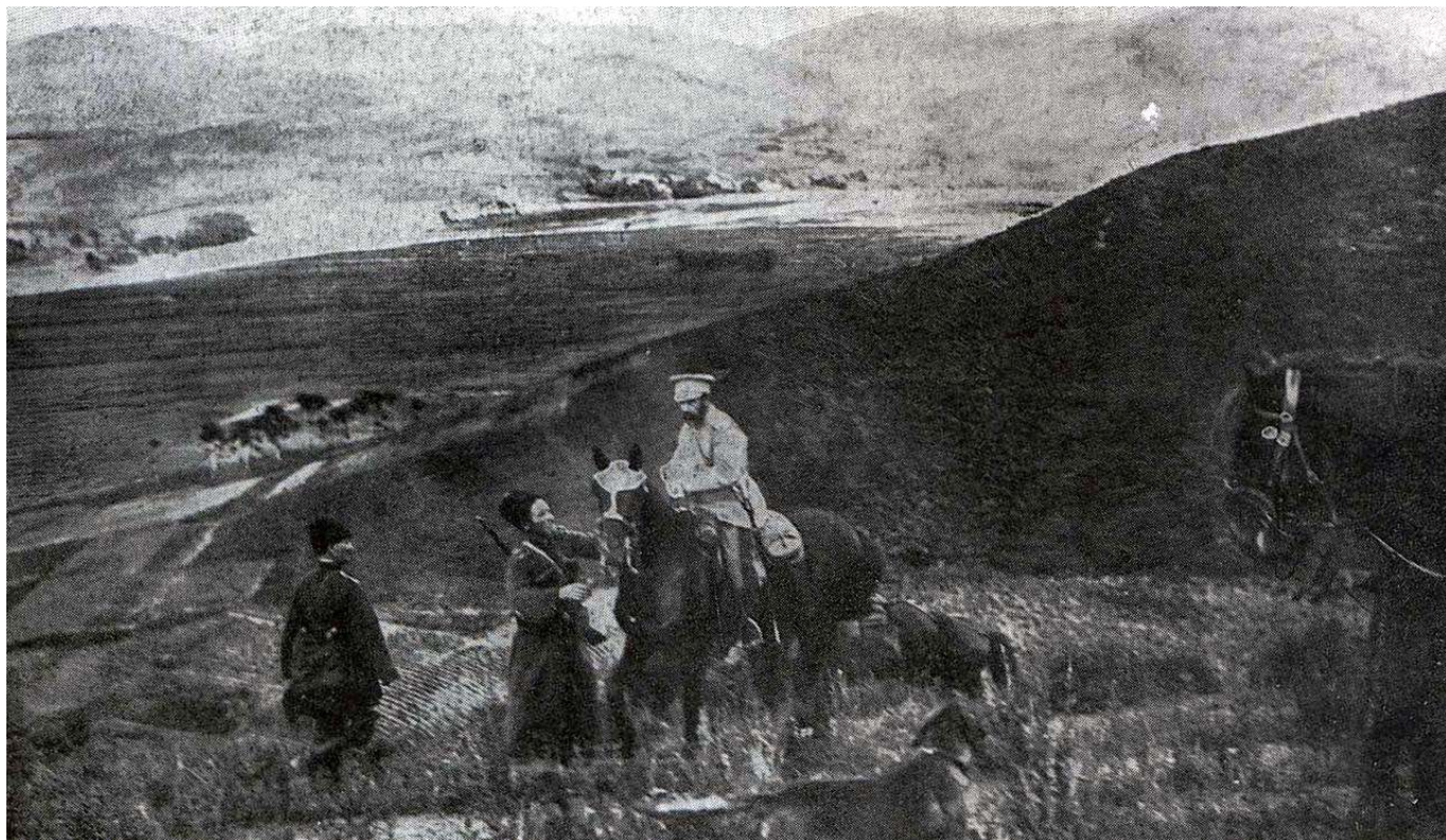
Рис. 4. А. Н. Куропаткин при Ляояне.