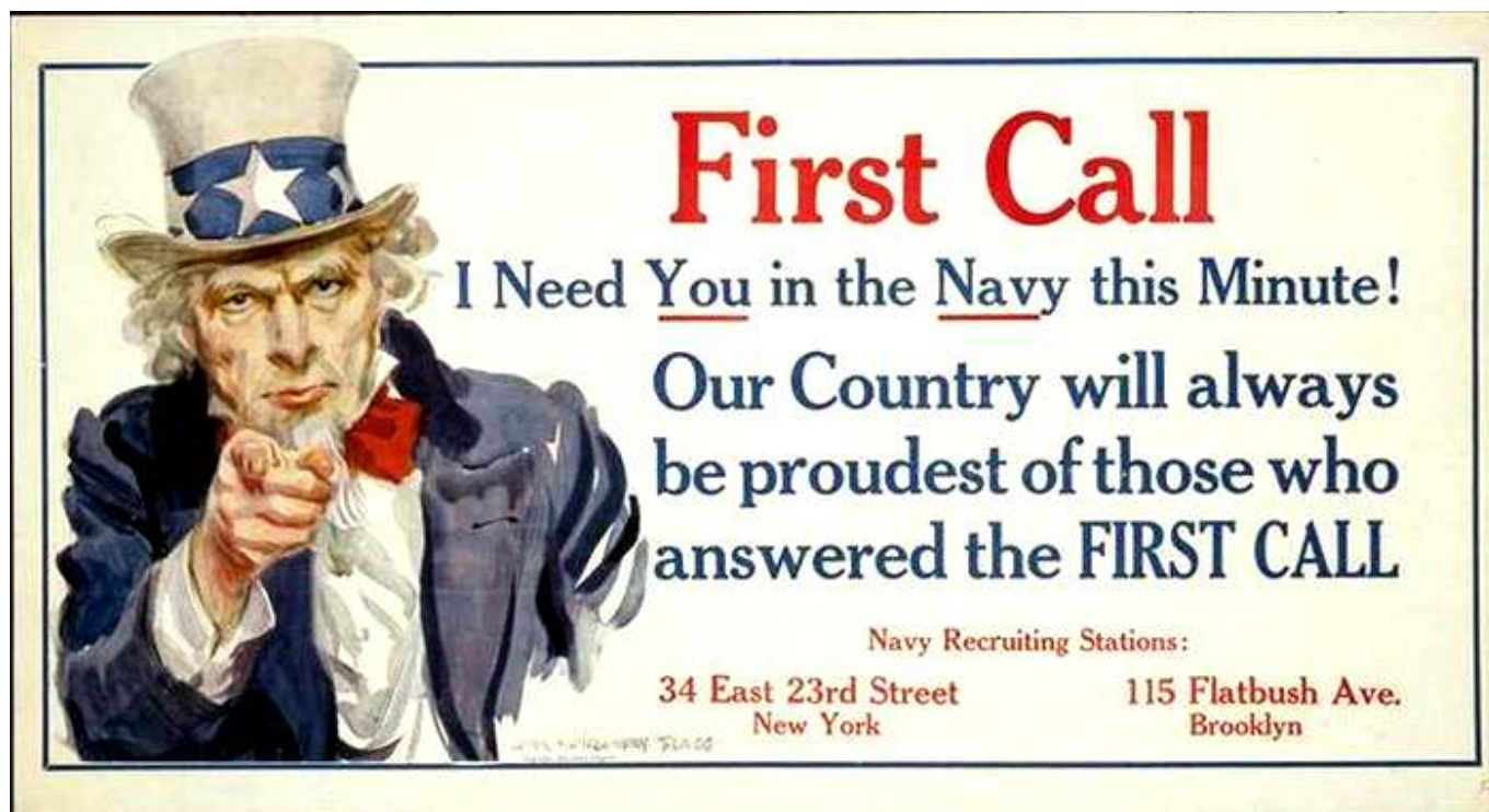
Рис. 5. Вербовочный плакат ВМФ САСШ.