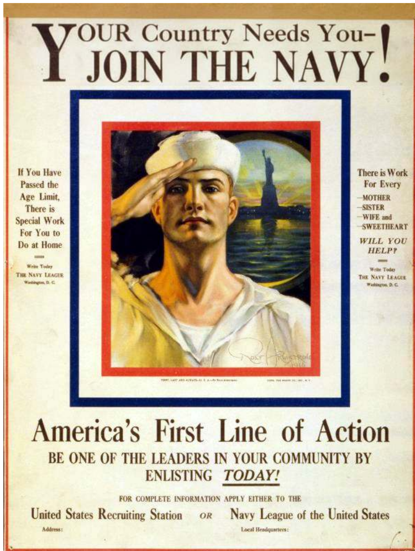
Рис. 2. Плакат "Твоя страна нуждается в тебе! Записывайся на флот!".