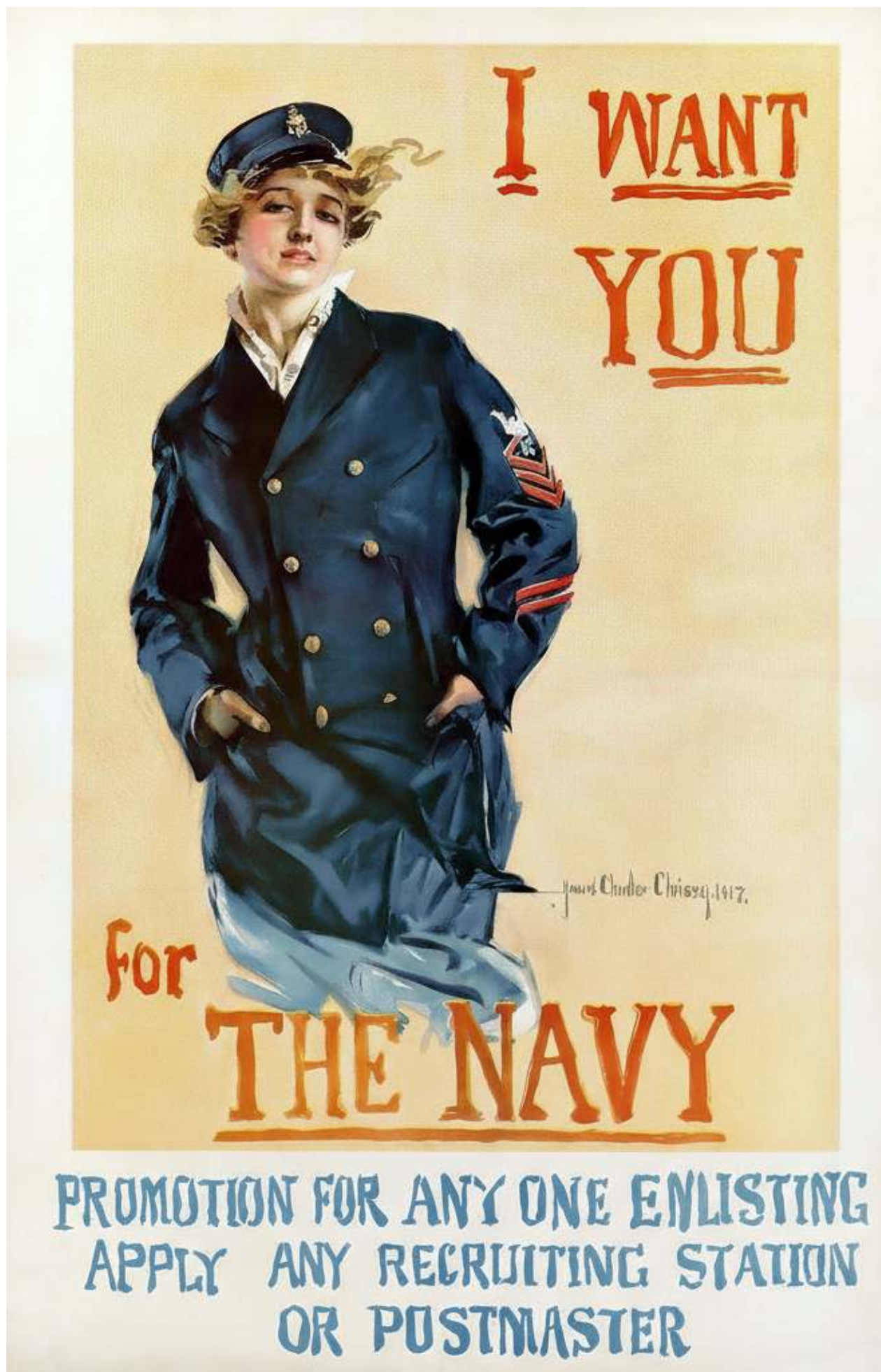
Рис. 3. Плакат "Я хочу, чтобы ты служил на военно-морском флоте".