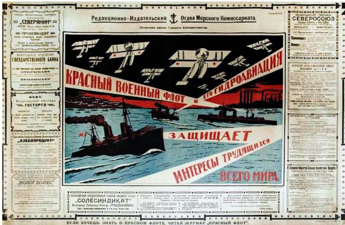
Рис.4. "РККФ защищает интересы трудящихся во всем мире".