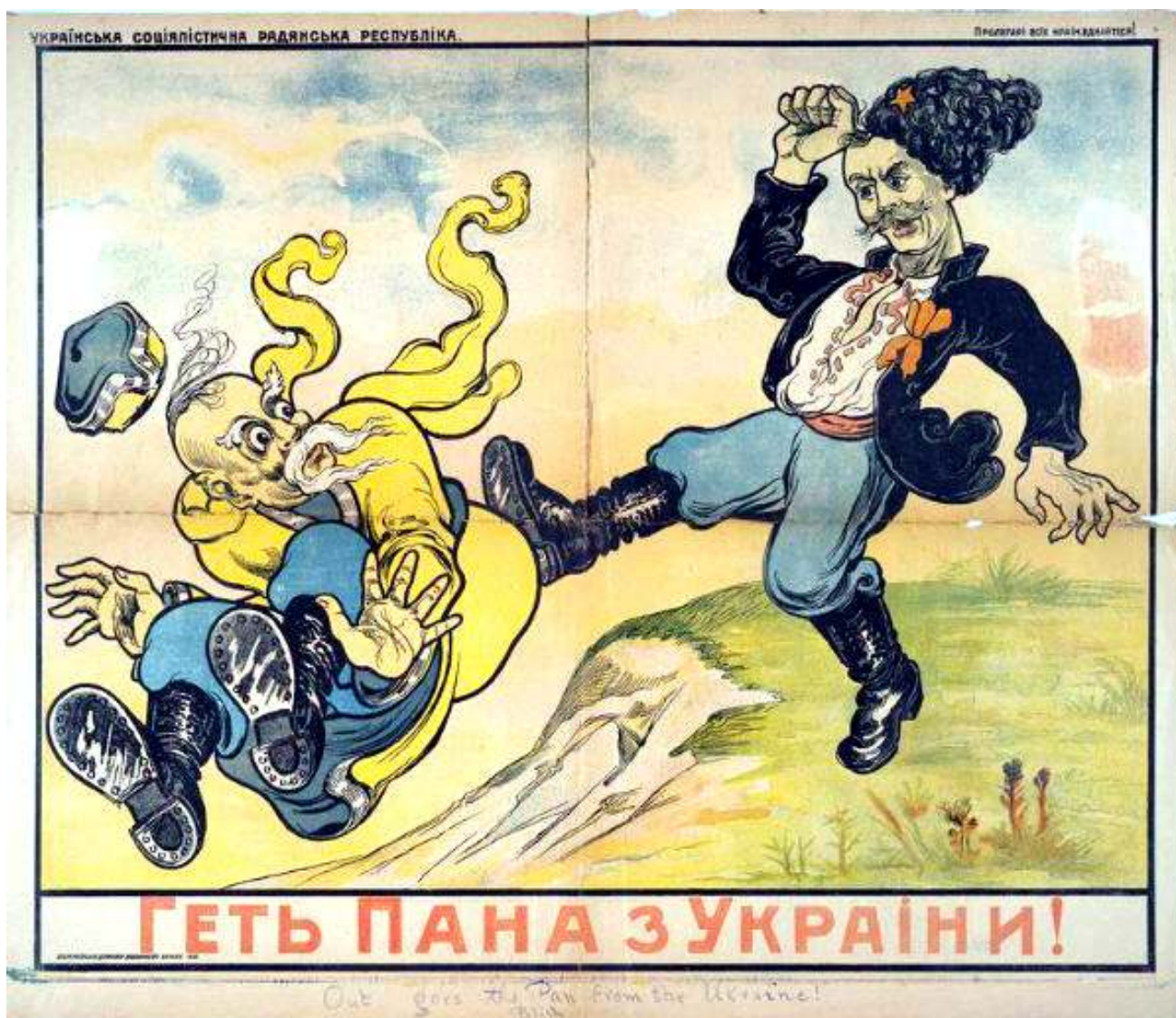
Рис. 1. Плакат "Геть пана с Украины!".

Таким образом, благодаря редкому периодическому изданию политического управления Харьковского военного округа «Политбоец» до наших дней дошли сведения: об организации продовольственного налога на советской Украине, помощи голодающему Поволжью, культурному и хозяйственному строительству среди крестьян и красноармейцев, международном положении и развитии рабочего протестного движения в капиталистических государствах. Собственно в периодическом издании политического управления Харьковского военного округа «Политбоец» нашел отражение сложный исторический период перехода советской власти от политики военного коммунизма к новой экономической политике.