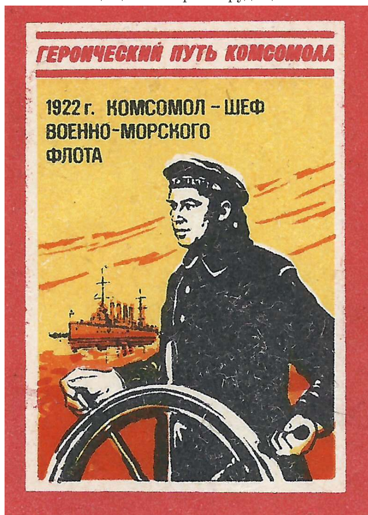
Рис.5. Спичечный коробок "Шефство комсомола над флотом".