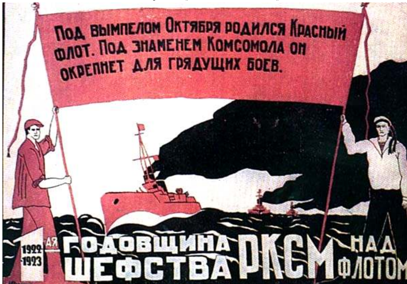
Рис.3. Плакат "Шефство комсомола над флотом".