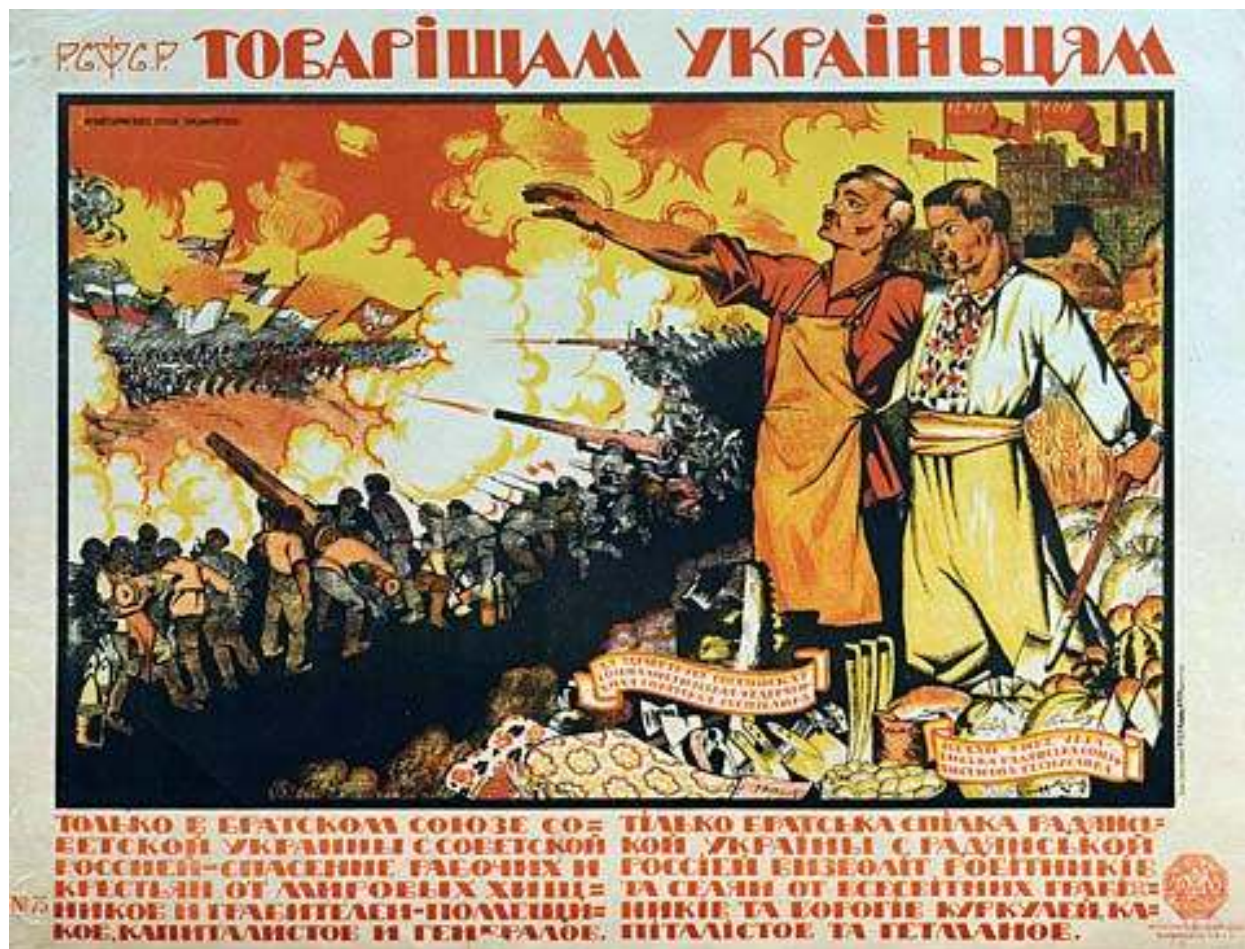
Рис. 3. Плакат "Союз советской России и Украины".