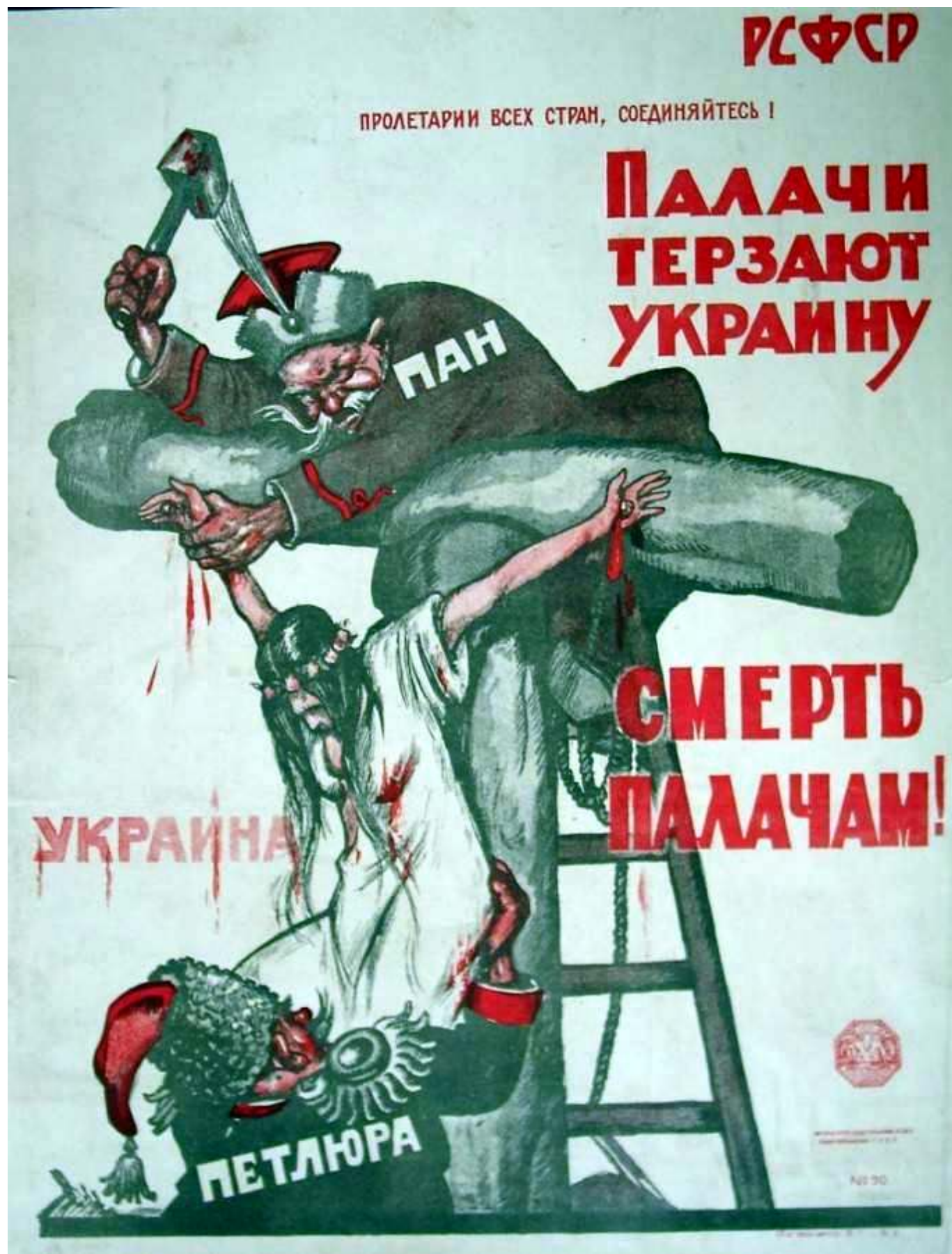
Рис. 4. Плакат "Палачи терзают Украину".