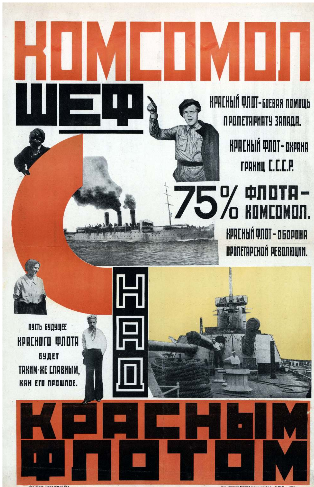
Рис.1. "Комсомол — шеф над Красным флотом".