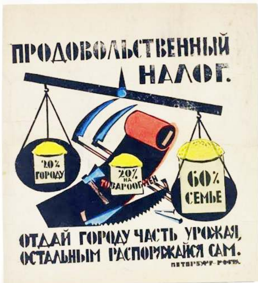
Рис.5. Плакат "Продовольственный налог".