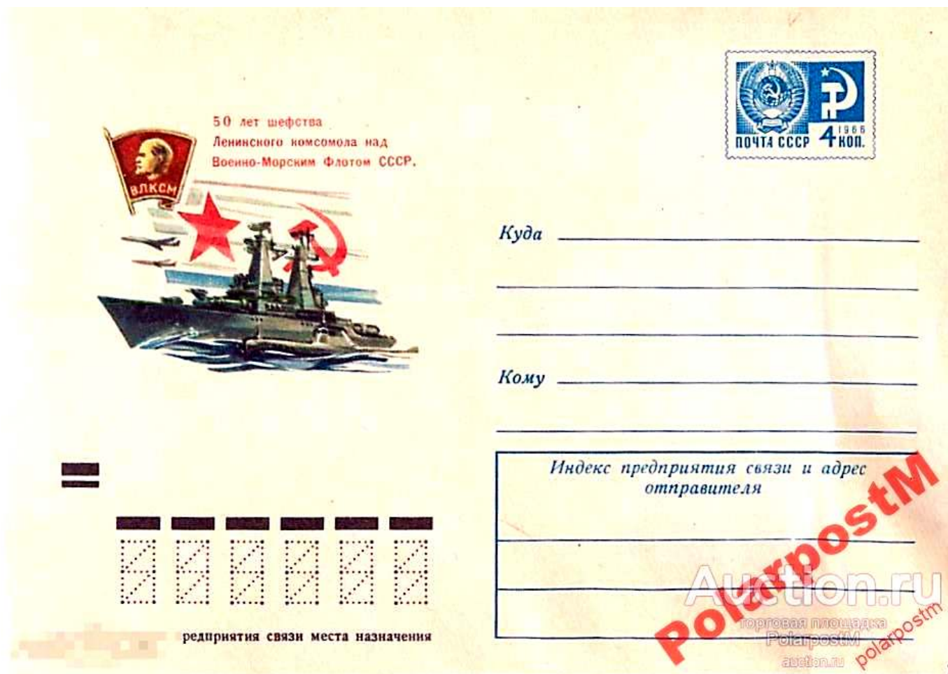
Рис.2. Конверт "Шефство комсомола над флотом".