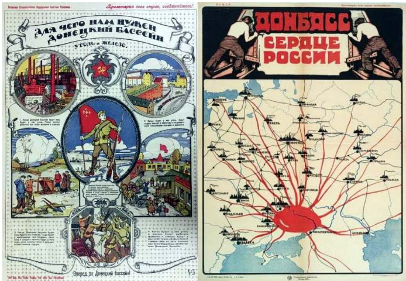
Рис. 2. Плакат "Донбасс - сердце России".