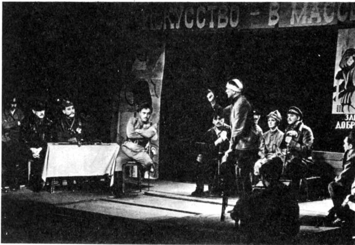
Рис.7. "Искусство в массы".