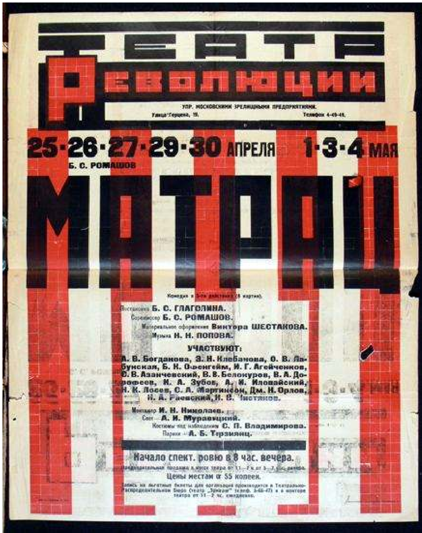
Рис.4. Афиша театра революции.