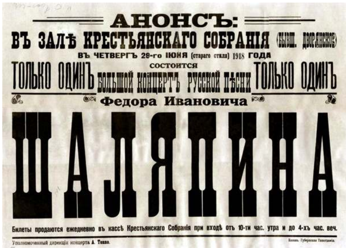
Рис.1. Афиша Ф. И. Шаляпина.