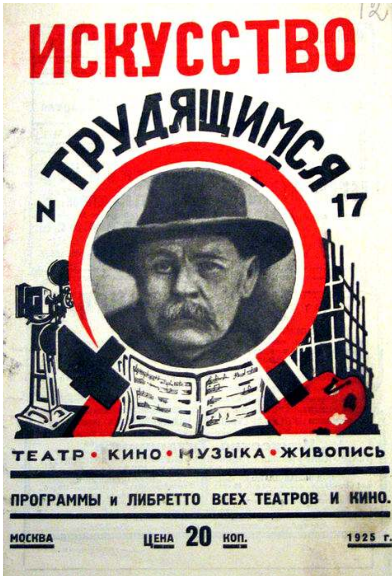
Рис.6. "Искусство трудящимся".