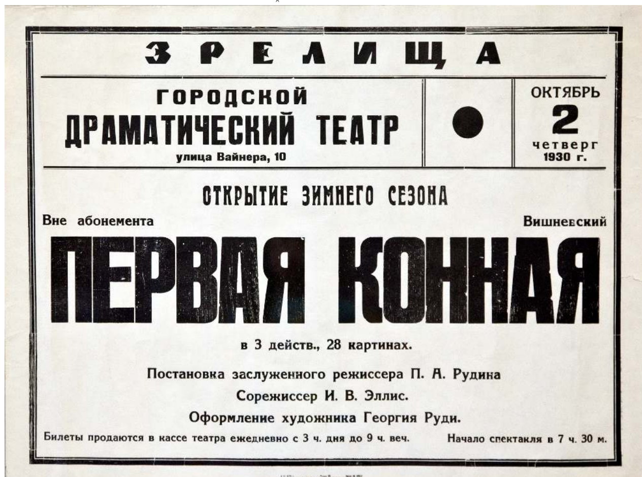
Рис.2. Спекталь "Первая конная".