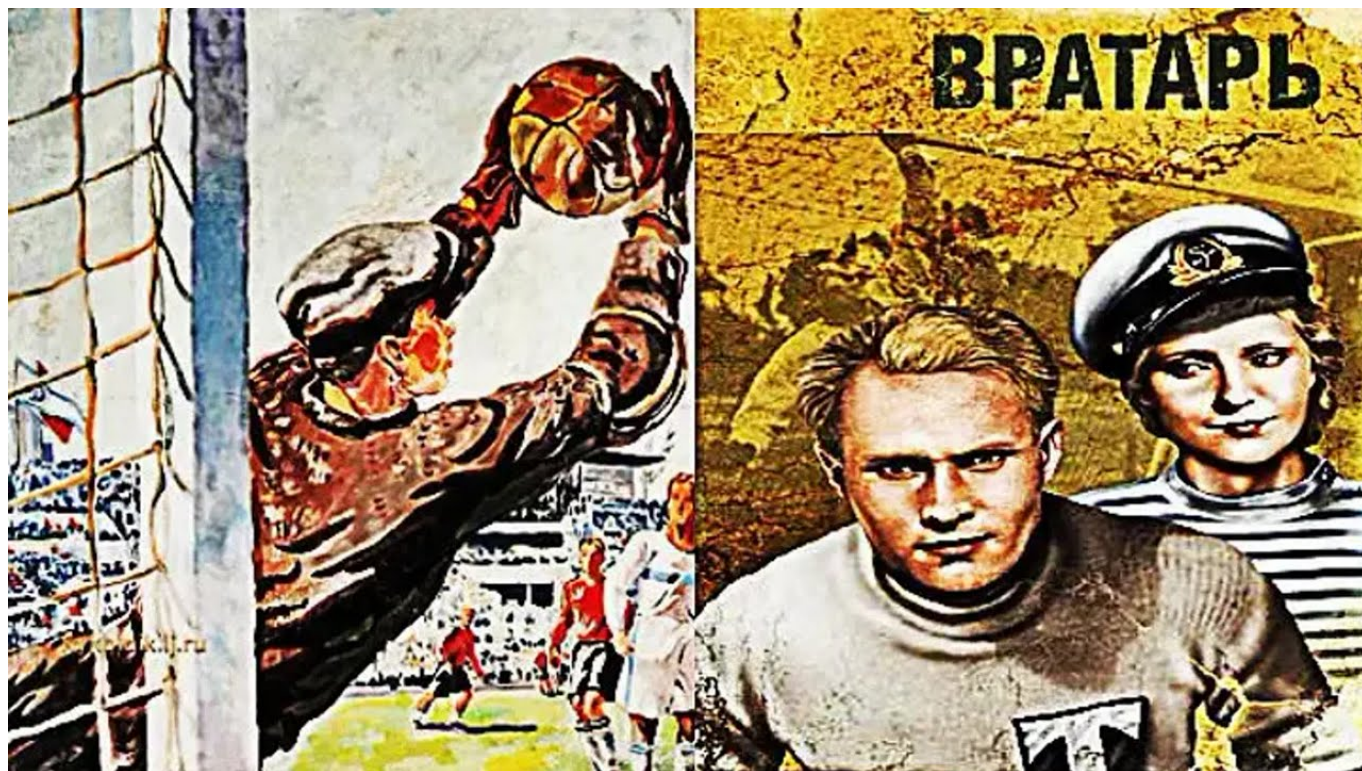
Рис. 1. Афиша фильма "Вратарь" 1936 г.