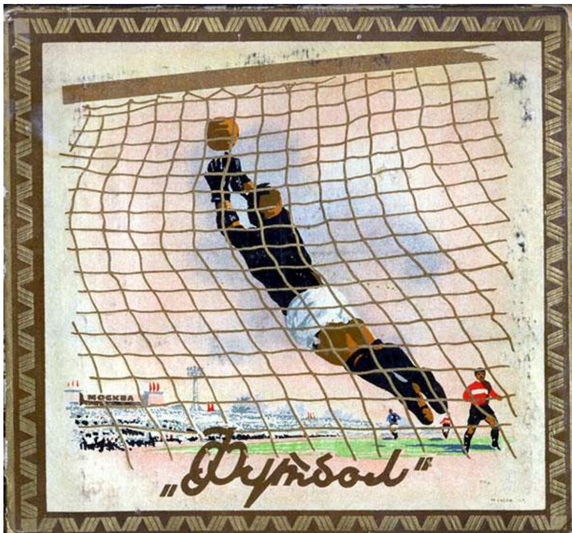
Рис. 6. Папиросная пачка с изображением голкипера.