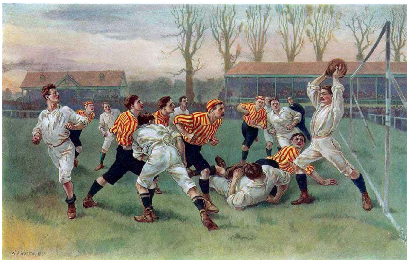
Рис. 2. Вратарь викторианской эпохи в Великобритании.