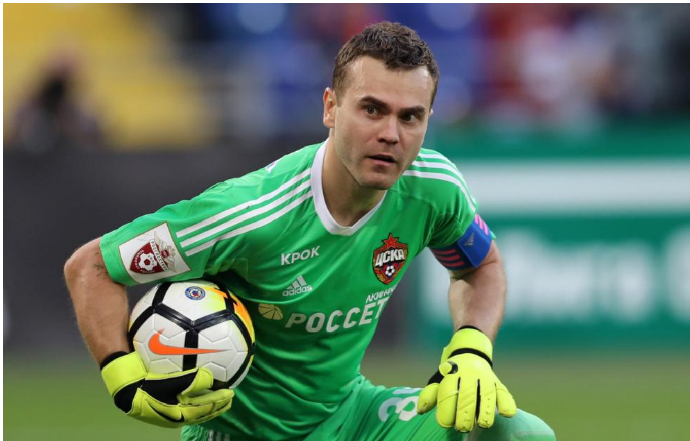
Рис. 4. Лучший вратарь современной России И .В. Акинфеев.