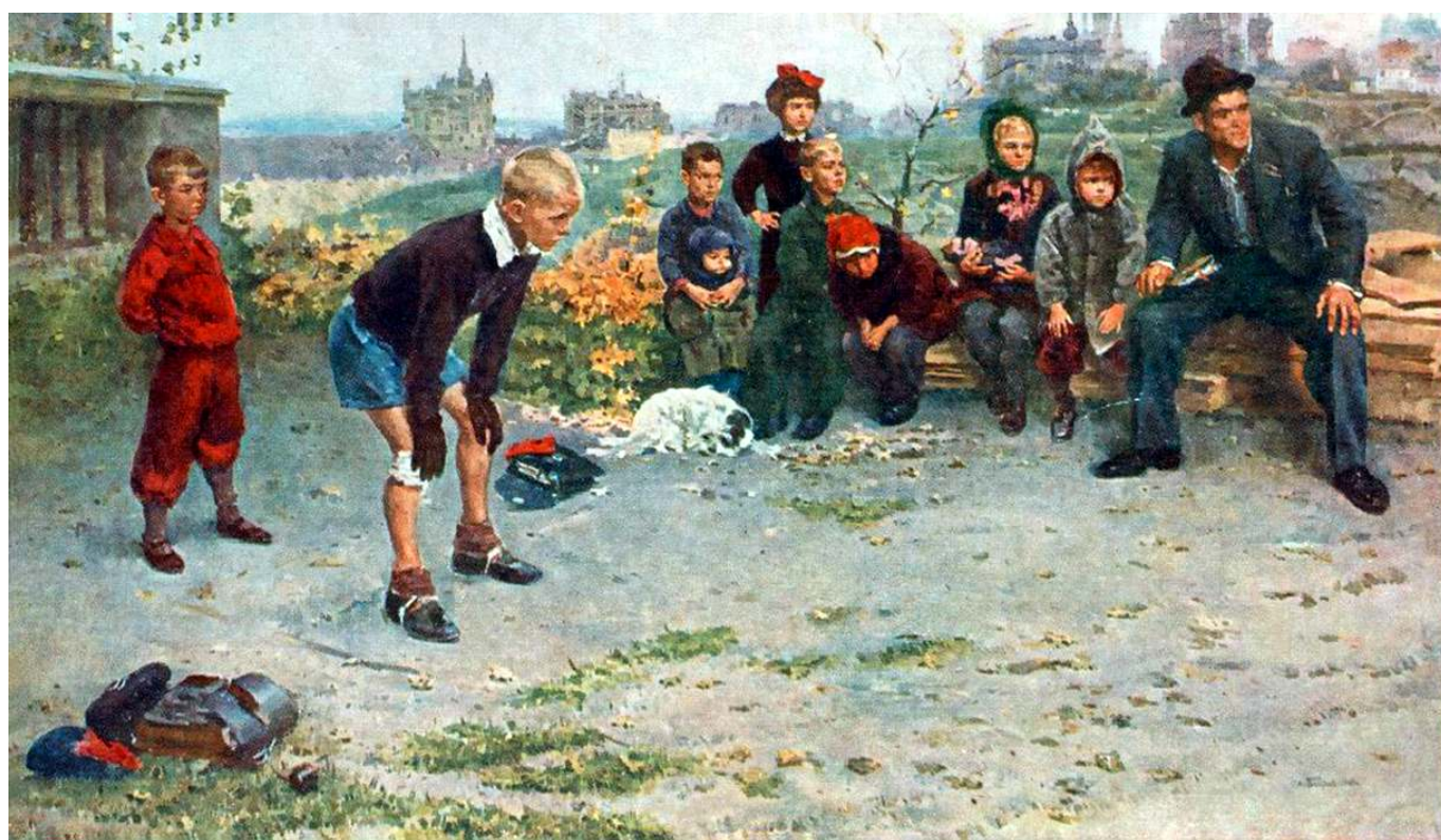
Рис. 7. С. А. Григорьев. Картина "Вратарь".