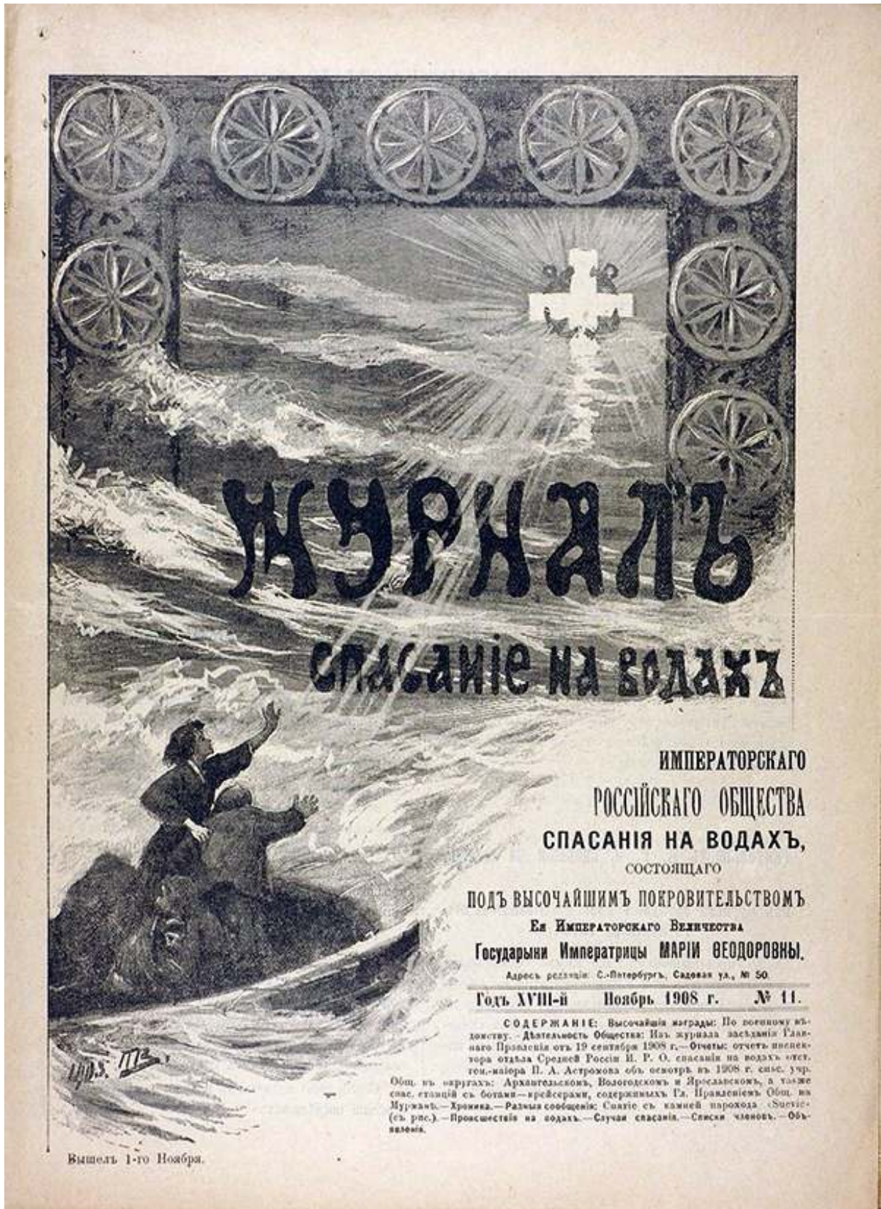
Рис. 1. Журнал общества спасания на водах.

С привлечением опубликованных и неопубликованных источников можно сформулировать тему кандидатской диссертации «Организация и деятельность Свеаборгского внеокружного общества спасания на водах во второй половине XIX – начале XX вв.».