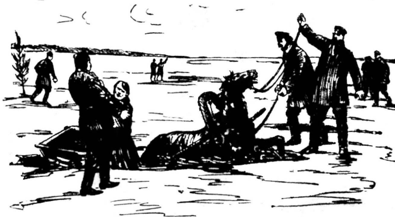
Рис. 6. Приключения на льду Финского залива.