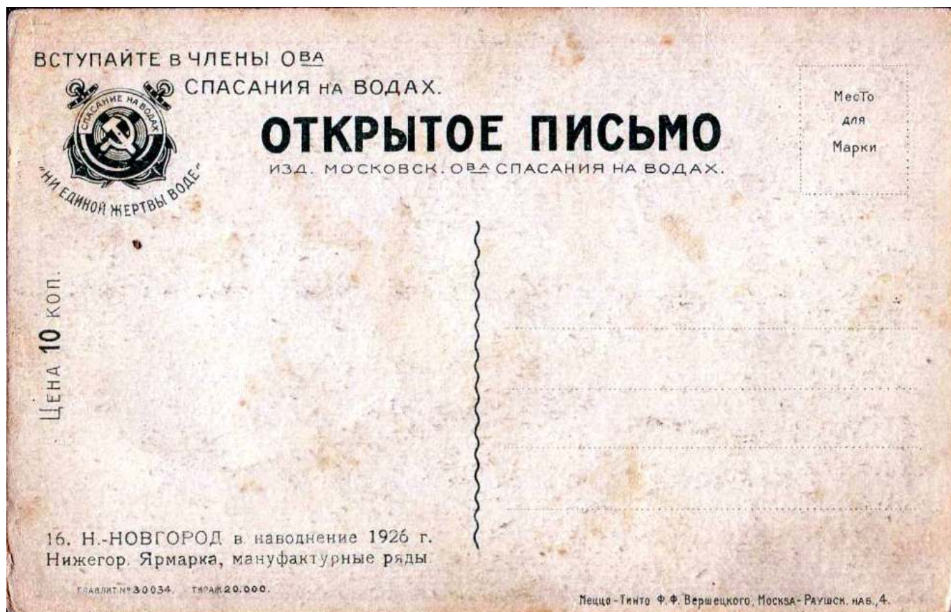
Рис. 4. Открытое письмо общества спасания на водах.