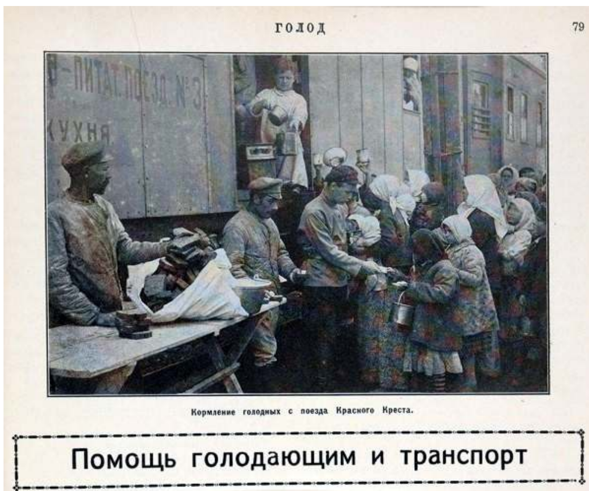
Рис.1. Помощь "Красного креста".