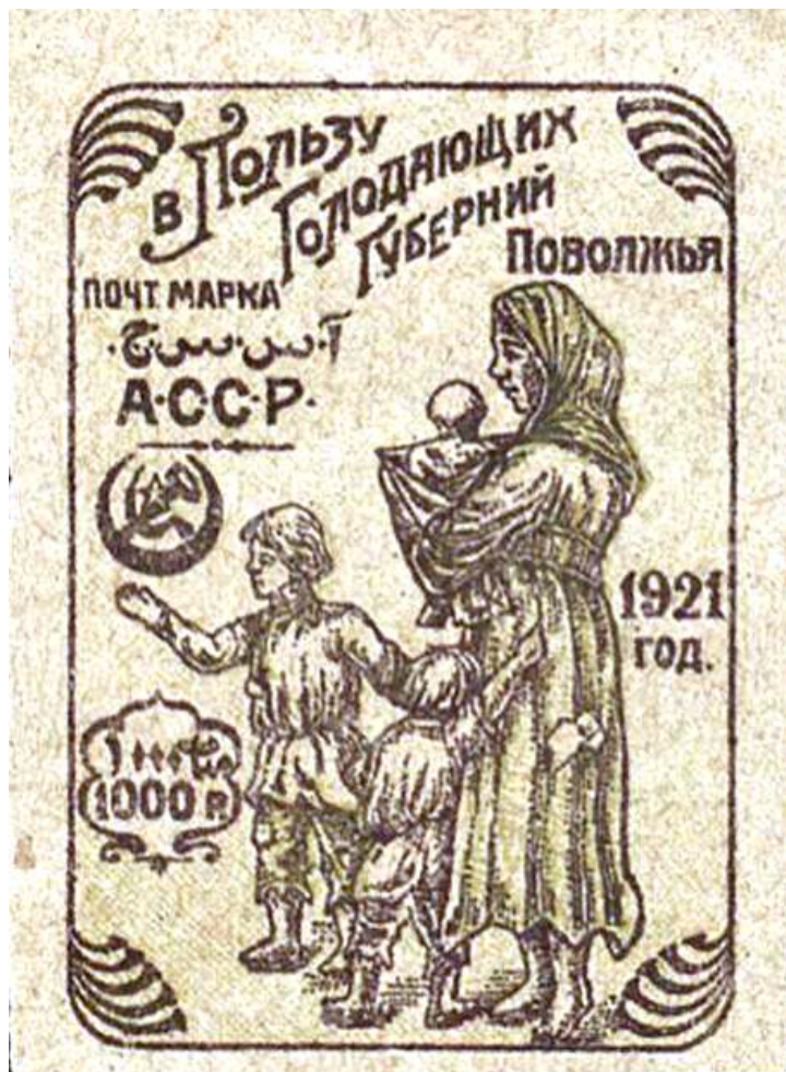
Рис.2. Почтовая марка.