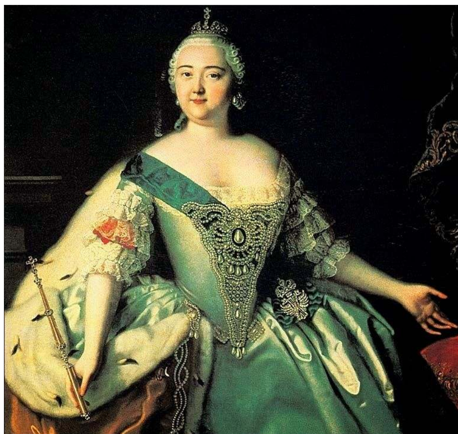
Рис. 3. Елизавета Петровна.