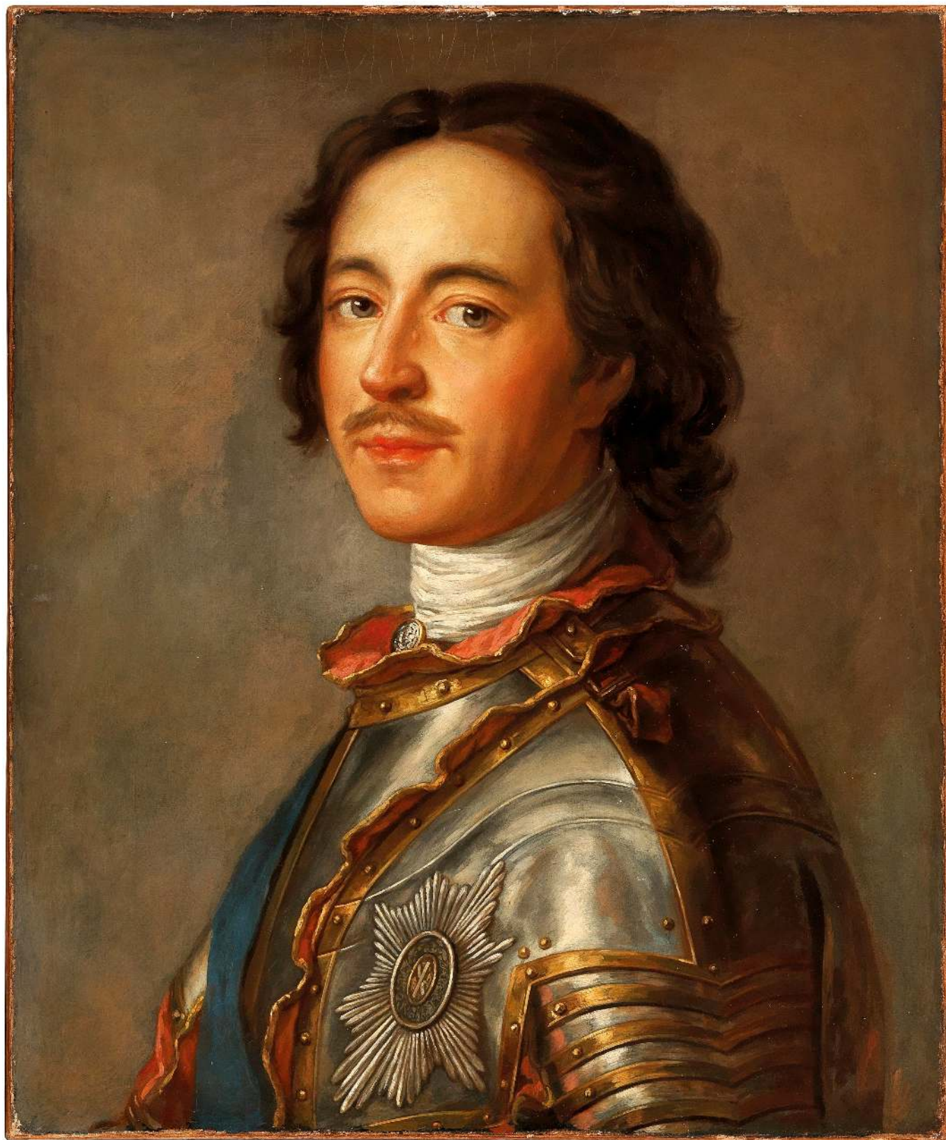
Рис. 1. Петр I.