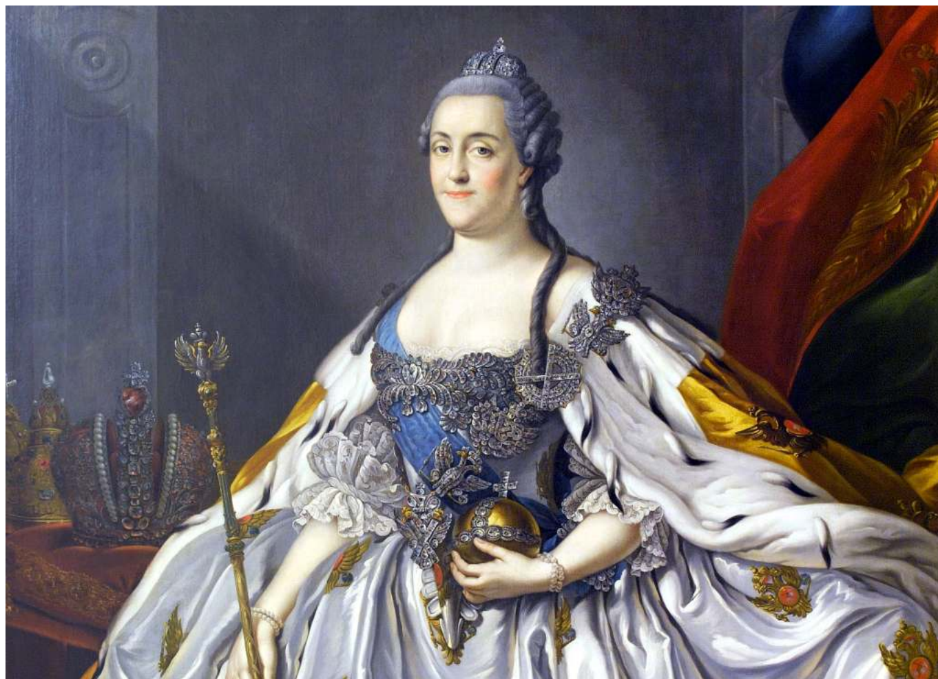
Рис. 2. Екатерина II.