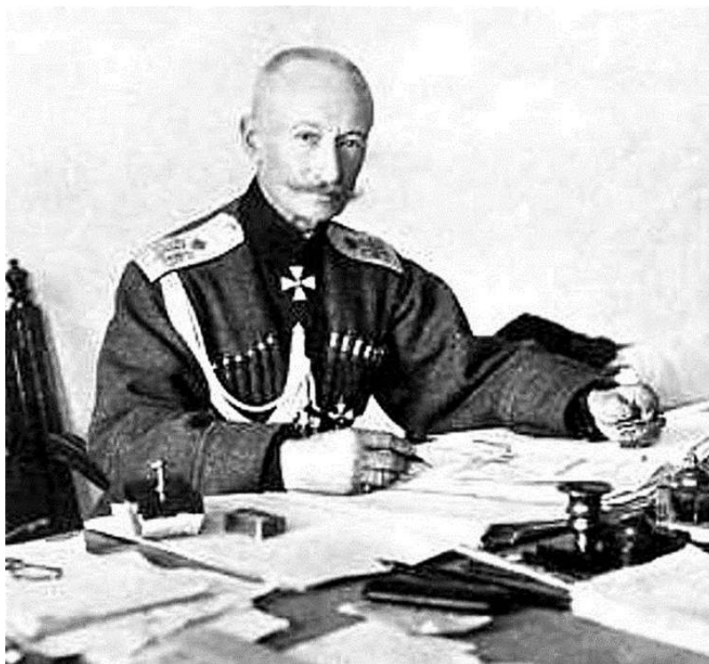
Рис. 2. А. А. Брусилов.