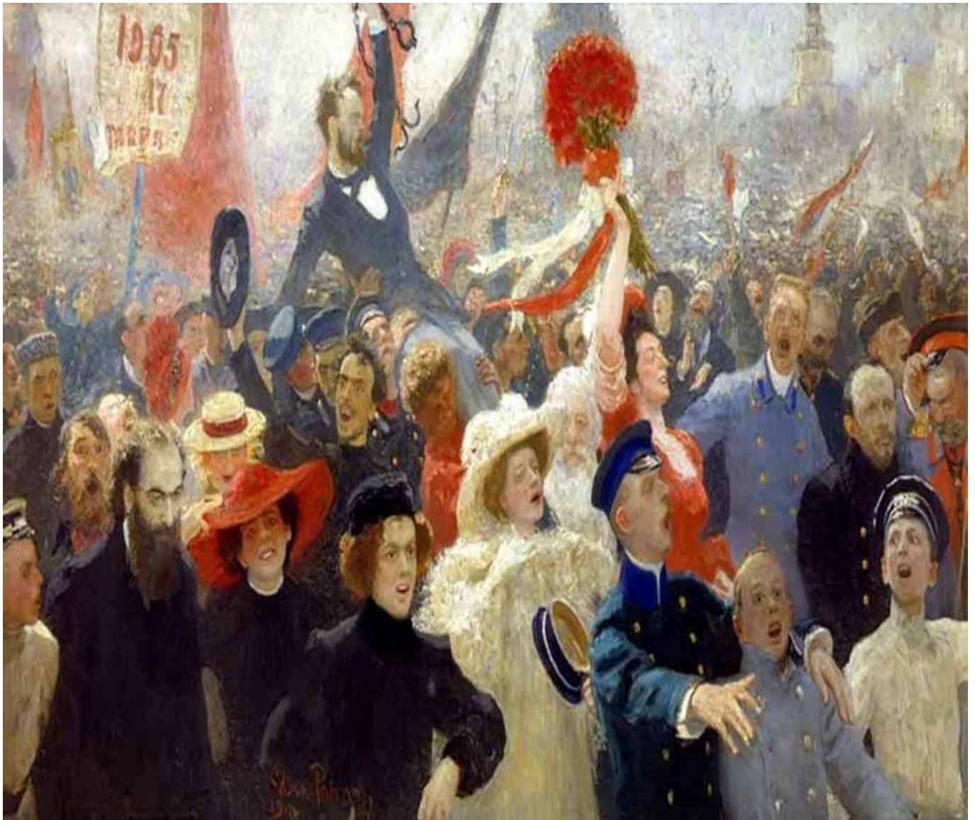
Рис. 1. Ликование по поводу объявления Манифеста 17 октября 1905 г.