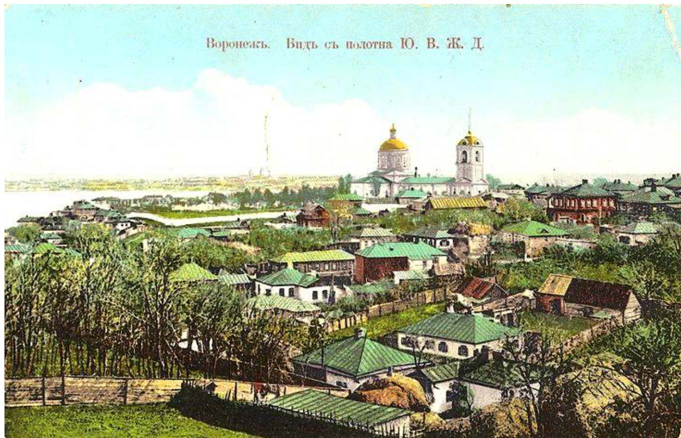
Рис. 5. Общий вид на город Воронеж.