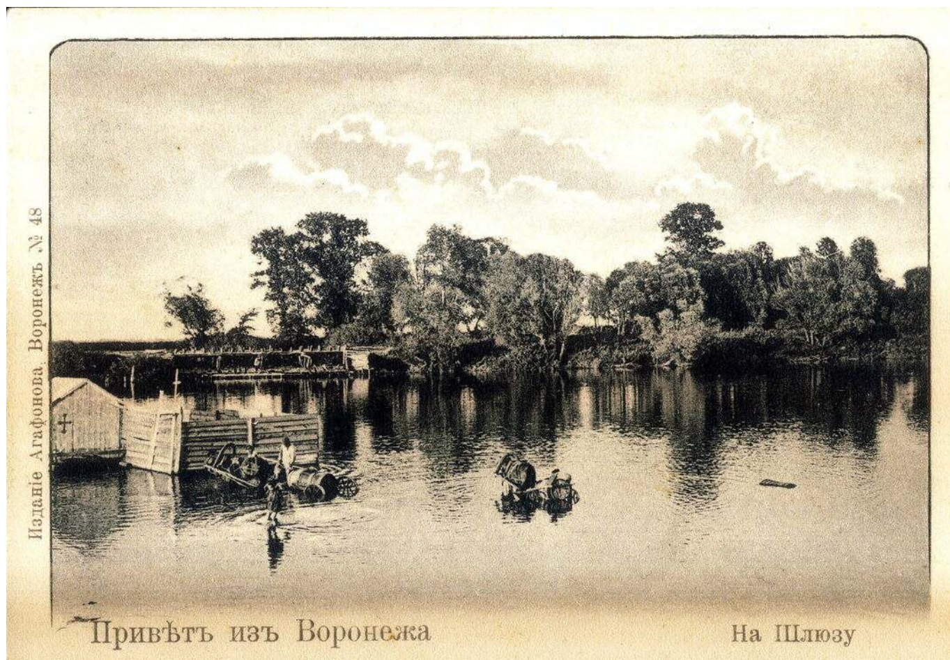
Рис. 6. Шлюз реки Воронеж.