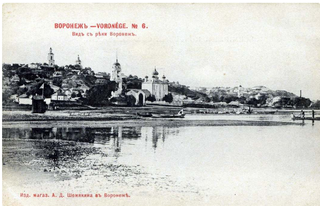
Рис. 2. Вид с реки Воронеж на город.