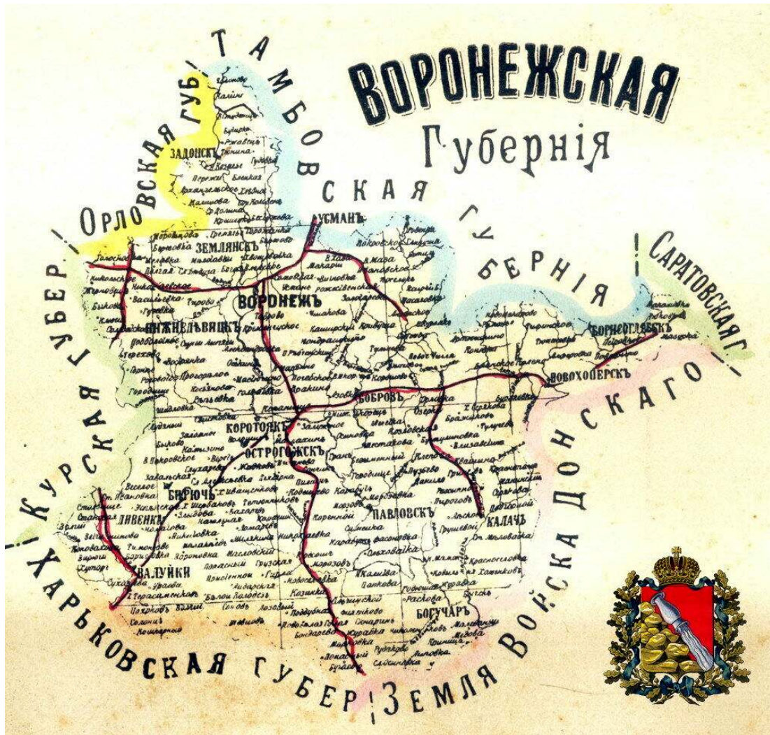
Рис.4. Воронежская губерния.