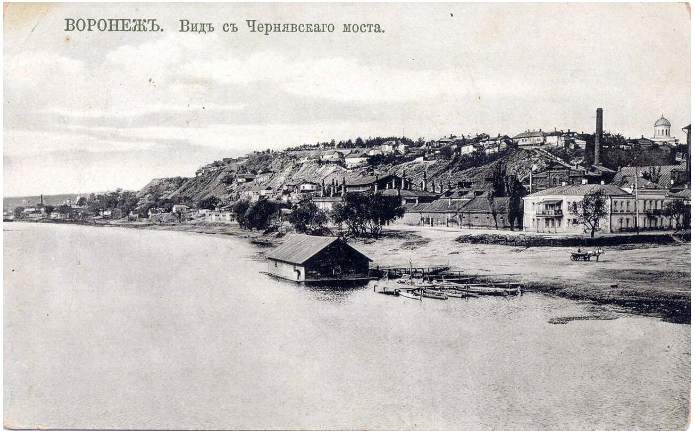
ВОРОНЕЖЪ. Видъ съ Чернавскаго моста.