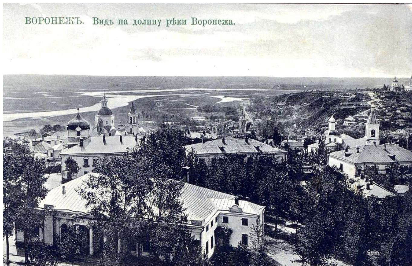
Рис. 1. Вид на долину реки Воронеж.