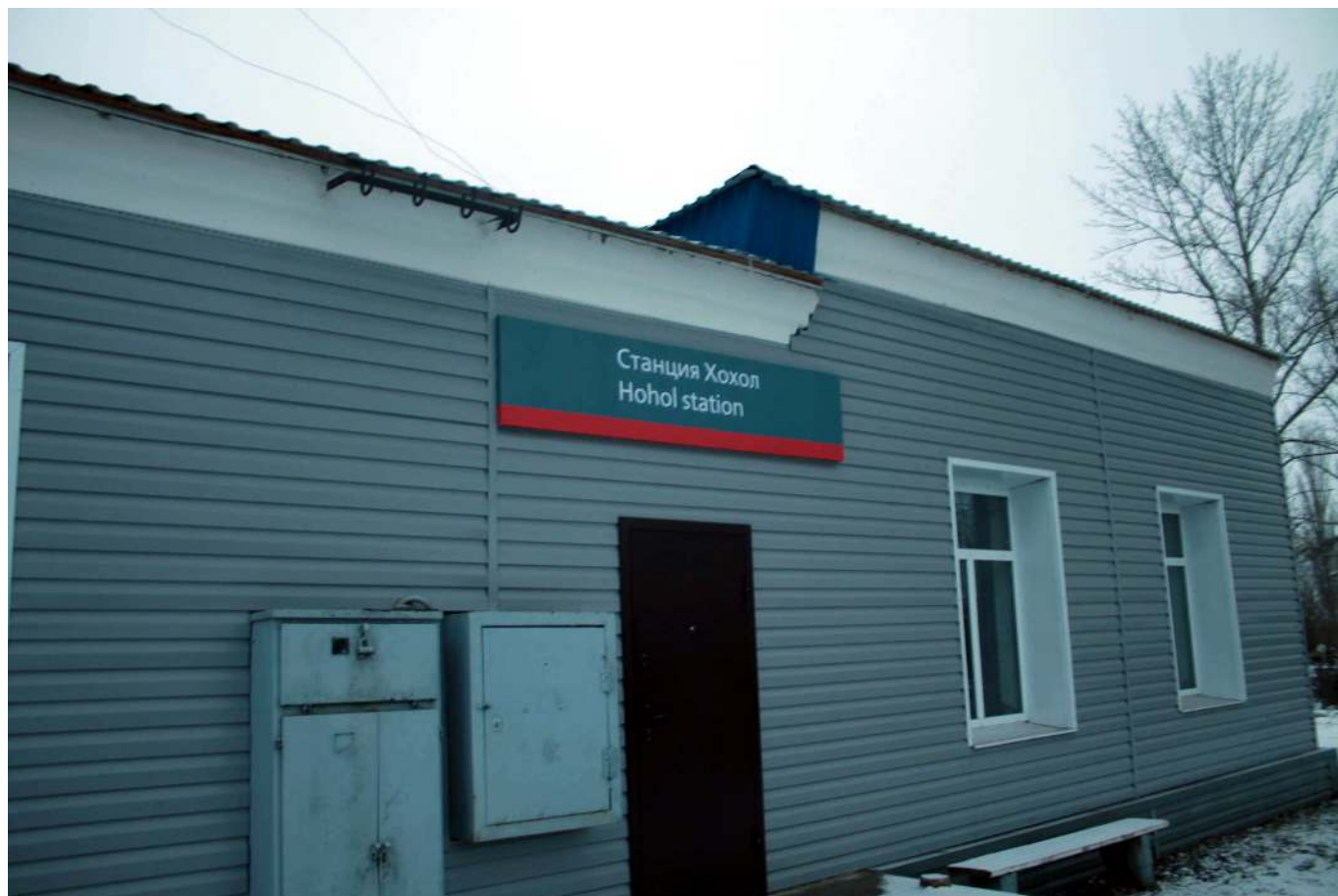
Рис. 5. Станция железнодорожная.