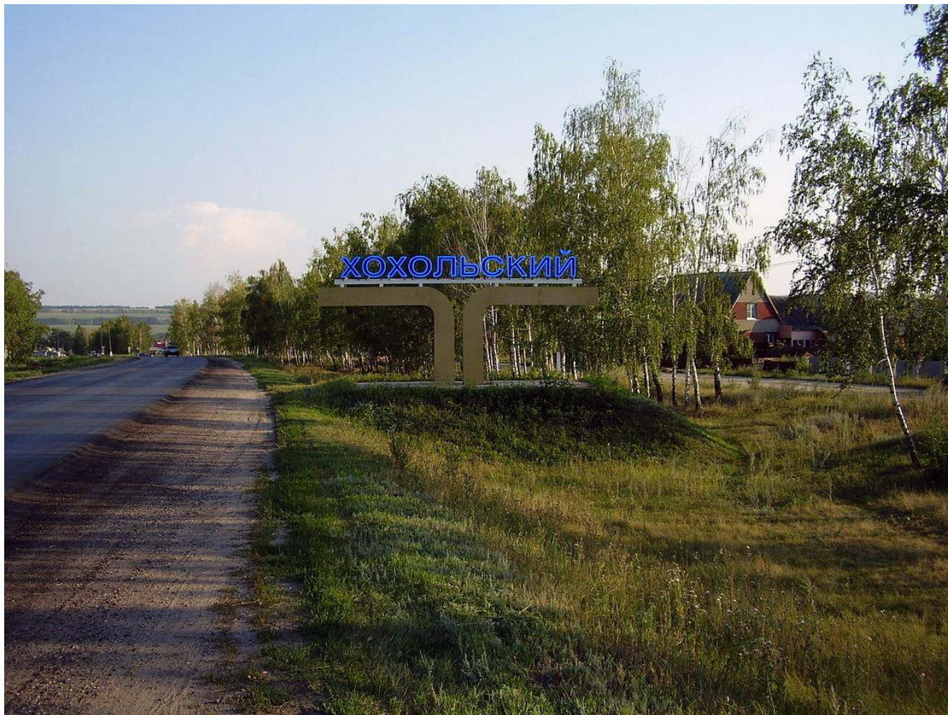
Рис. 1. Въезд в Хохольский.