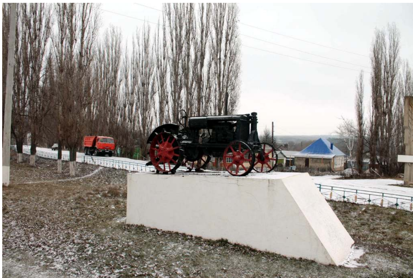
Рис.2. Памятник трактору.