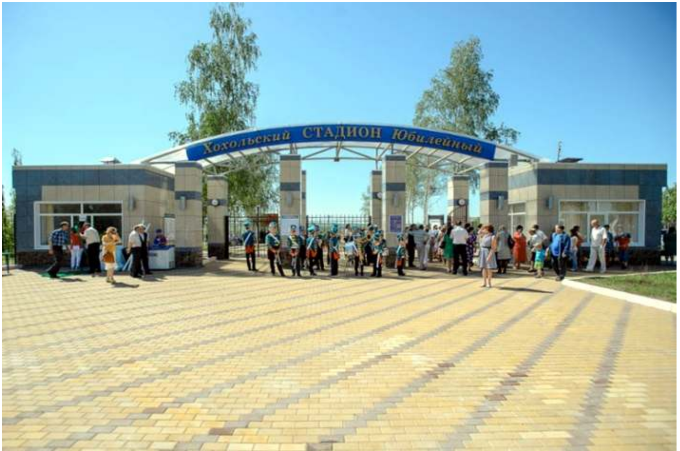
Рис. 3. Праздник на стадионе.