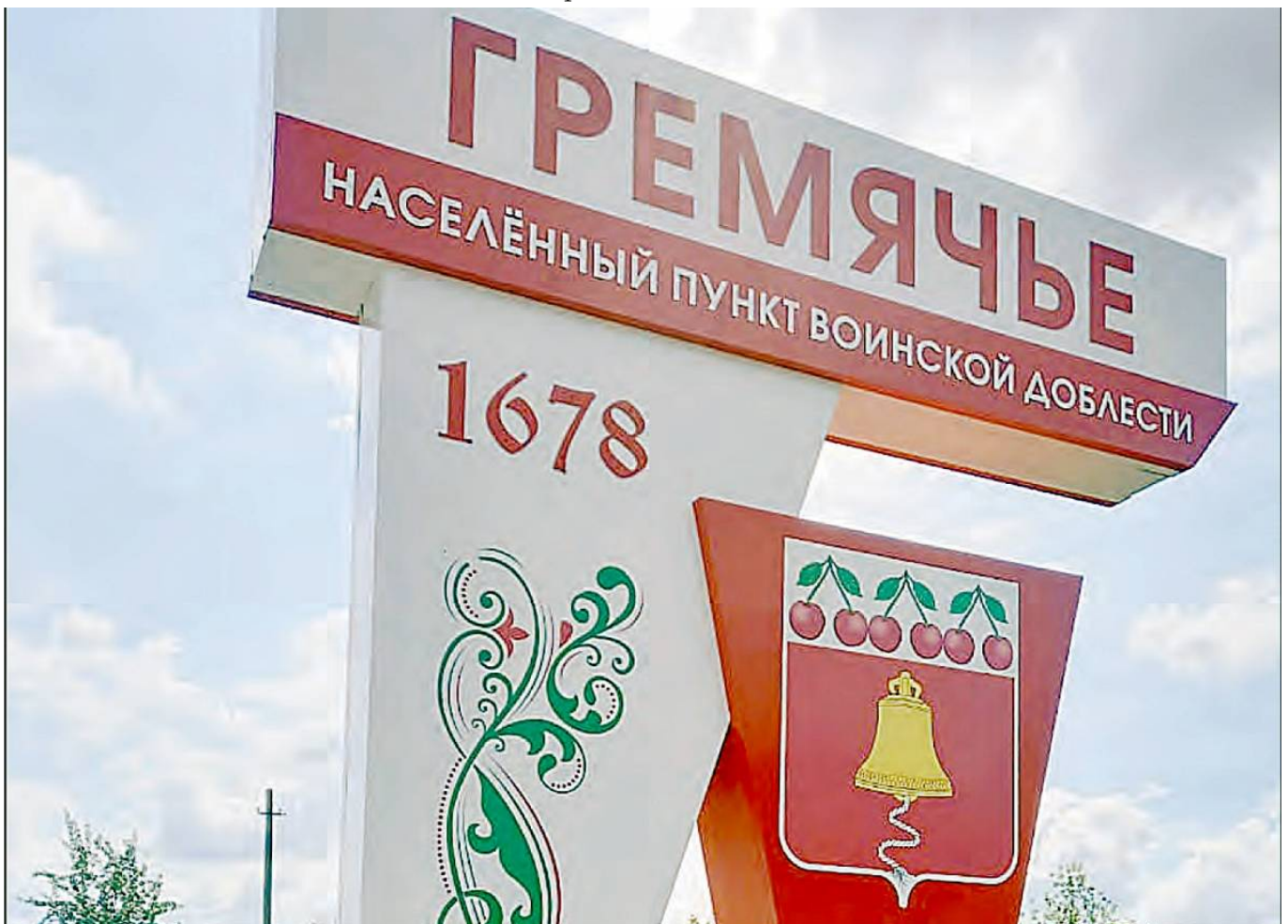
Рис.4. Село Гремяче.