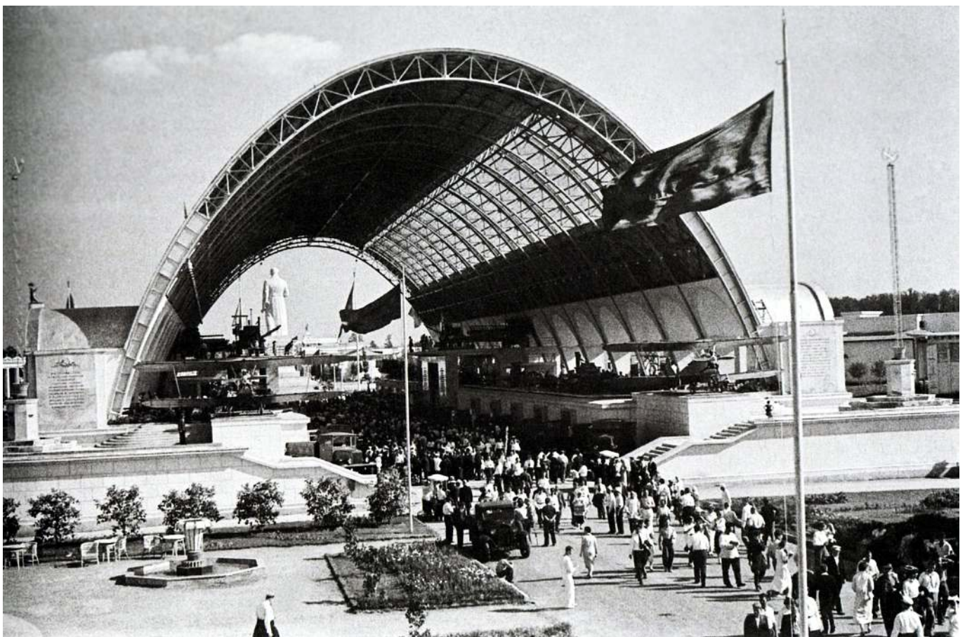
Рис. 2. Павильон Механизация на ВСХВ 1939г.