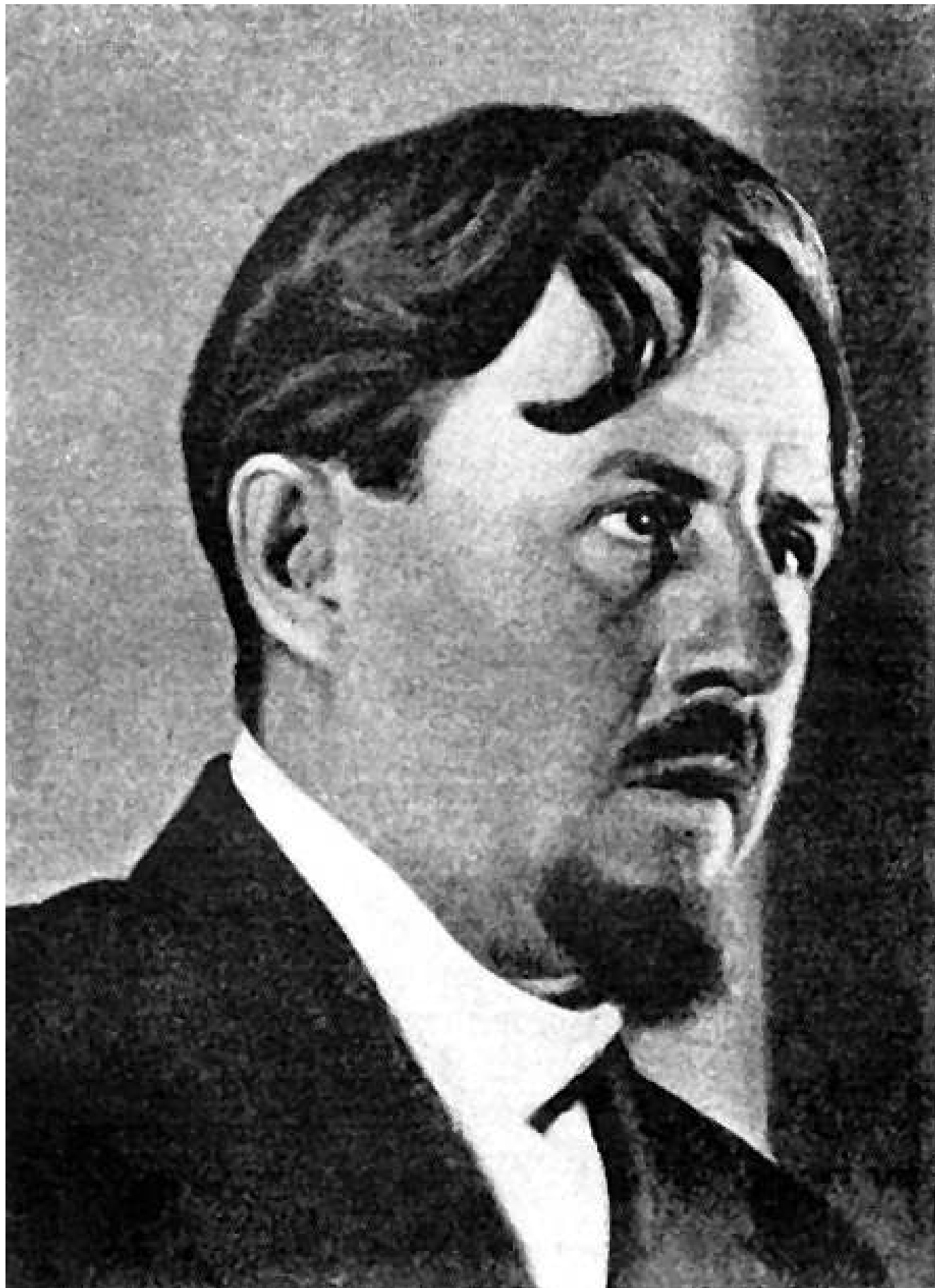
Рис. 4. Народный комиссар земледелия СССР - Чернов Михаил Александрович.