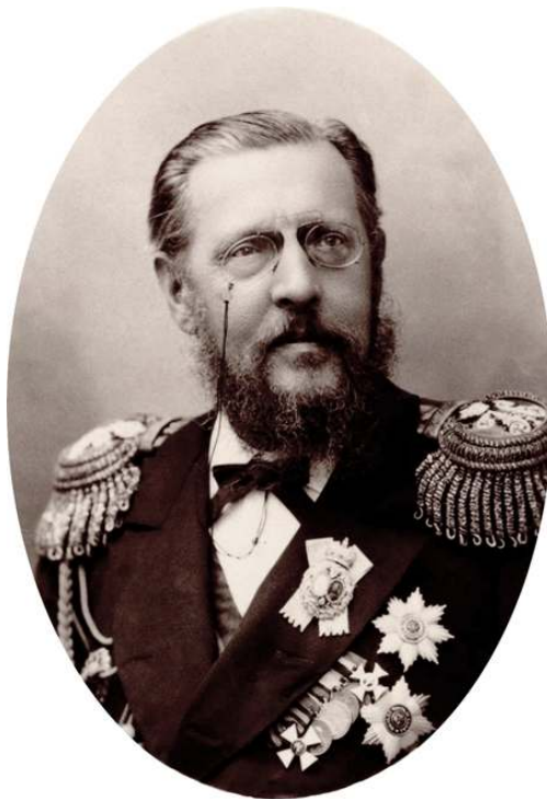
Рис. 1. Фотография Великого князя генерал-адмирала Константина Николаевича.

Наличие большого количества вышеприведенных опубликованных и неопубликованных источников, хранящихся в фондах РГА ВМФ и Российской национальной библиотеки в Санкт-Петербурге позволило написать кандидатское диссертационное исследование по направлению 5.6.1 – Отечественная история «Научная деятельность С.И. Елагина – основателя первой российской военно-морской исторической школы (1850 – 1868 гг.)».