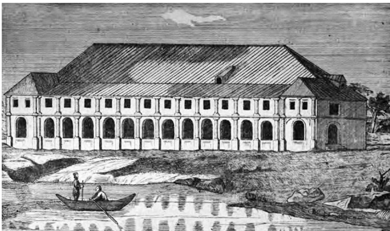
Рис. 3. Рисунок С.И. Елагина магазина в Воронеже на месте Адмиралтейства начала XVIII в., уцелевшего при пожаре в 1748 г.