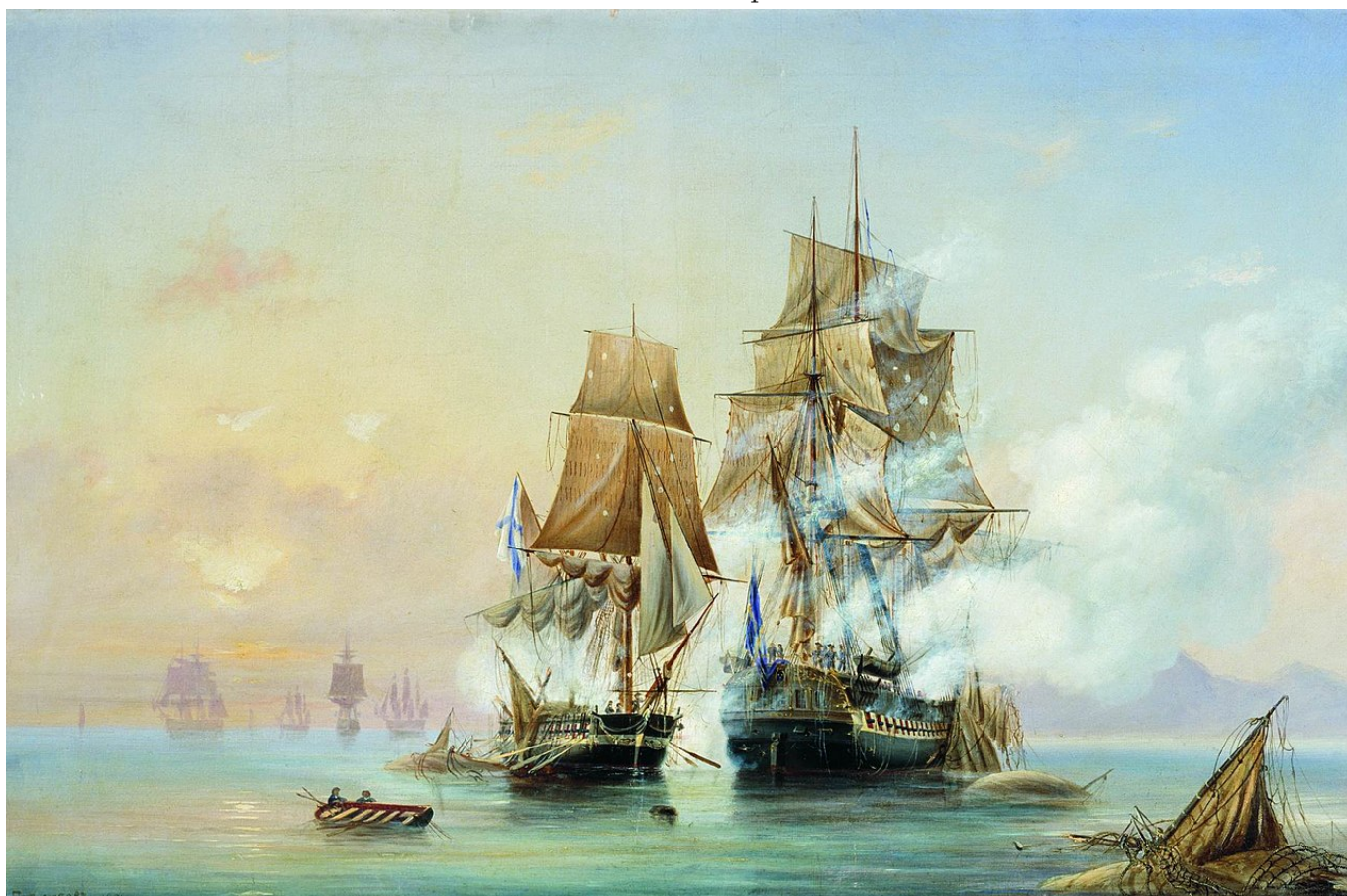
Рис. 2. Захват шведского фрегата "Венус".