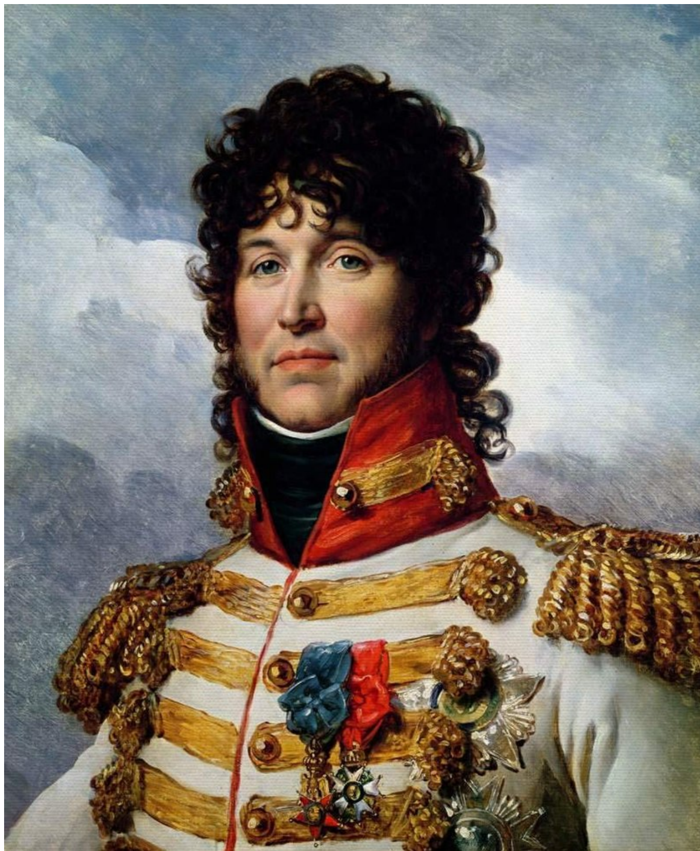
Рис. 3. Иоахим Мюрат - правитель Неаполя.