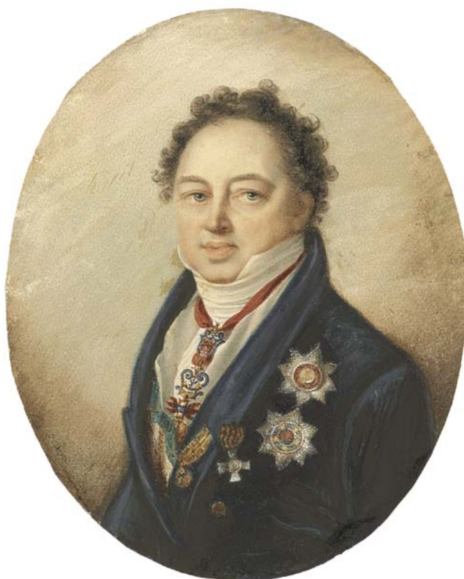
Рис. 5. Русский посол Д. П. Татищев.