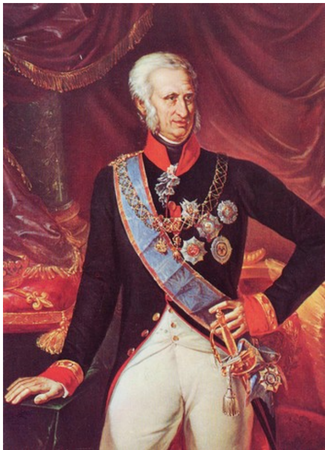
Рис. 4. Коороль Сицилии Фердинанд.