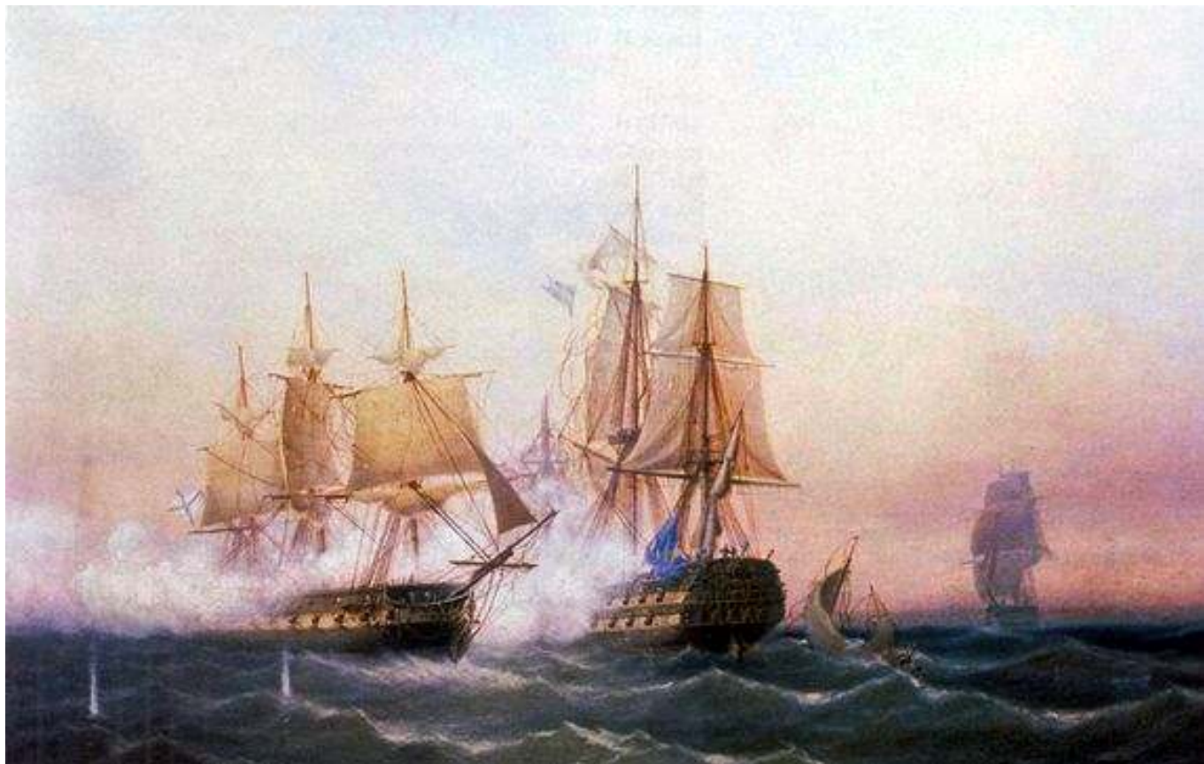
Рис. 1. Захват шведского корабля "Ретвизан".