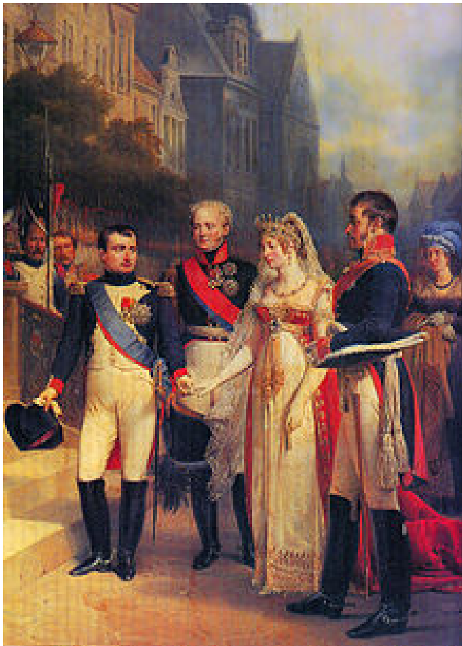
Рис. 7. Дом культуры в Острогжске.