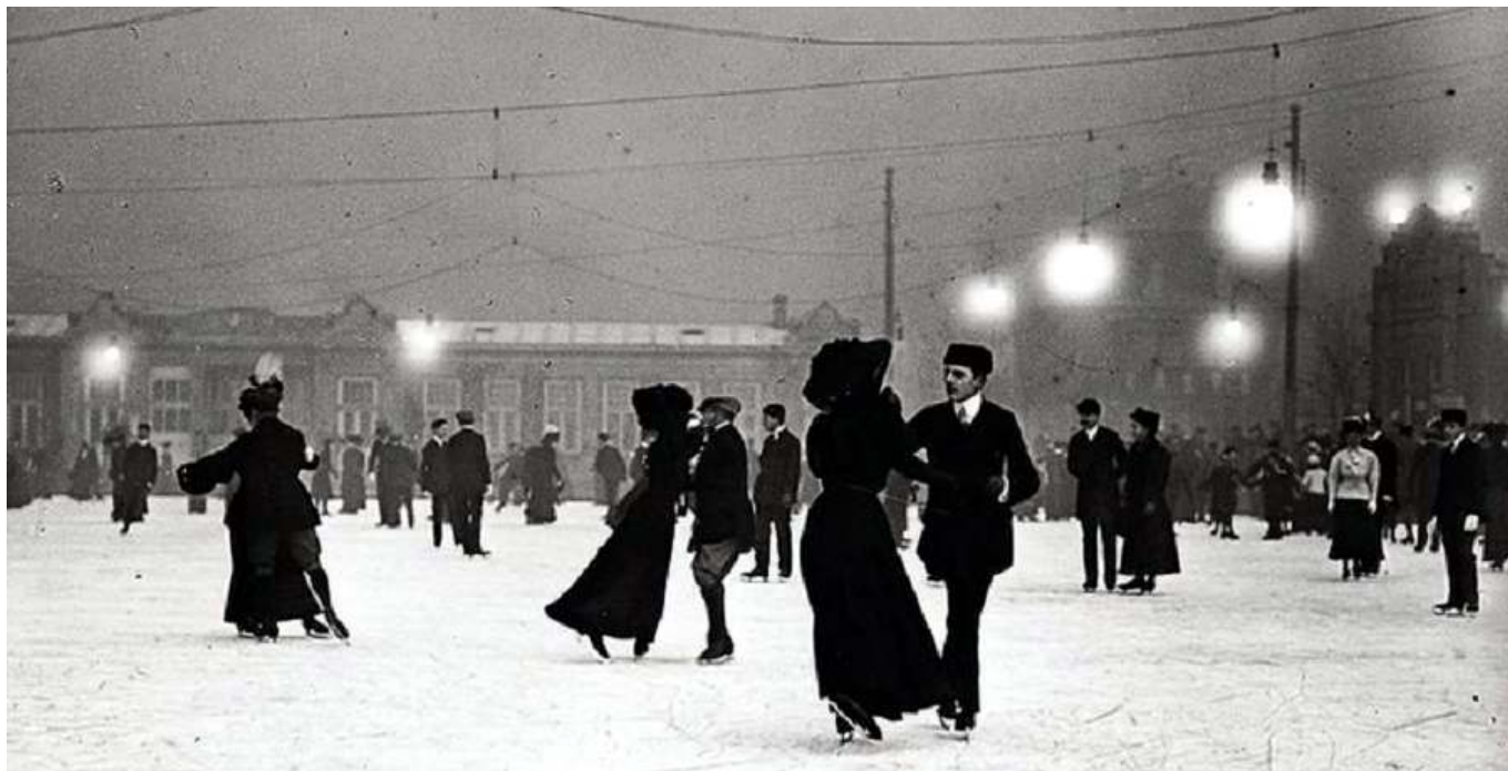
Рис. 1. Каток в Москве.