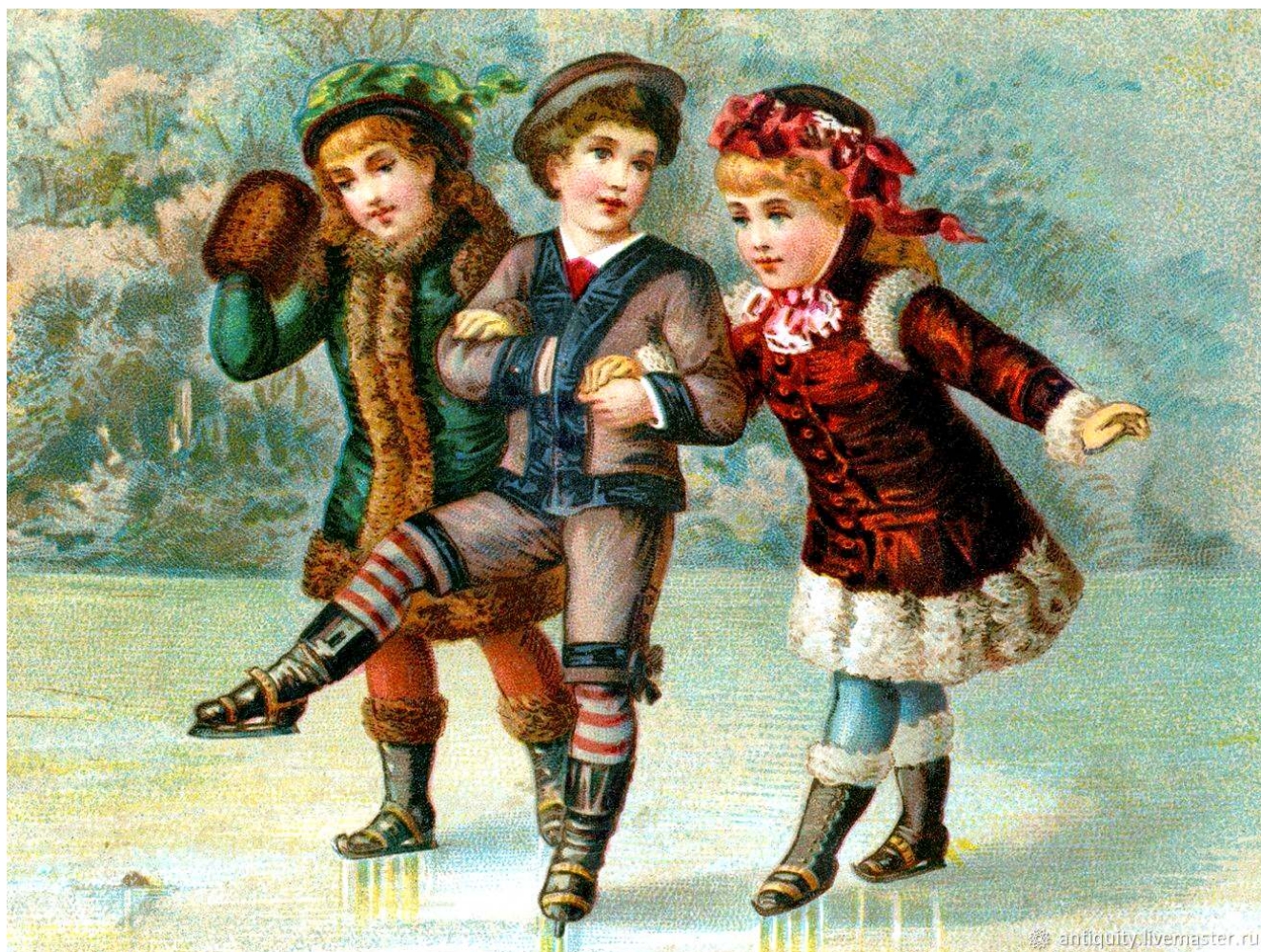
Рис. 5. Старинная открытка.