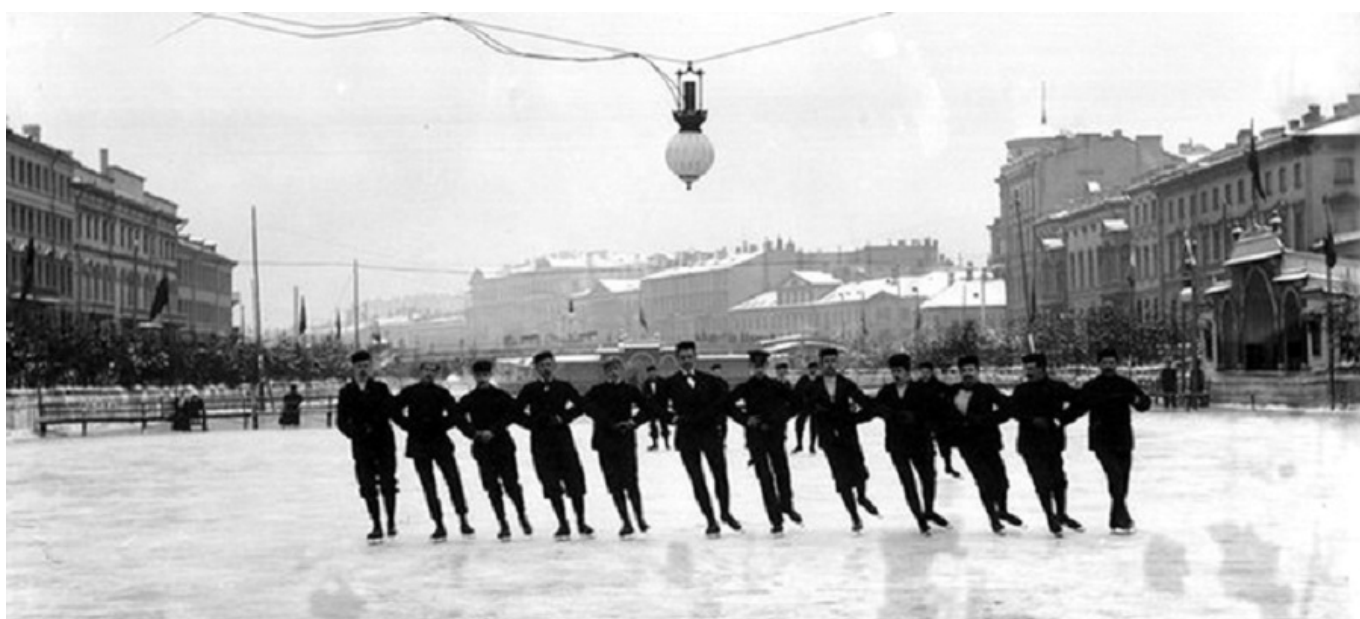
Рис. 2. Конькобежцы наа реке Фонтанка.