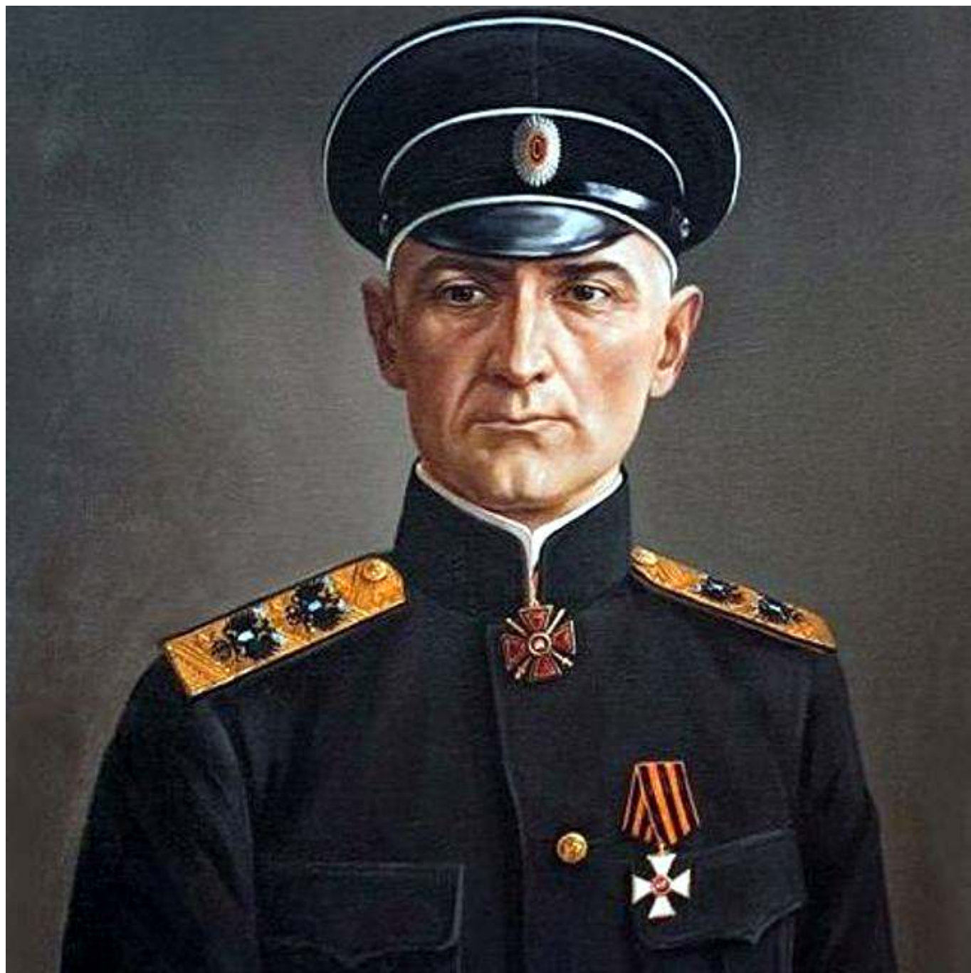
Рис. 1. А. В. Колчак.