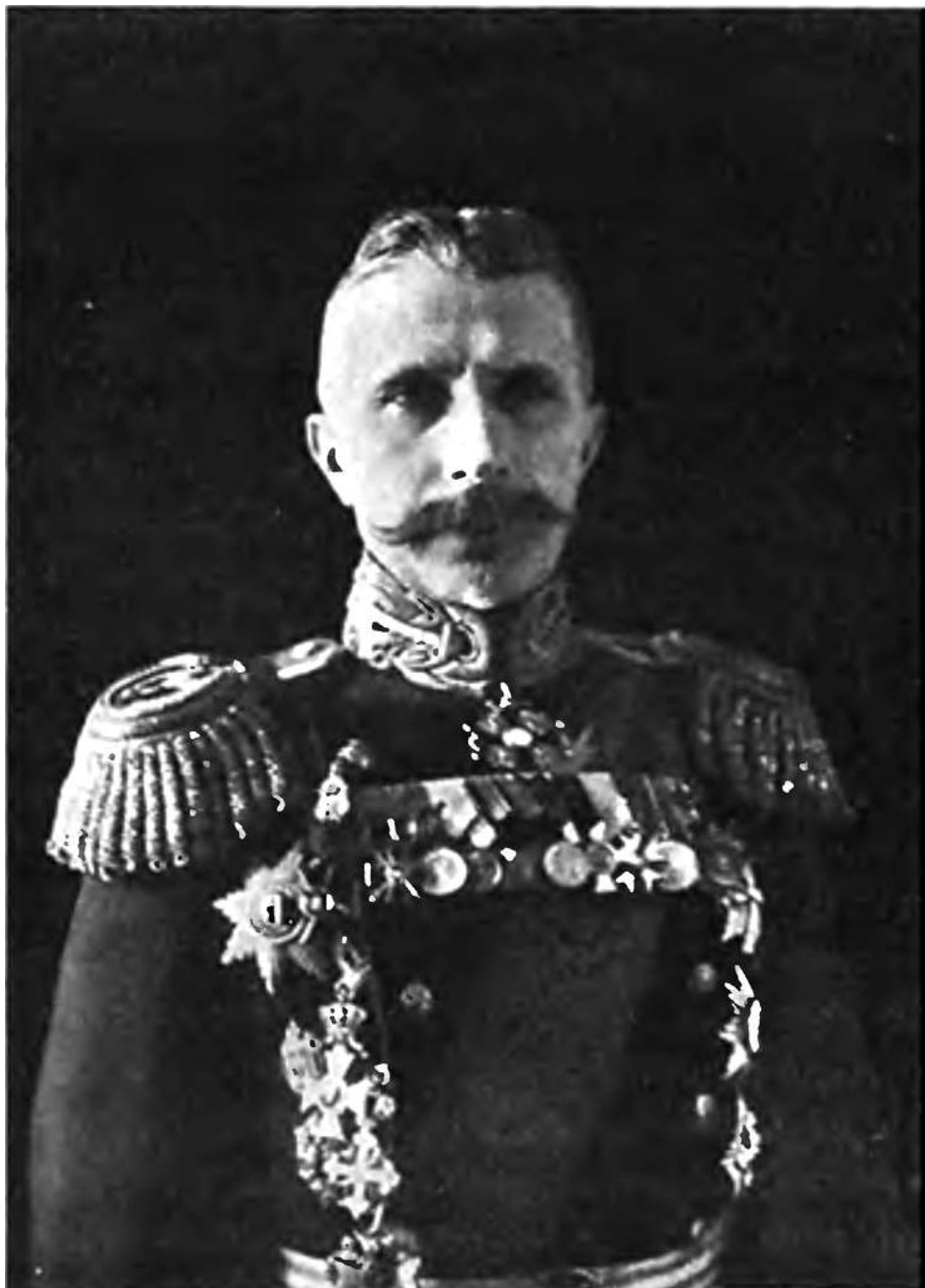
Рис. 3. Начальник Главного Морского Штаба А. И. Русин.