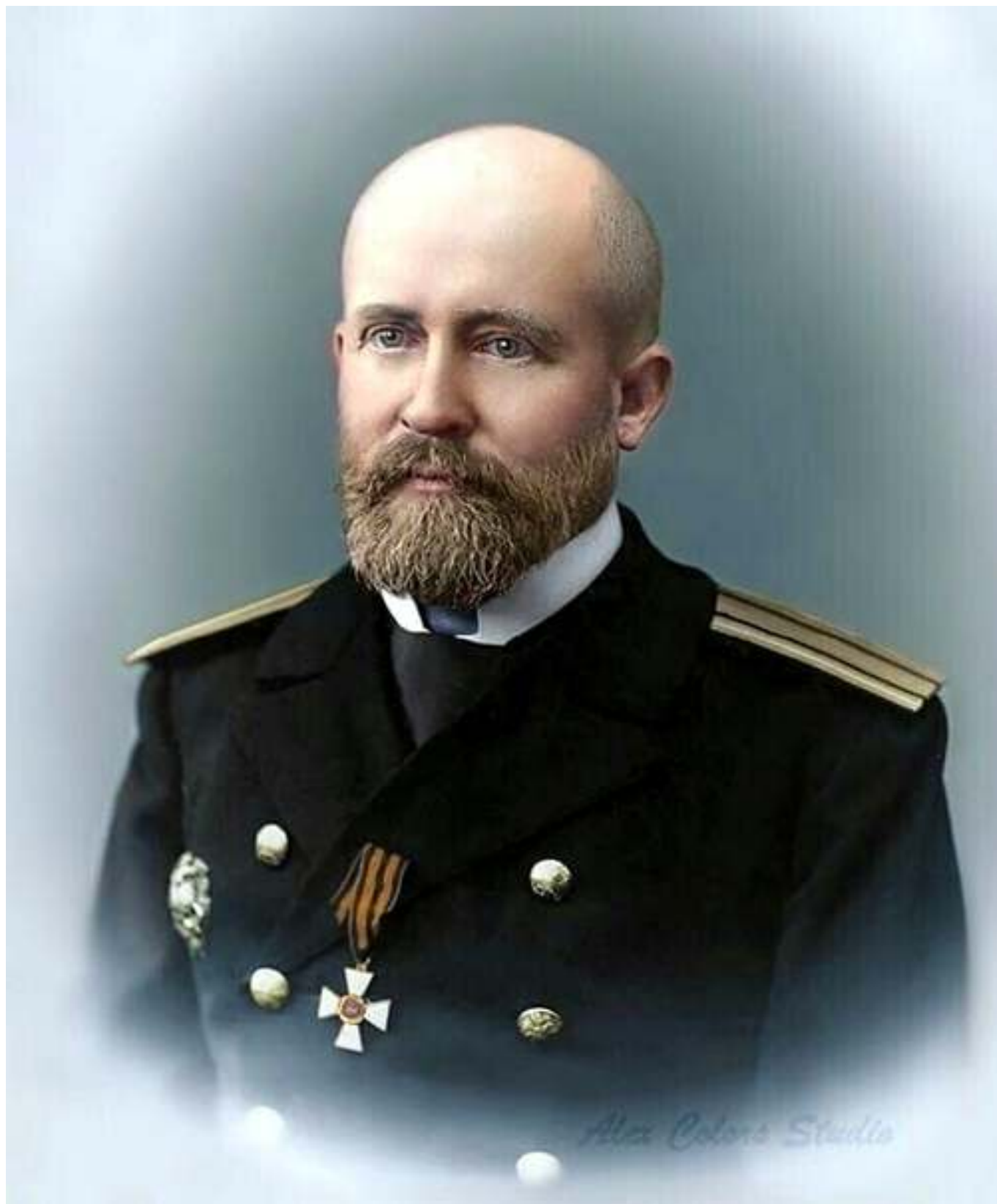
Рис. 2. Н. О. фон Эссен, капитан первого ранга.