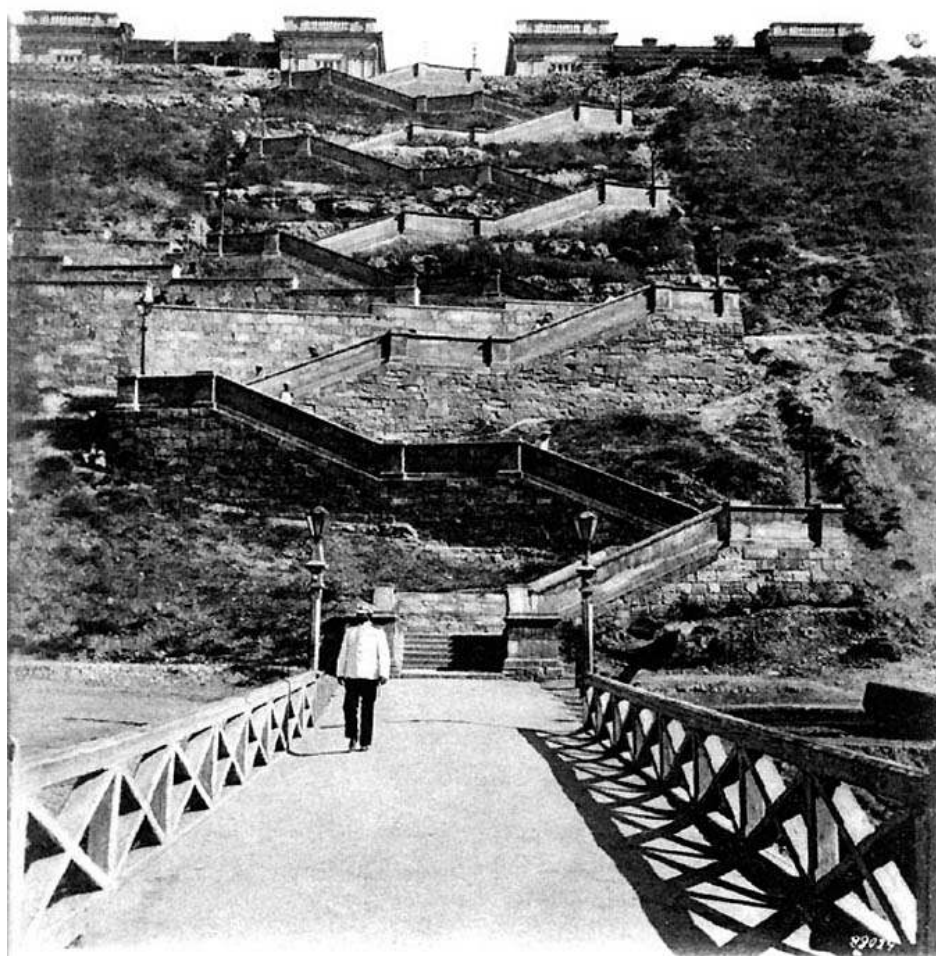
Рис. 4. Военный спуск к Южной бухте.