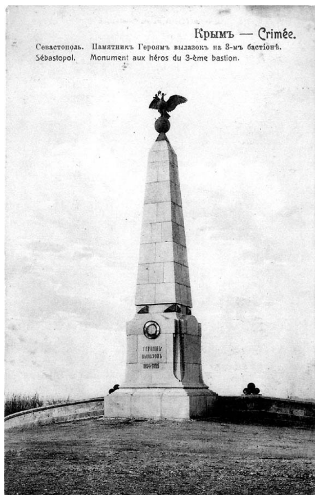
Рис. 6. Памятник героям вылазок Третьего бастиона.