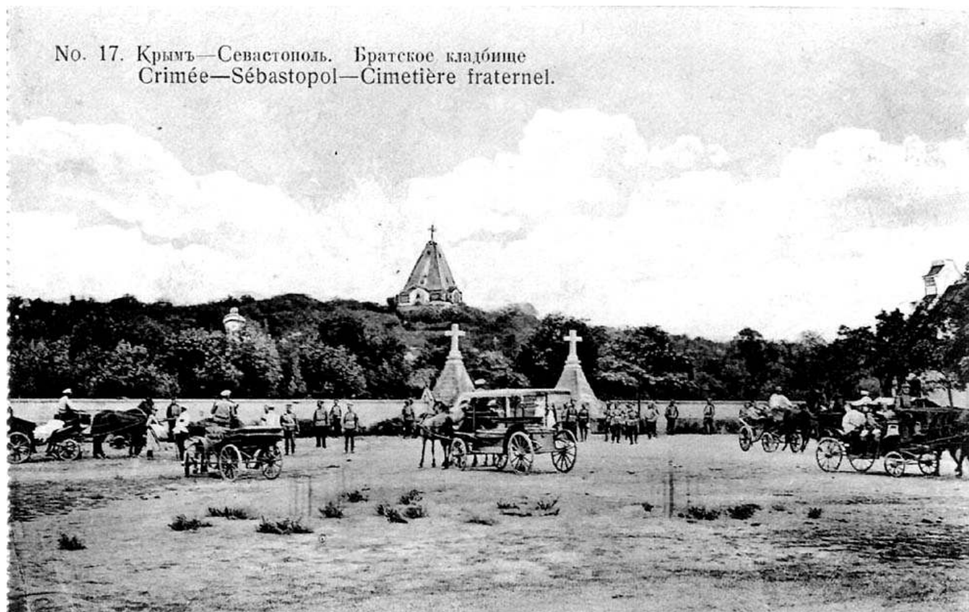
Рис. 2. Братское кладбище.