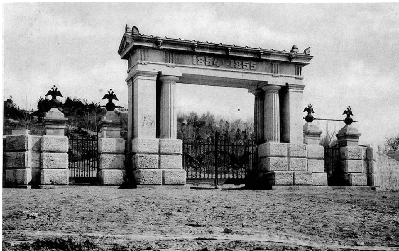
Рис. 5. Малахов курган.