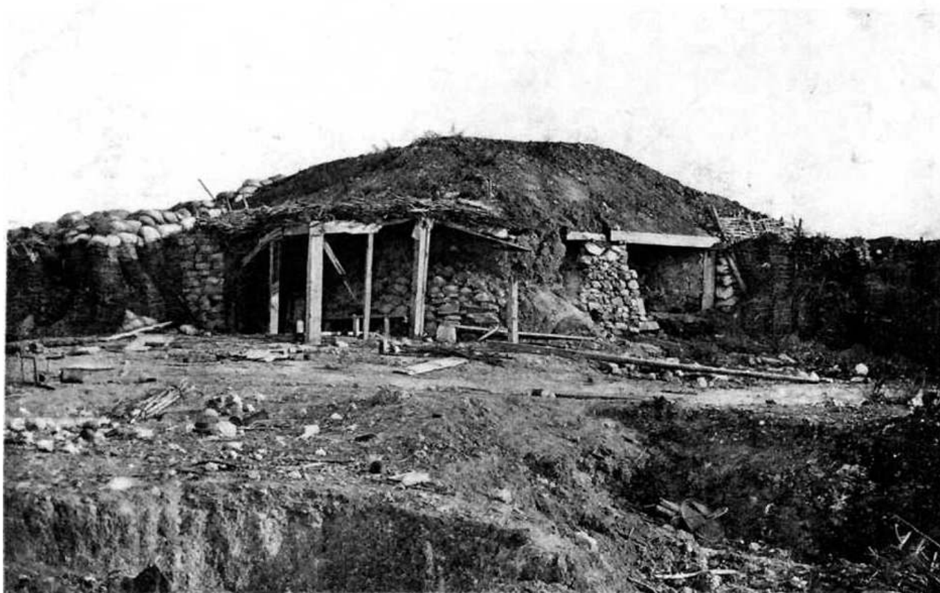
Рис. 1. Блиндаж начальника Третьего бастиона.