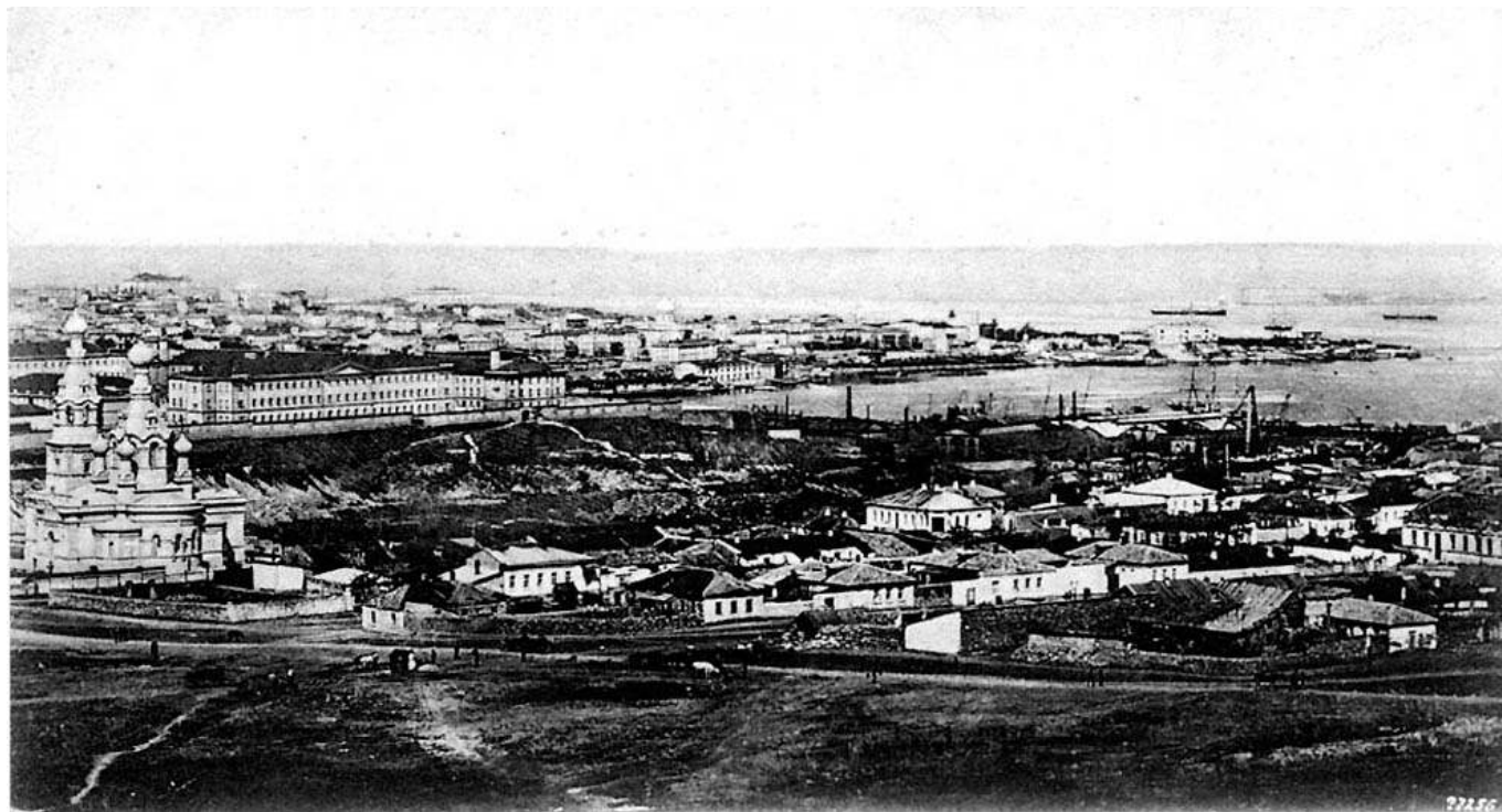
Рис. 3. Вид с Малахова кургана.