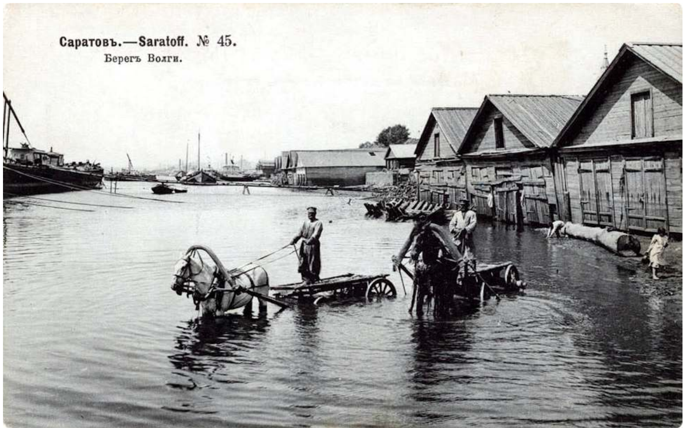
Рис. 1. Берег Волги. Саратов.