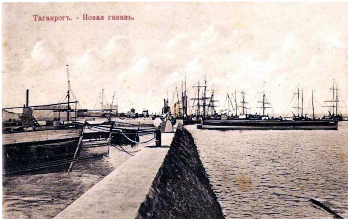
Рис. 5. Новая гавань в Таганроге.