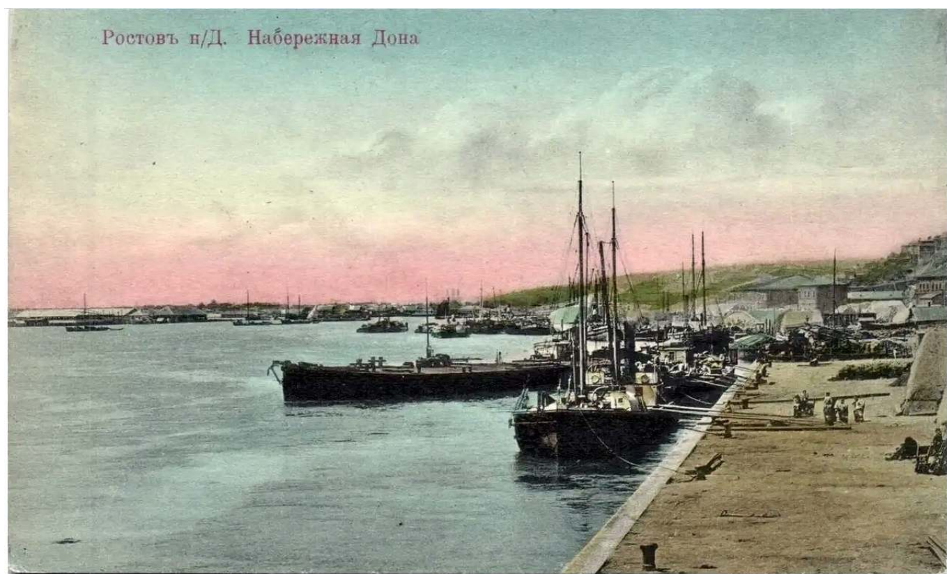
Рис. 6. Ростов-на-Дону.