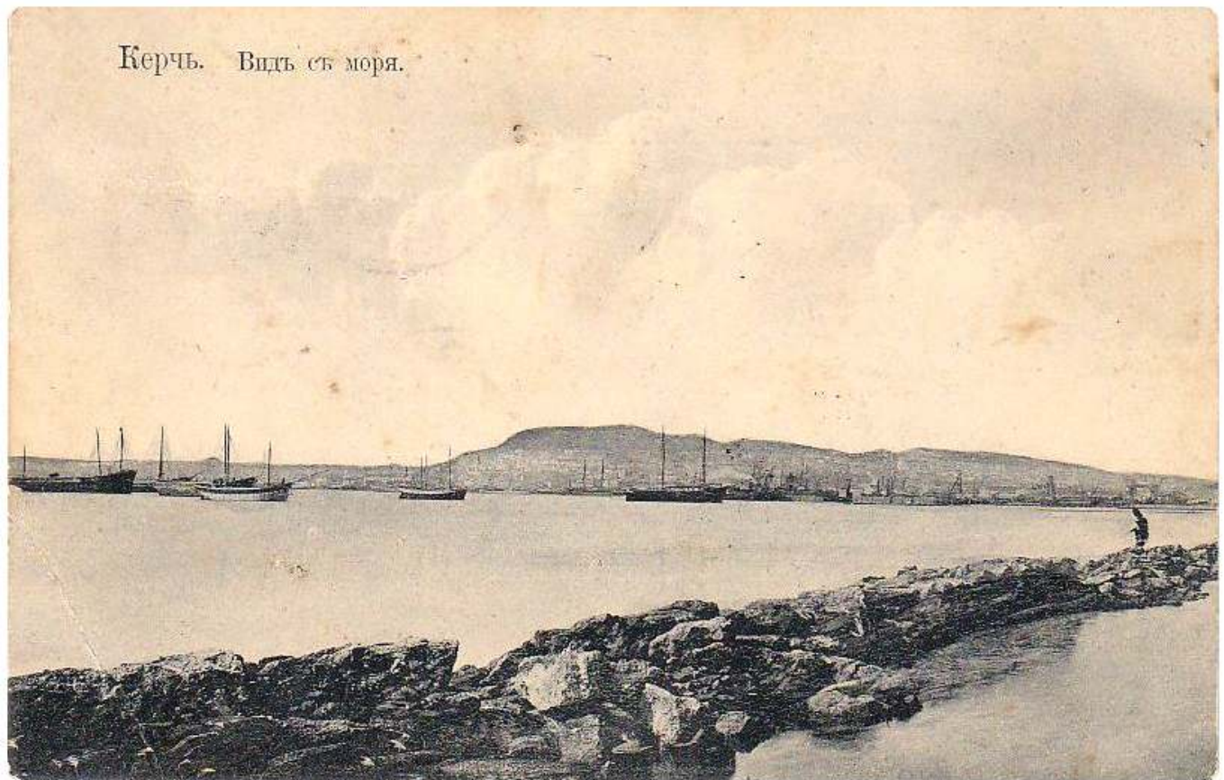
Рис. 2. Керчь вид с моря.