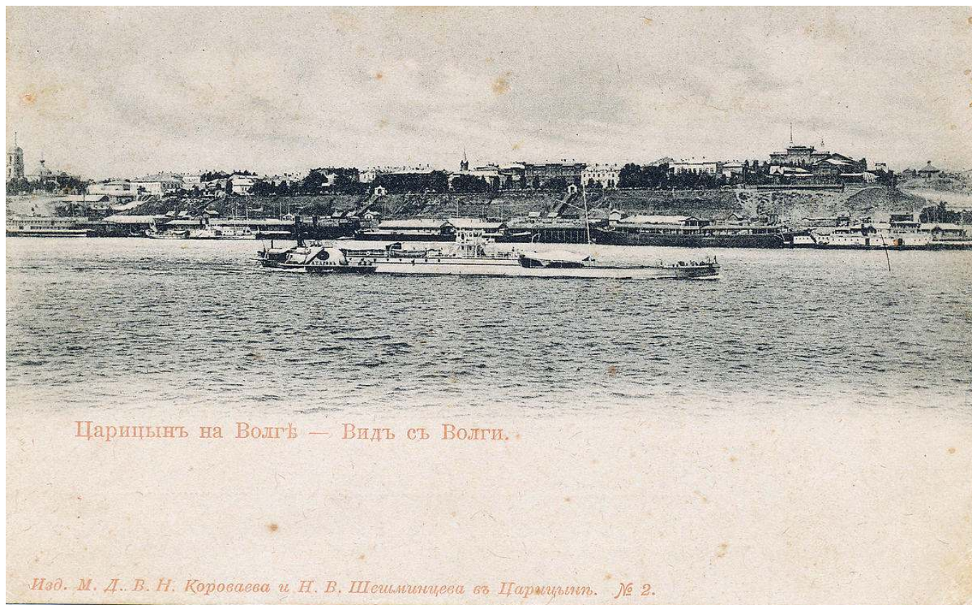
Рис. 7. Царицын вид с реки Волга.