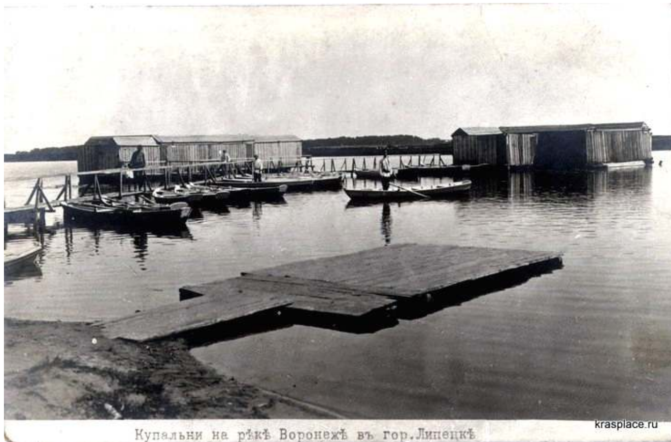
Рис. 3. Купальня на реке Воронеж в Липецке.