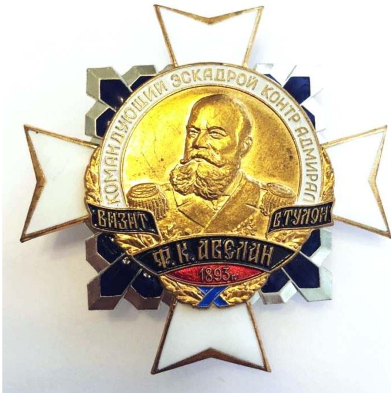
Рис. 1. Знак посвященный визиту в Тулон.