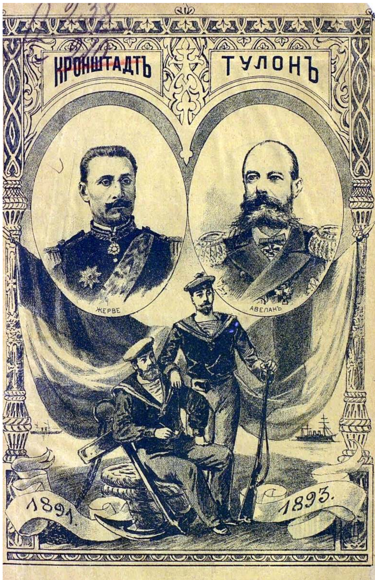
Рис. 5. Страница из книги о визите русских моряков в Тулон.