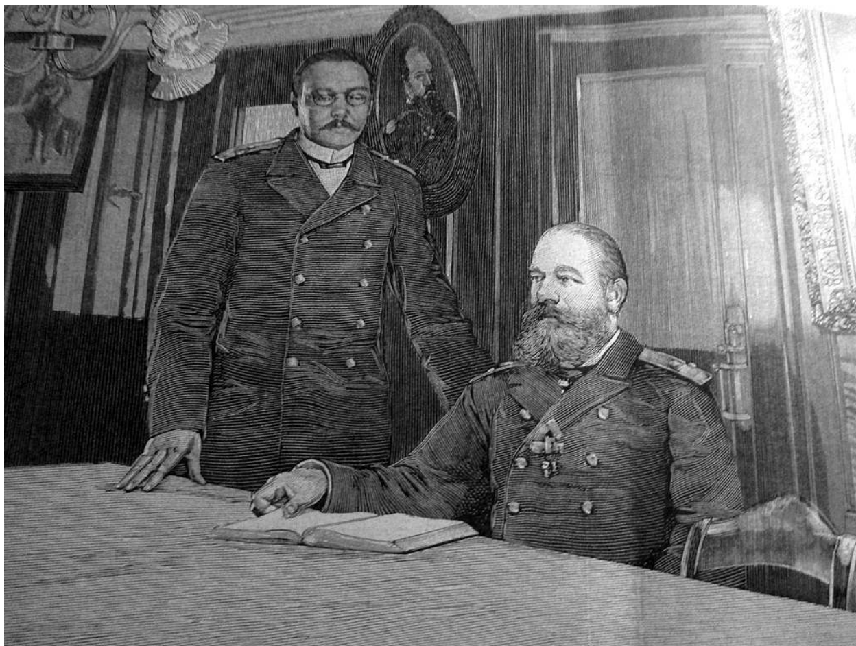
Рис. 4. Ф. К. Авелан на борту корабля "Память Азова".