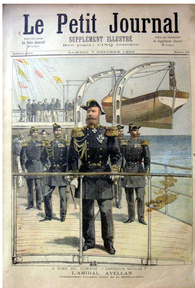
Рис. 7. Французский еженедельник с изображением Ф. К. Авелана.