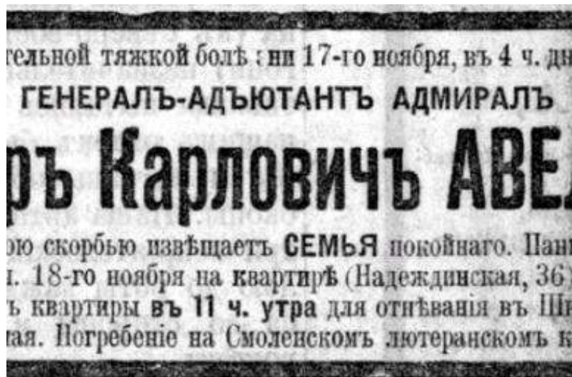
Рис. 2. Некролог Ф. К. Авелана.