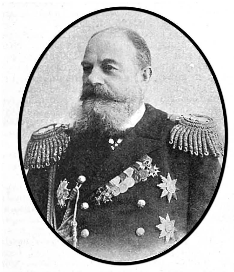
Рис. 6. Федор Карлович Авелан.