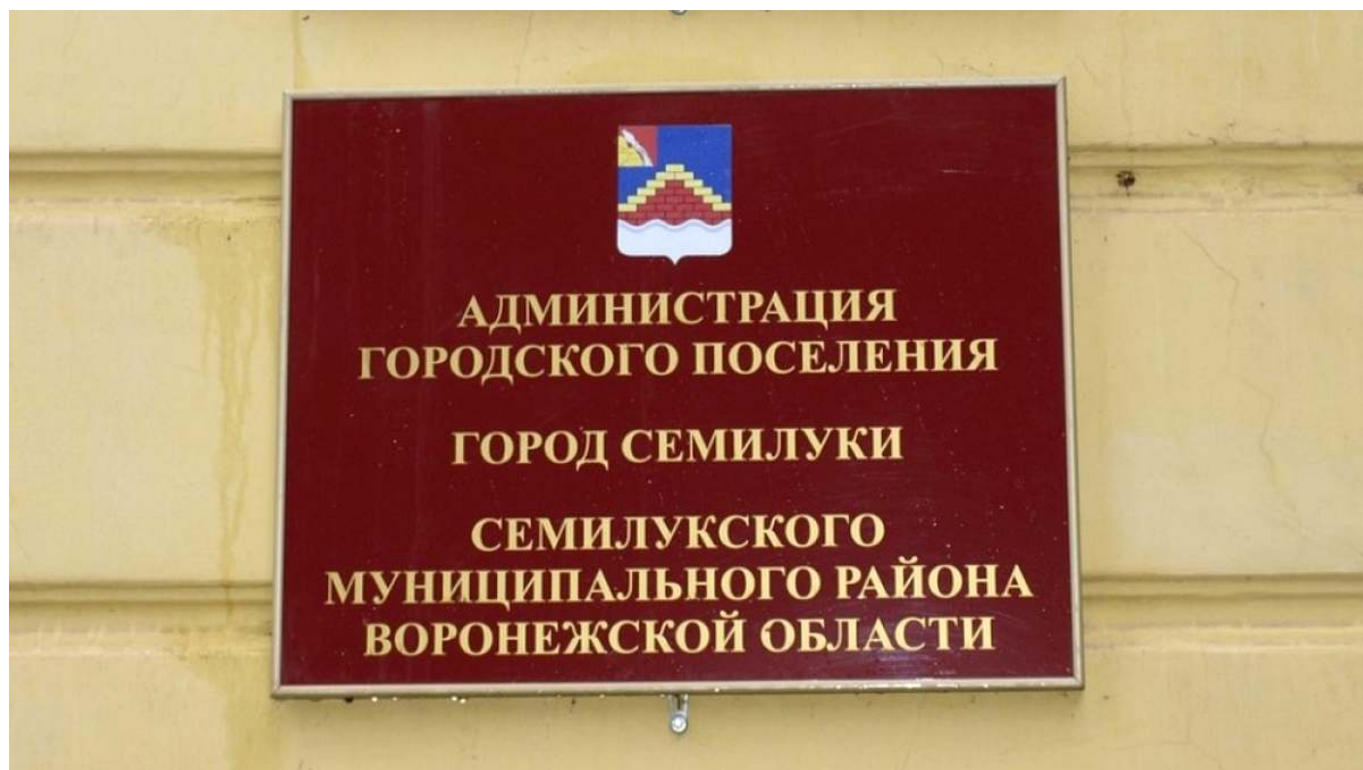
Рис. 1. Администрация г. Семилуки.

гарантирует плодотворное сотрудничество в решении проблем на местном уровне между муниципальной властью и общественностью. Нельзя не учитывать, что в 2022 г. заканчивается только первый этап первоначального благоустройства российских городов, что позволяет администрации города Семилуки применить на практике накопленный опыт впоследствии.