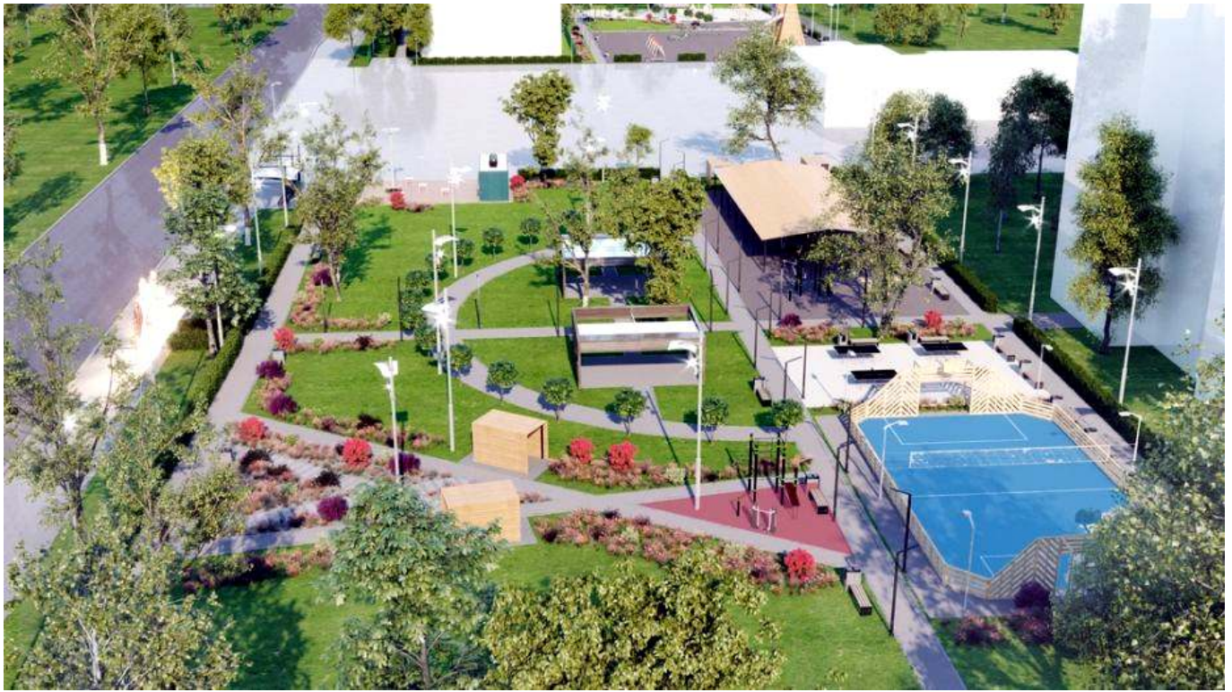
Рис. 4. План благоустройства парка в городе Семилуки.