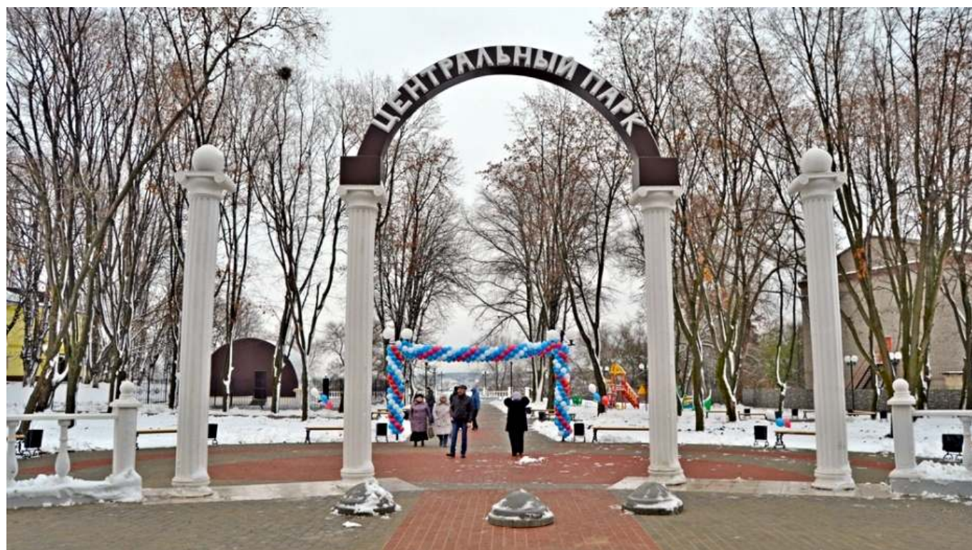
Рис. 2. Благоустроенный центральный сквер г. Семилуки.