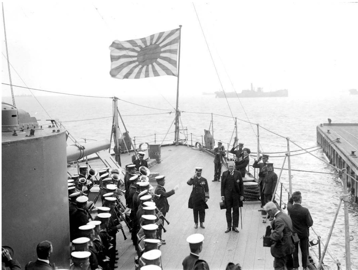
Рис. 5. Японский флот 1928 г.