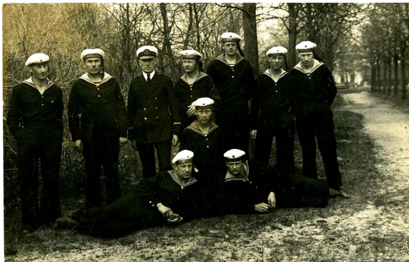
Рис. 4. Латвийские моряки.