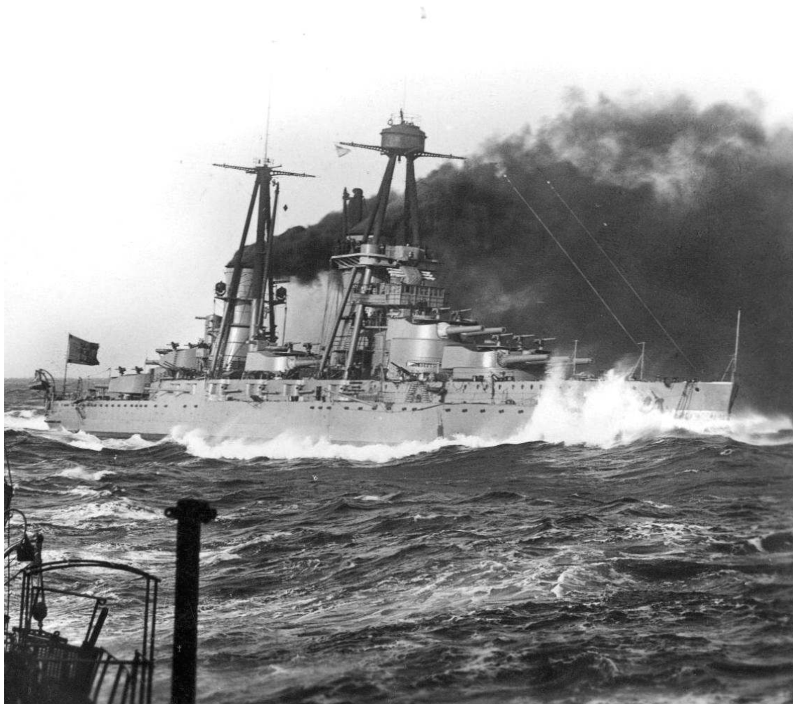
Рис. 3. Итальянский линкор "Джулио Цезаре".