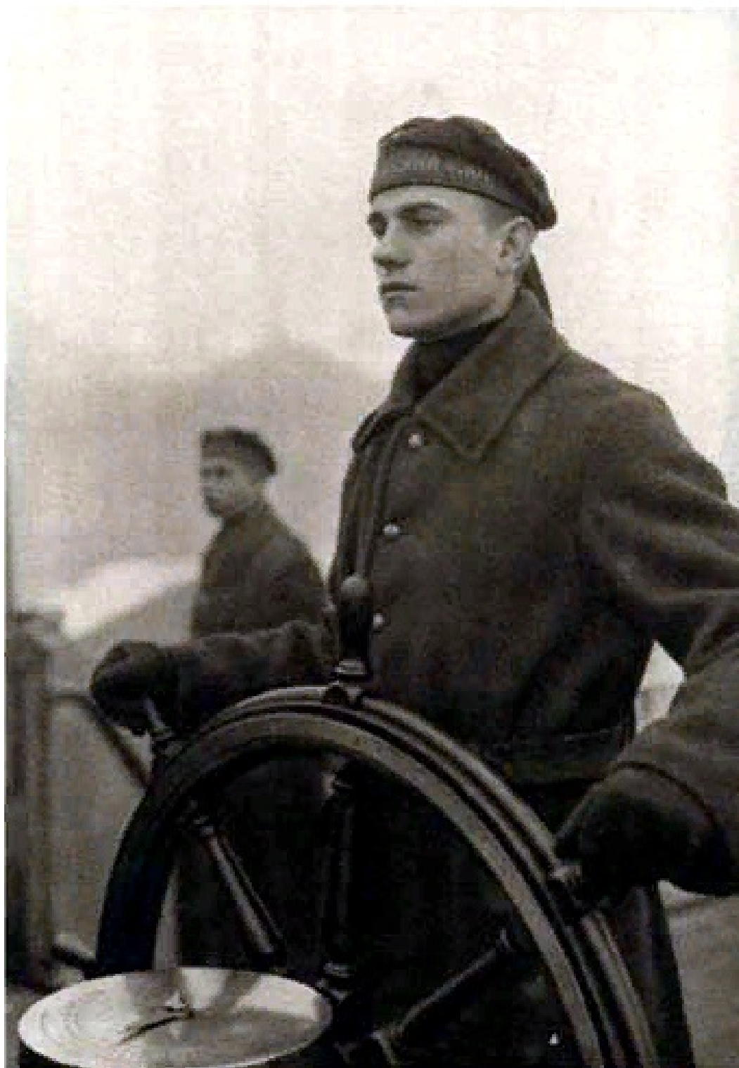
Рис.5. Рулевой флота.