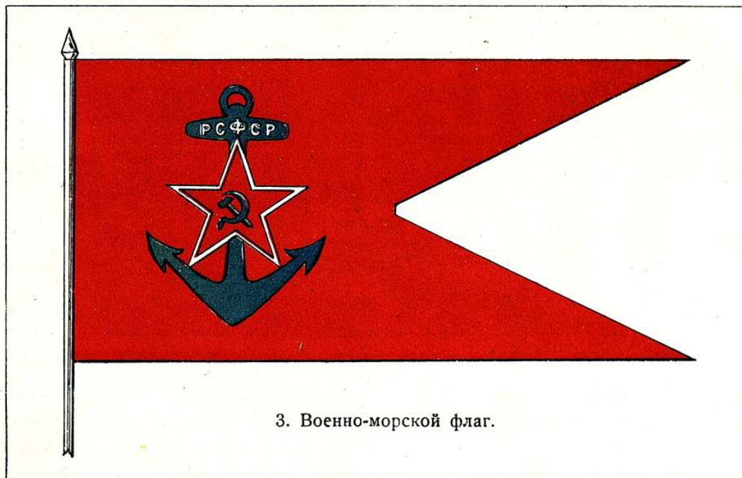
Рис.1. Военно-Морской флаг.

Интересно, что в следующем разделе военно-морской пропагандистской книги А.И. Холодняк решил все же познакомить советских пионеров с корабельным составом флотов иностранных держав.