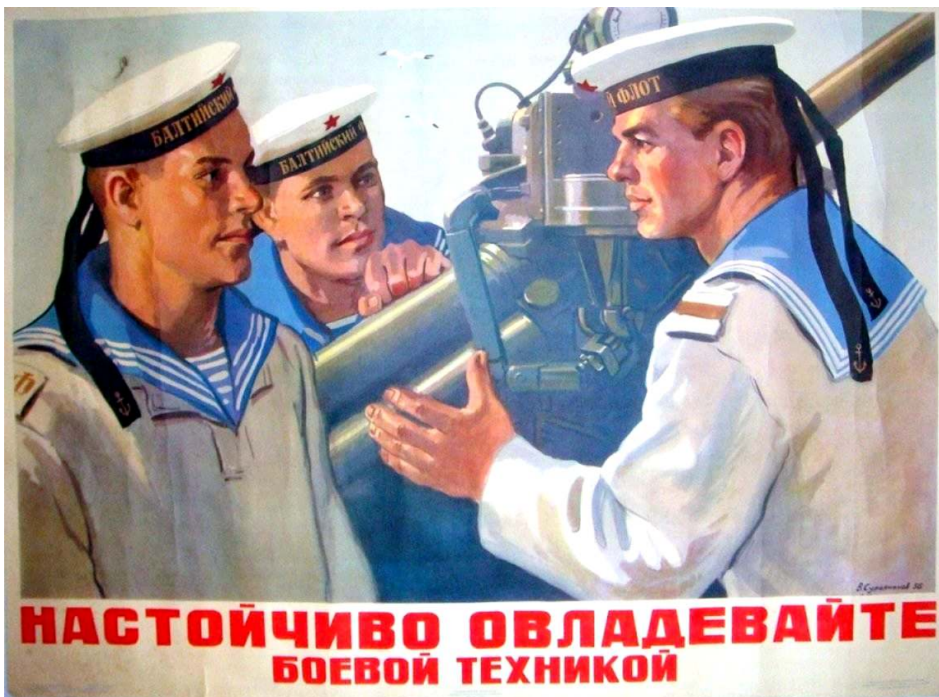
Рис.4. Плакат "Учеба на флоте".