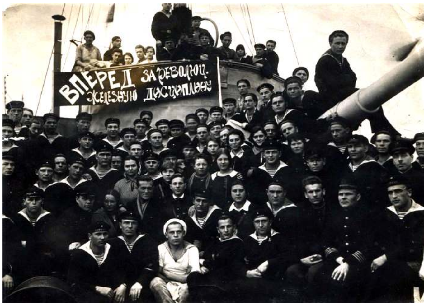
Рис.2. Военнослужащие РККФ.