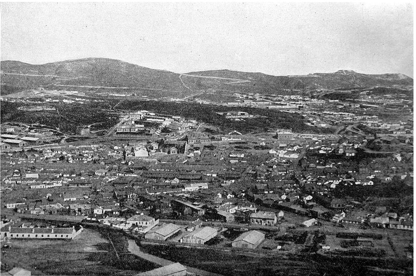
Рис.6. Туземный квартал в Порт-Артуре.