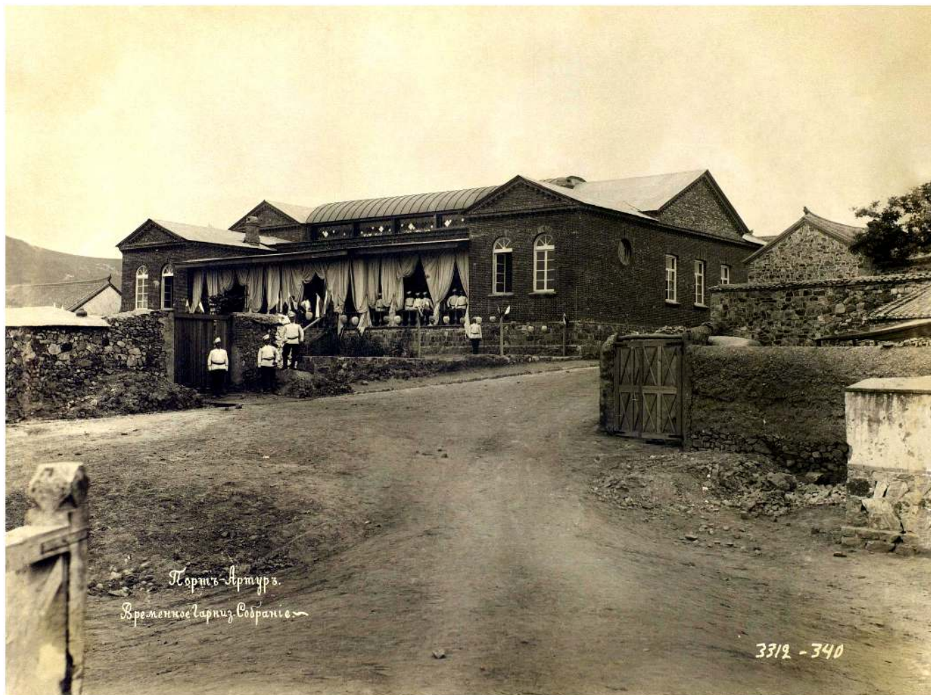
Рис. 3. Гарнизонное собрание в Порт-Артуре.