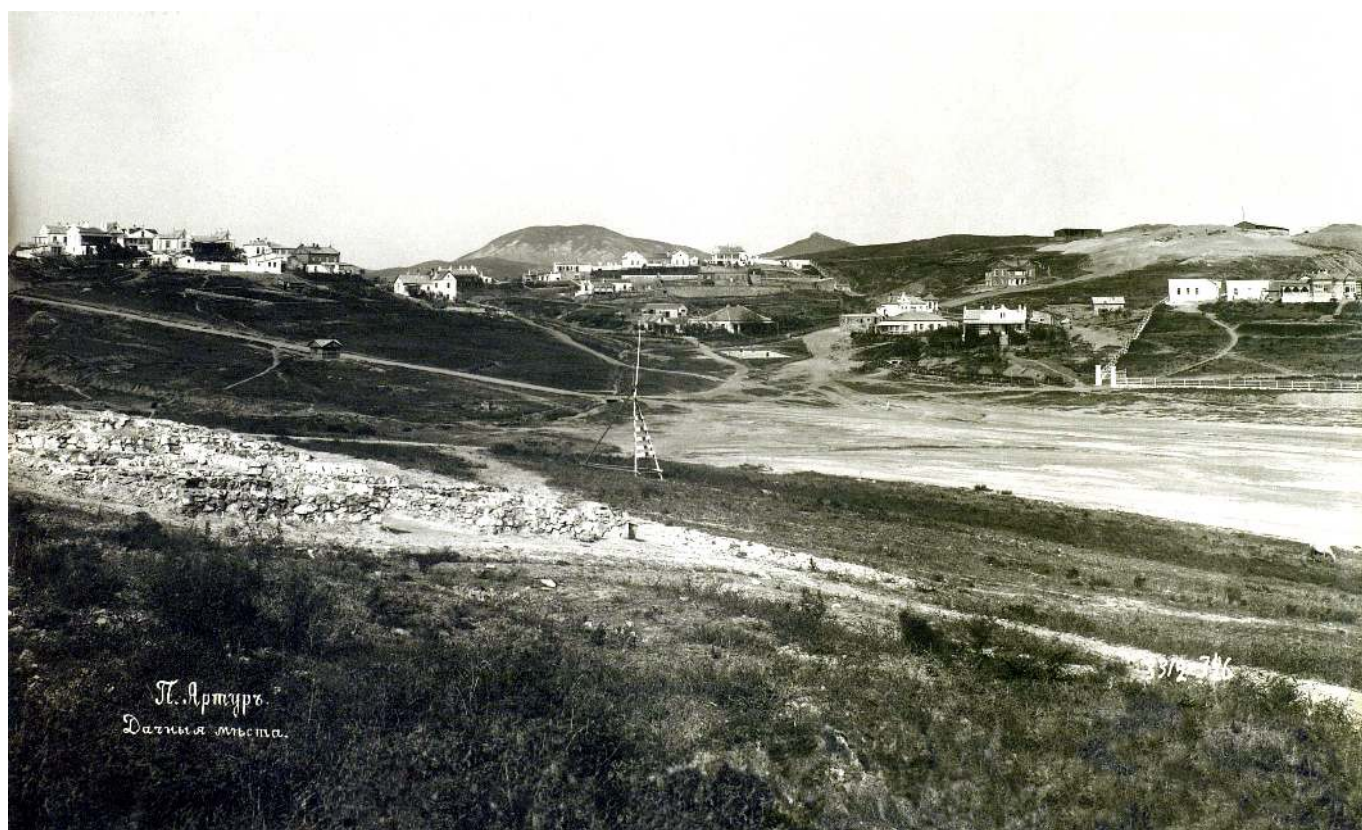
Рис. 4. Дачи в Порт-Артуре.