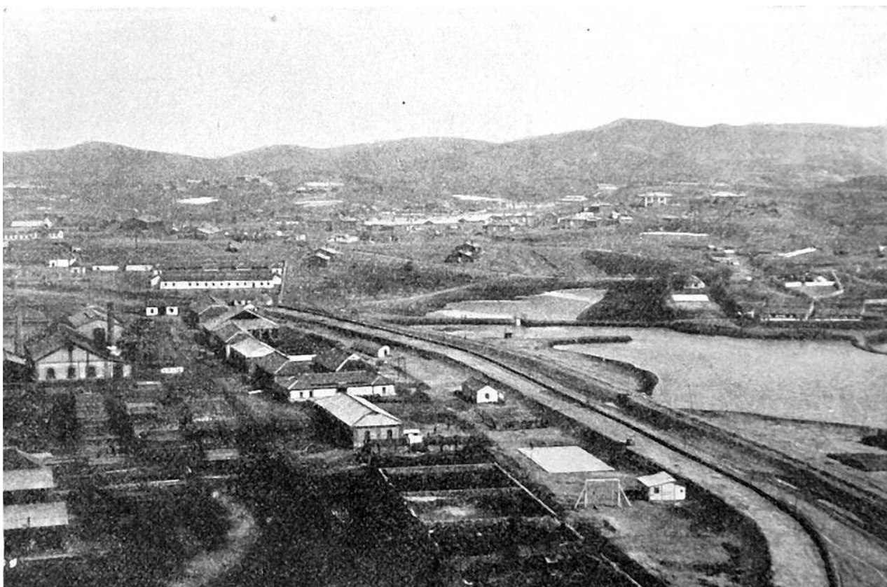
Рис. 1. Вокзал в Порт-Артуре.

Таким образом, в начале XX в. на российском Дальнем Востоке активно развивались общественные организации. Жители города-крепости Порт-Артур даже боролись с негативным социальным явлением «провинциализма» снижающим эффективность функционирования дальневосточных общественных объединений.