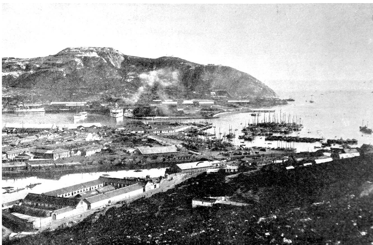
Рис. 2. Общий вид Порт-Артура.