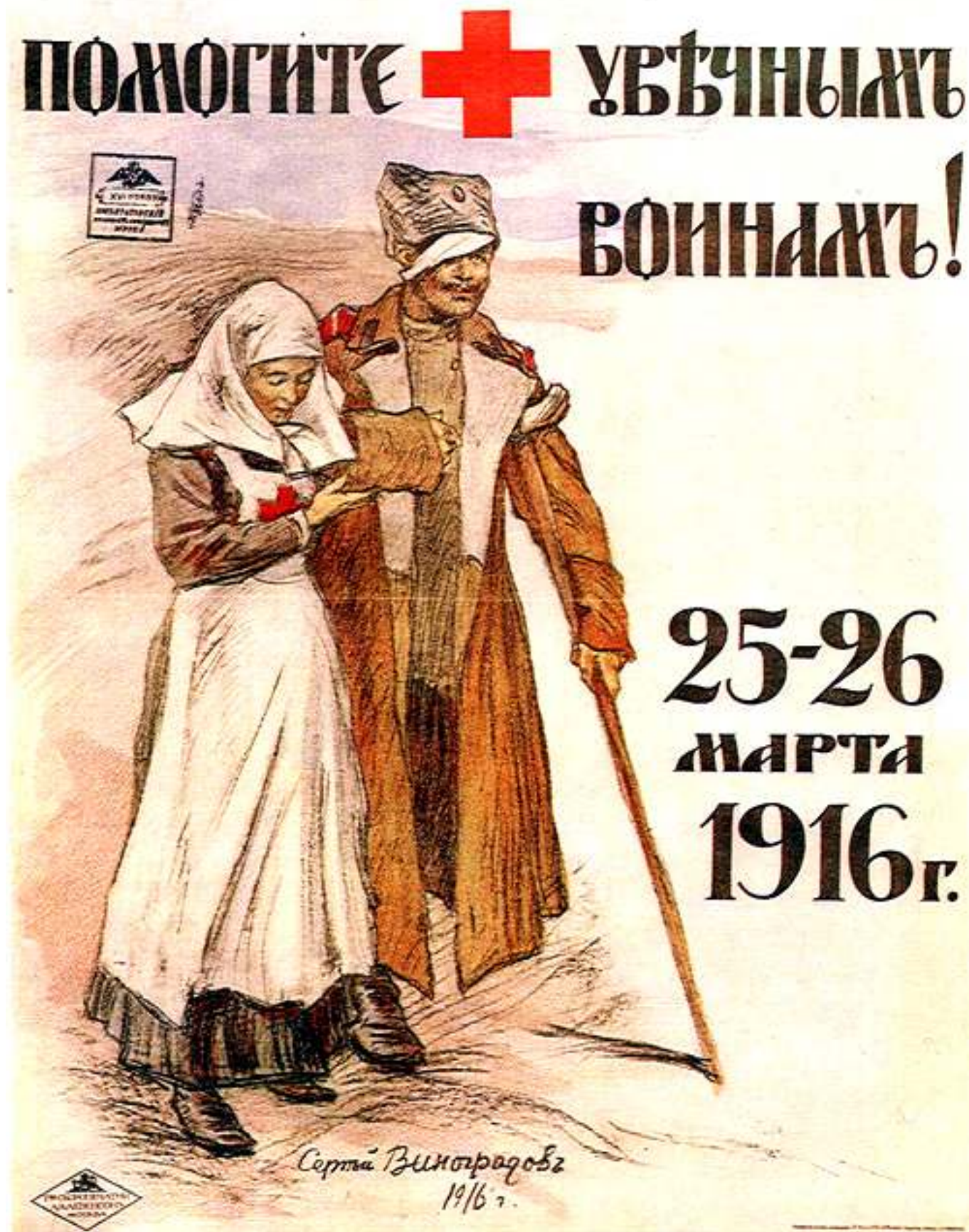
Рис. 2. Плакат. Помогите увечным войнам.