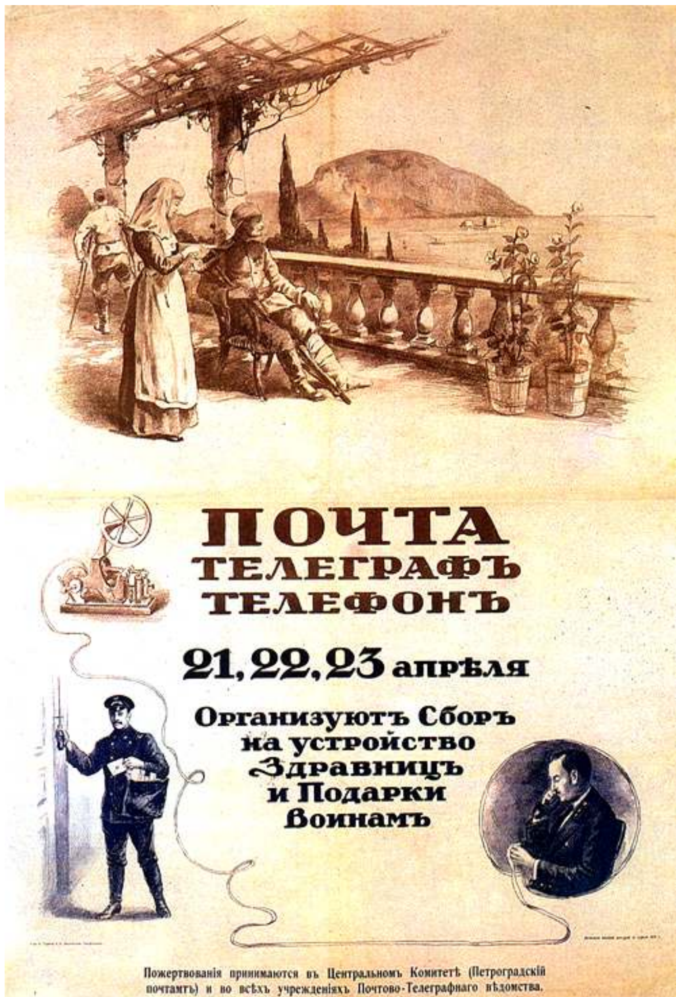
Рис. 4. Плат. Здравницы и подарки войнам.