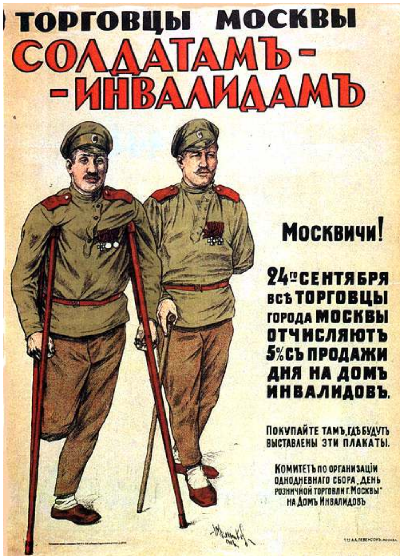
Рис. 3. Плакат. Солдатам-инвалидам.