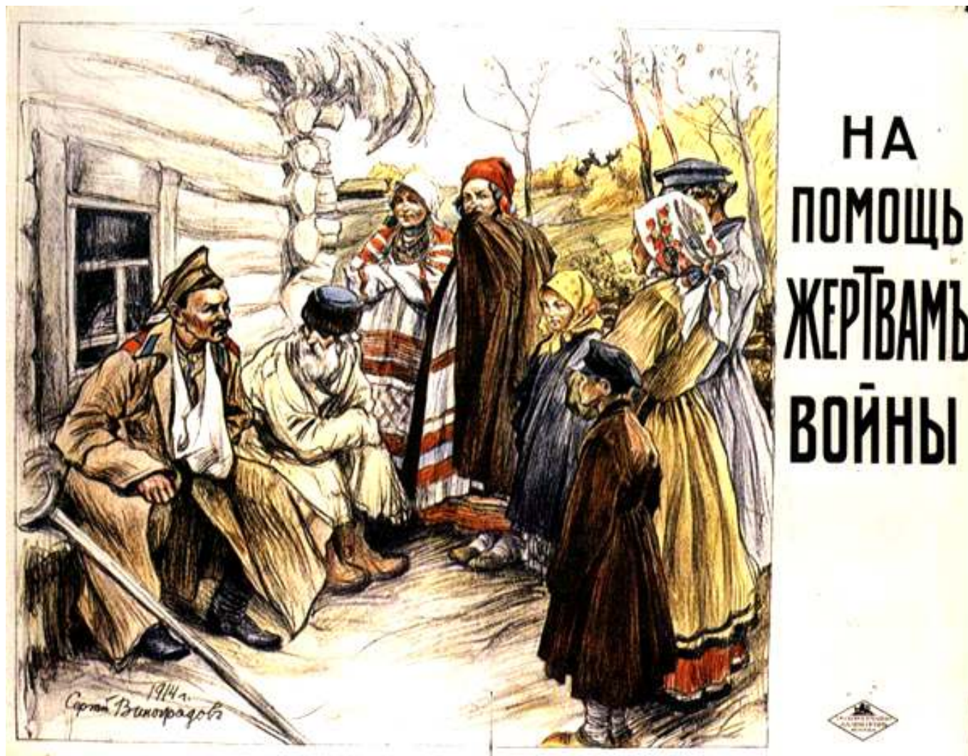
Рис. 5. Плакат. Помощь жертвам войны.