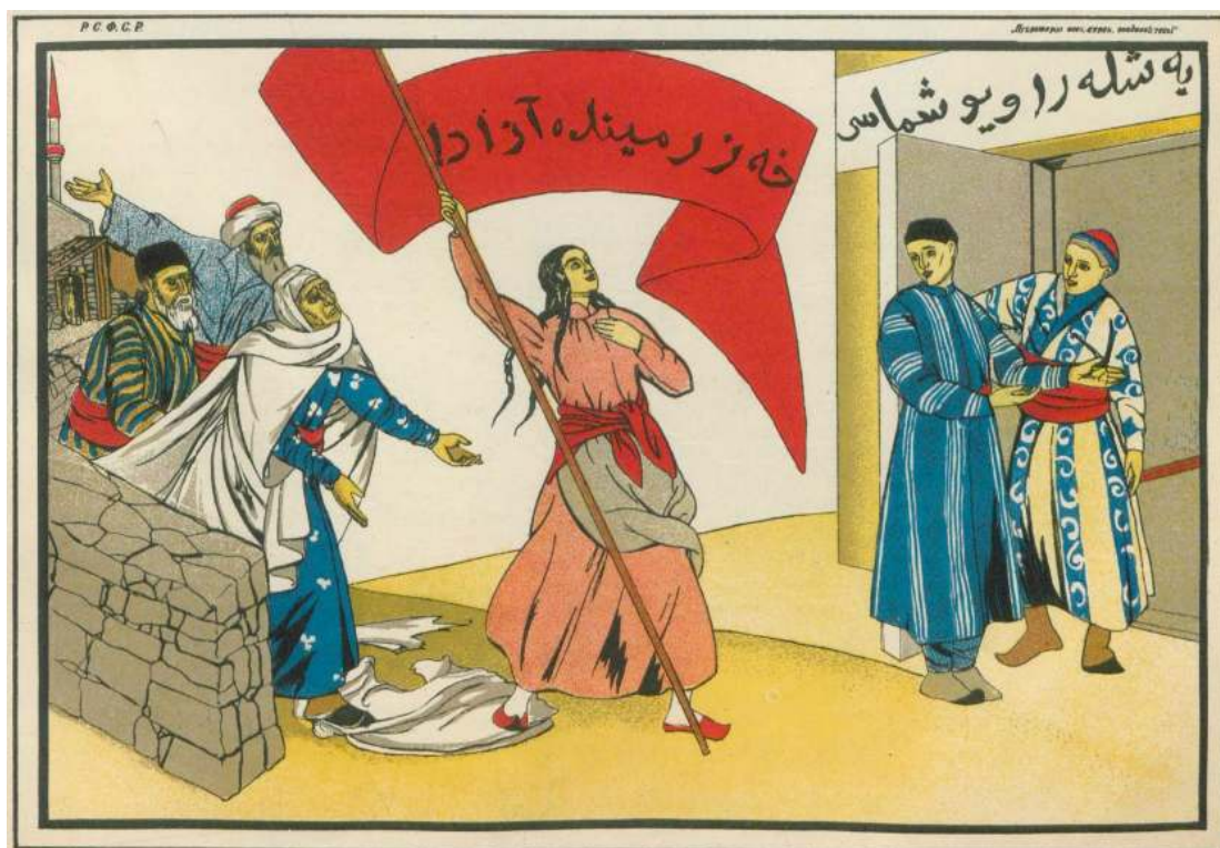
Рис.1. Освобождение женщин Востока.

3. Несмотря на преобладание ислама в республике, узбекские безбожники предпочитали оказывать противодействие преимущественно православным христианам, которые в республике составляли меньшинство и, следовательно, не могли существенно повлиять на общую религиозную ситуацию в регионе.