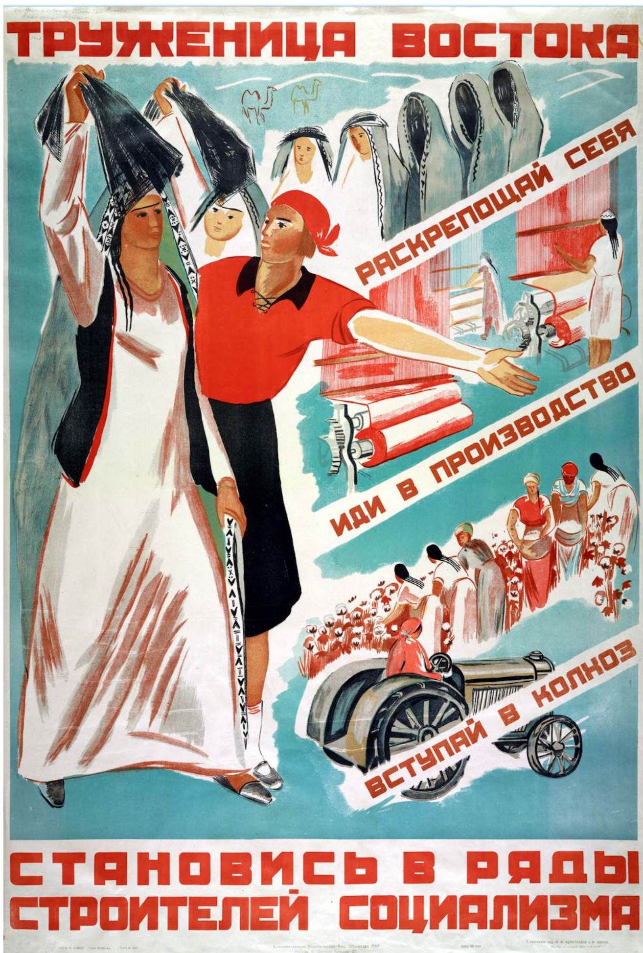
Рис.4. Советский плакат посвященный раскрепощению женщины Востока.