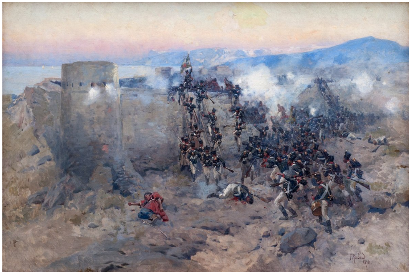
Рис.4. Штурм крепости Ленкорань.