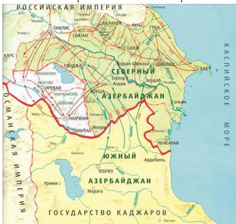
Рис. 2. Граница после Гюлистанского мира.