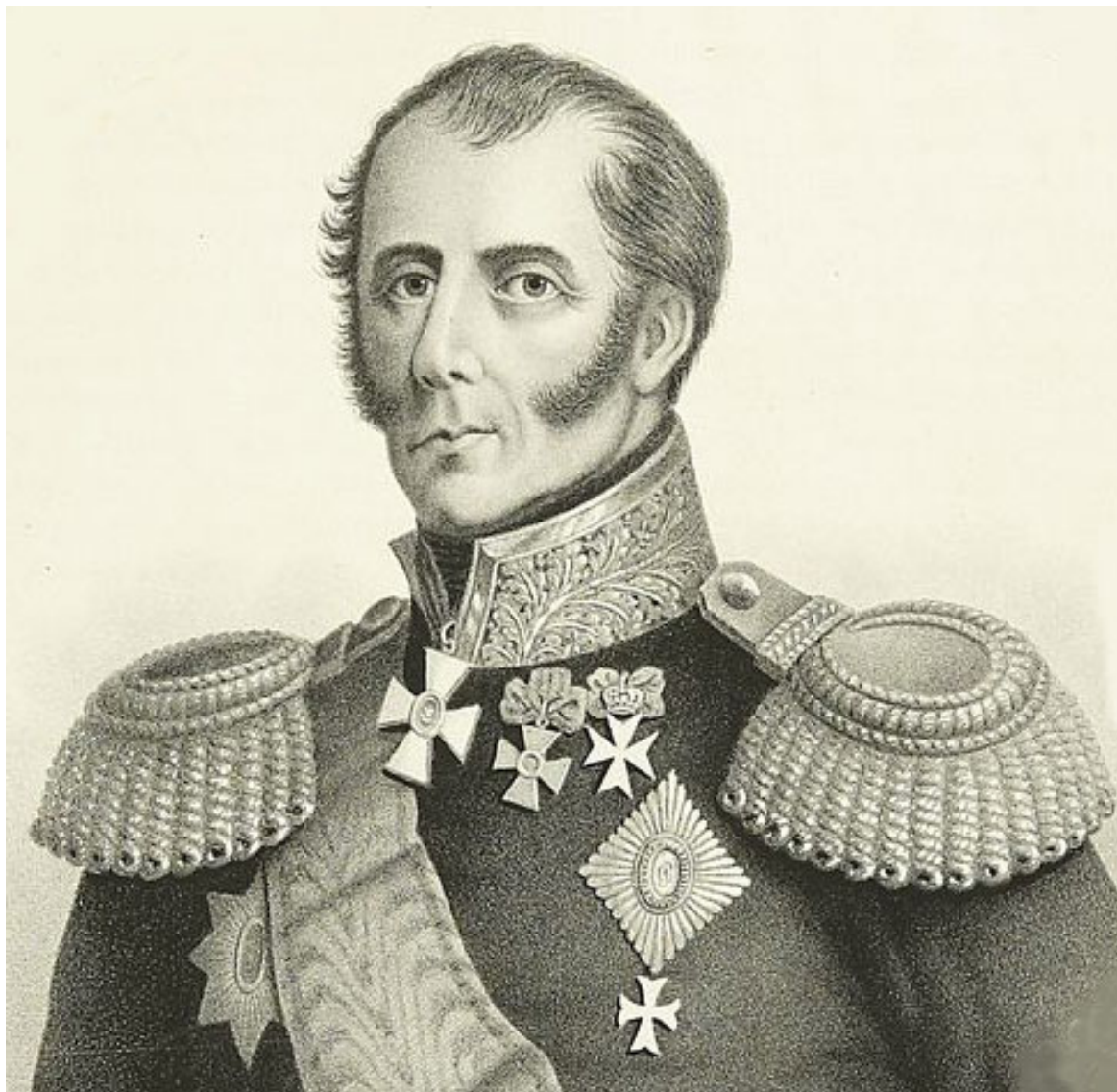
Рис. 1. Генерал-лейтенант П.С. Котляревский.