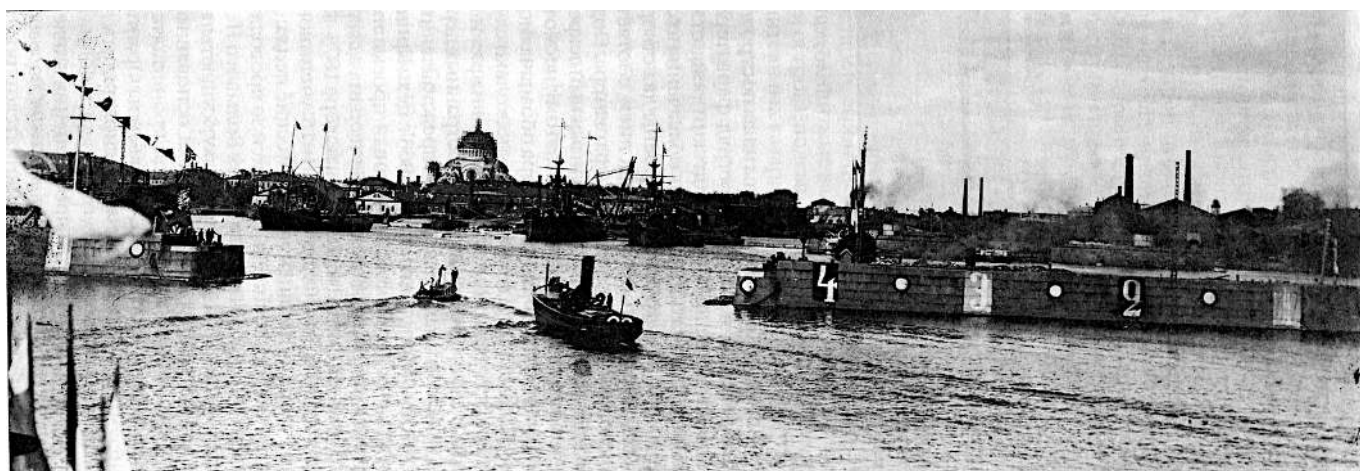
Рис. 3. Кронштадтский порт.