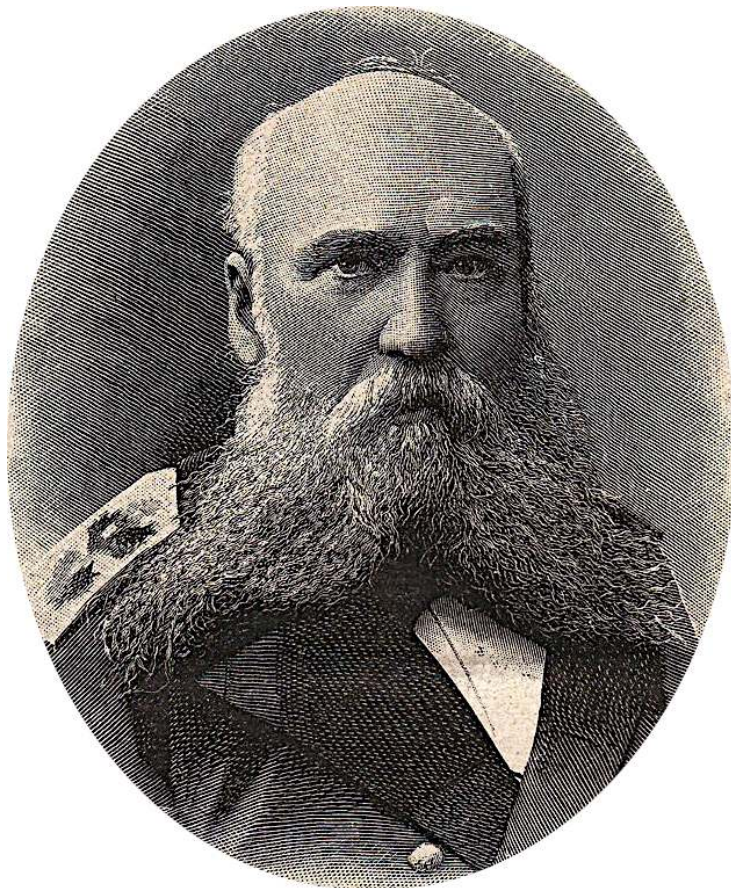
Рис. 2. Вице-адмирал К. П. Пилкин.