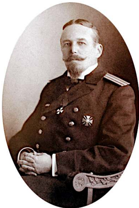
Рис. 1. Будущий адмирал В. К. Пилкин.