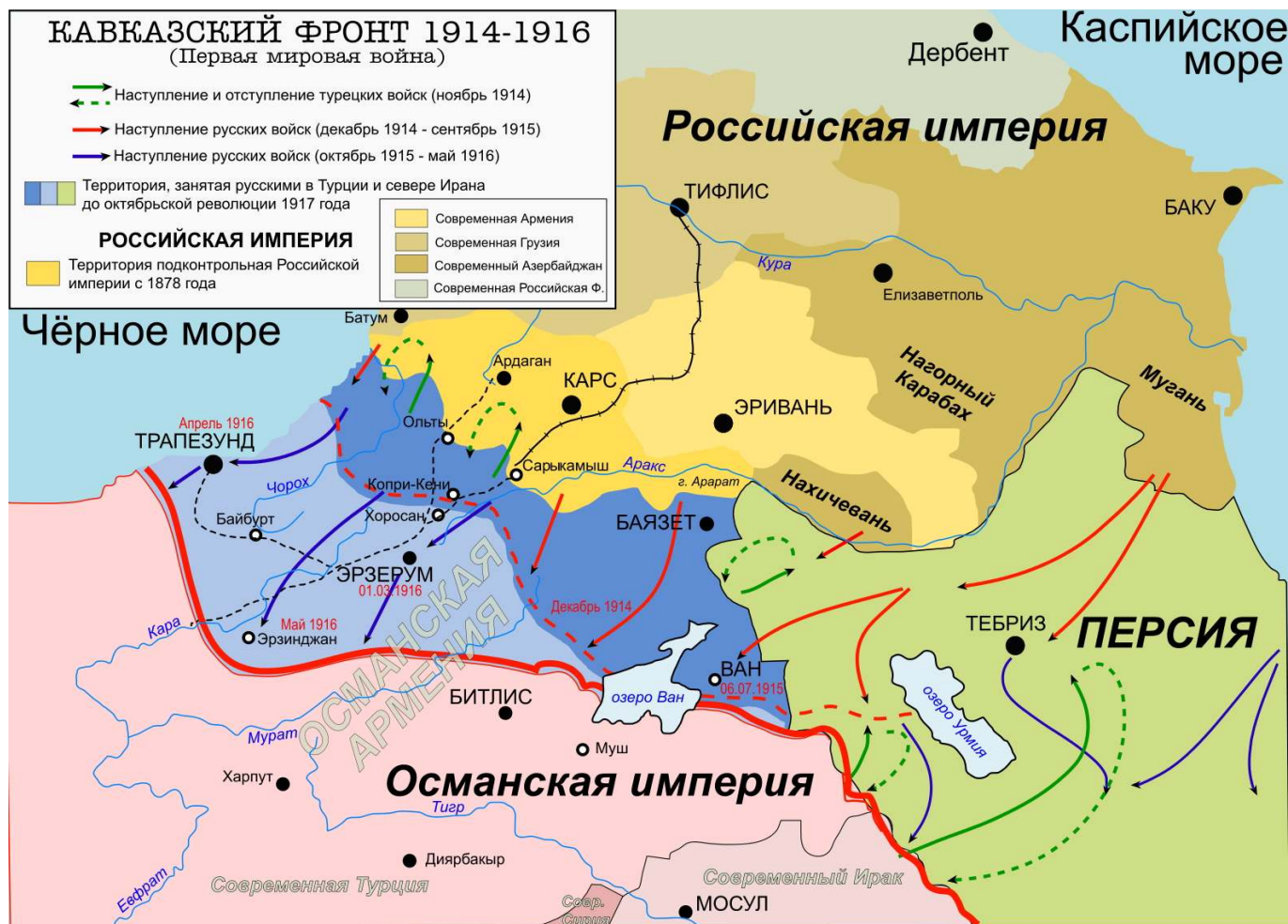
Рис. 4. Кавказский фронт в 1916 г.