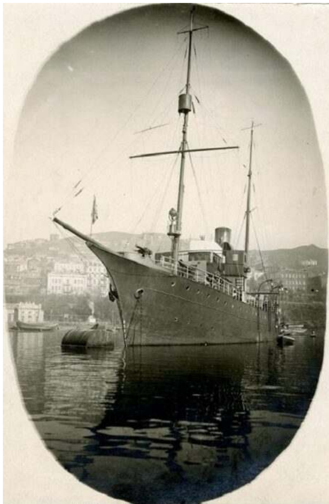
Рис. 3. Сторожевой корабль "Красный вымпел".