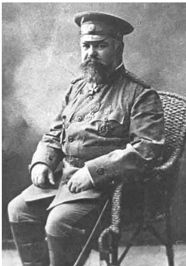
Рис. 1. Алексей Максимович Ребиндер.

непрерывной модернизации своей хозяйственной деятельности. Для планомерного обеспечения современного хозяйства своего имения кадрами они на свои собственные средства в 1875 году открыли начальную общеобразовательную школу, выпускники которой составляли основной контингент учащихся Марьинской низшей сельскохозяйственной школы 1-го разряда.