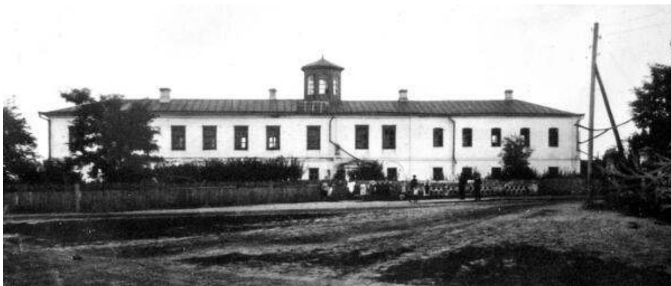
Рис. 3. Здание Марьинской низшей сельскохозяйственной школы 1 - го разряда.