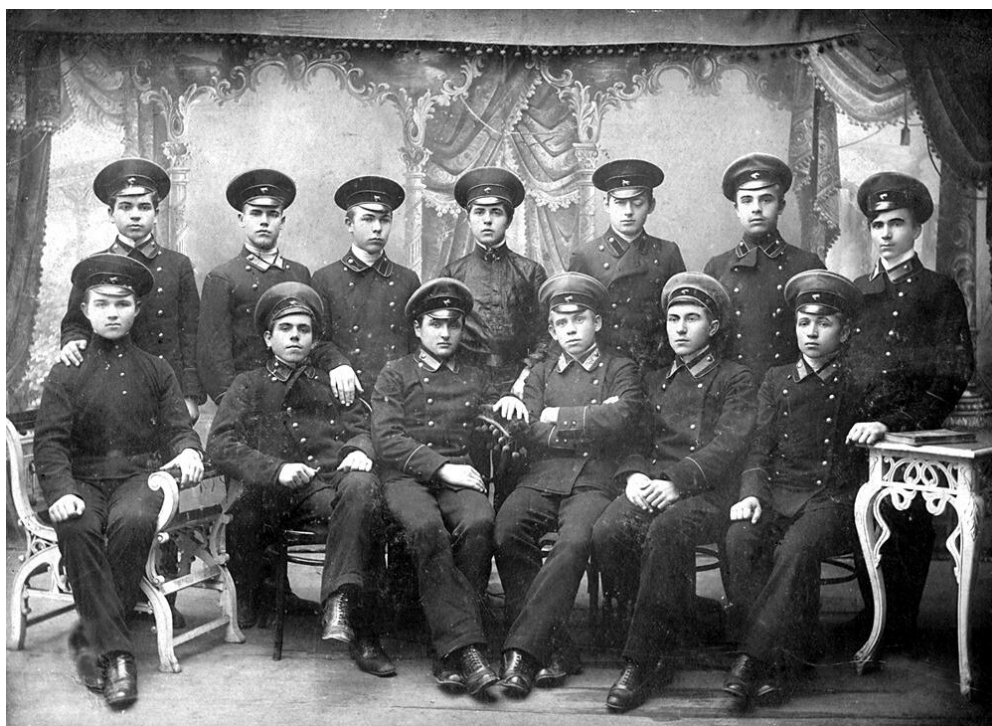
Рис. 6. Учащиеся Марьинской низшей сельскохозяйственной школы 1-го разряда.