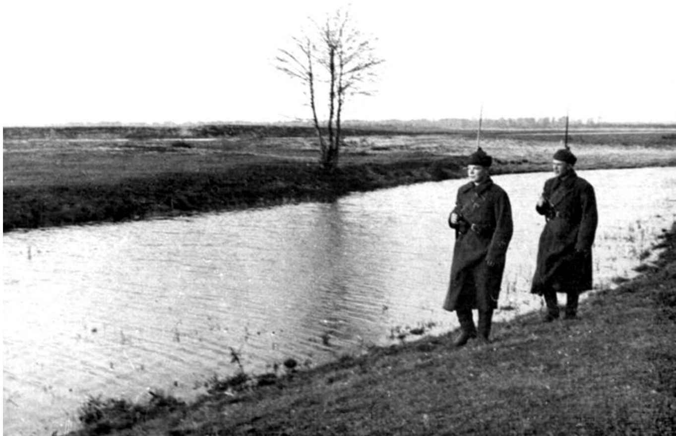
Рис. 1. Пограничная река.