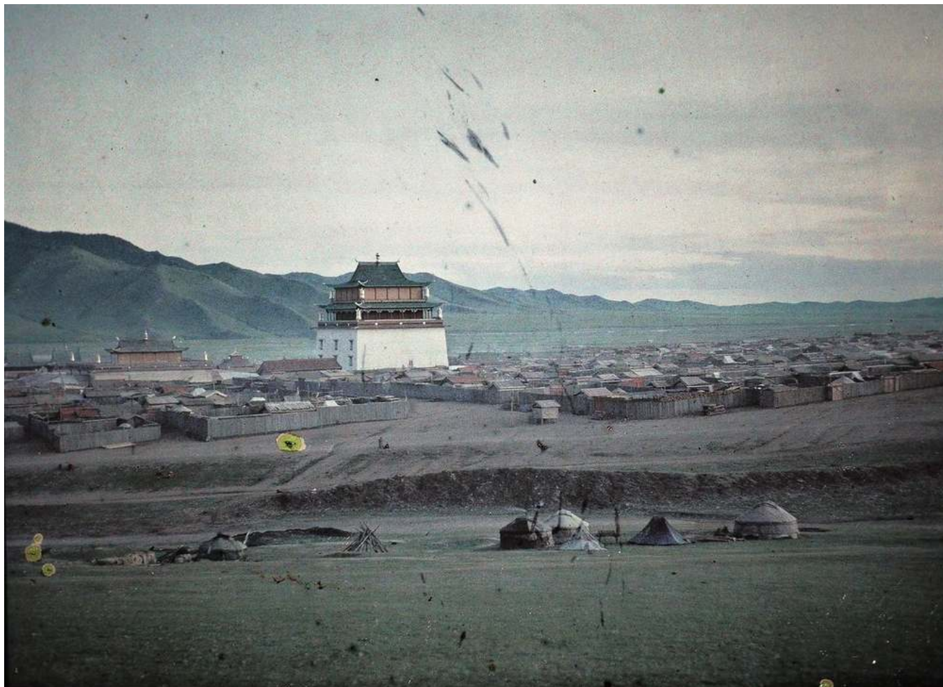
Рис. 3. Столица Монголии Урга 1913 г.