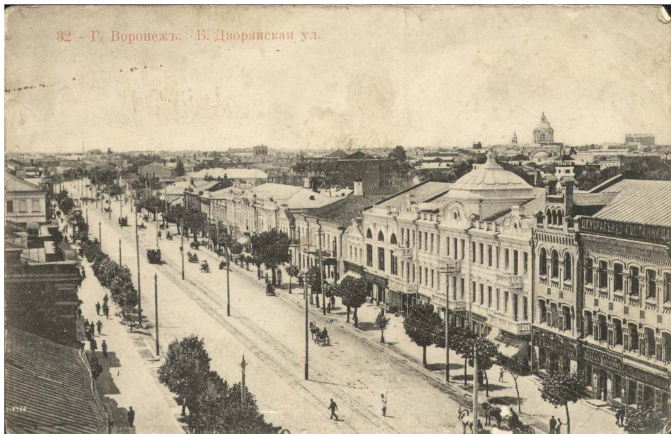
Рис. 1. Большая Дворянская улица в Воронеже.

Из приведенных заметок в газетах «Воронежский телеграф» и «воронежский день» можно сделать вывод, что турецкие военнопленные содержались на территории Воронежской губернии во время Первой мировой войны в значительном количестве. Только первая партия пленных турок составила 1118 человек. Обычно турецких военнопленных использовали для городских работ и в сельском хозяйстве губернии. В тоже время надзор за турецкими военнопленными оставлял желать лучшего. Ярким примером данного утверждения являются обстоятельства побега пленных турок из имения господина Хренникова.