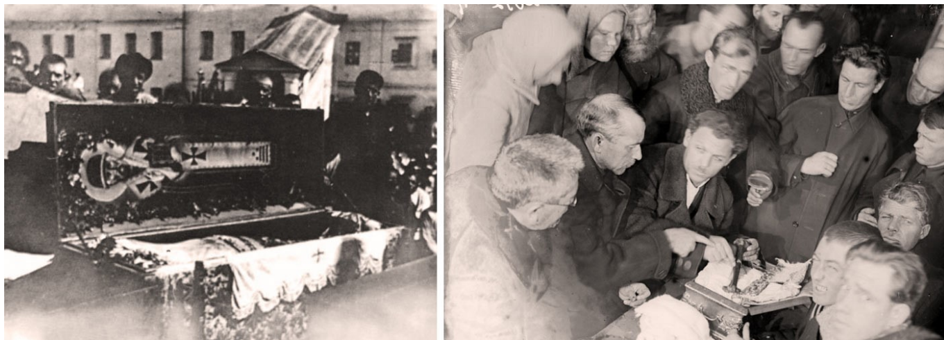
Рис. 2. Вскрытие мощей святителя Митрофана Воронежского.