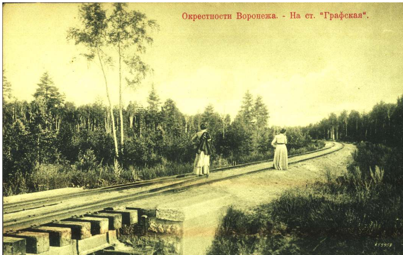
Рис. 2. Окрестности станции Графская.