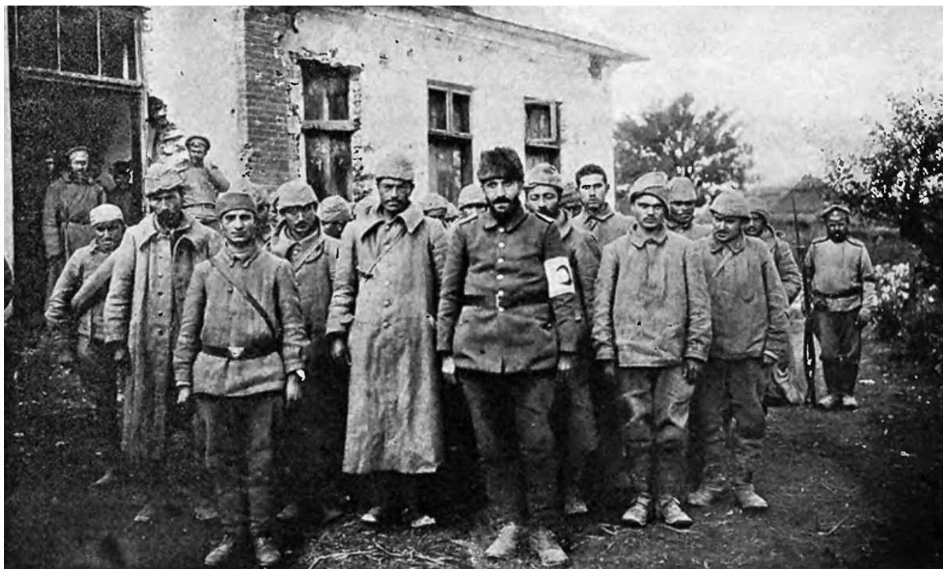
Рис. 5. Турецкие военнопленные во время Первой мировой войны.