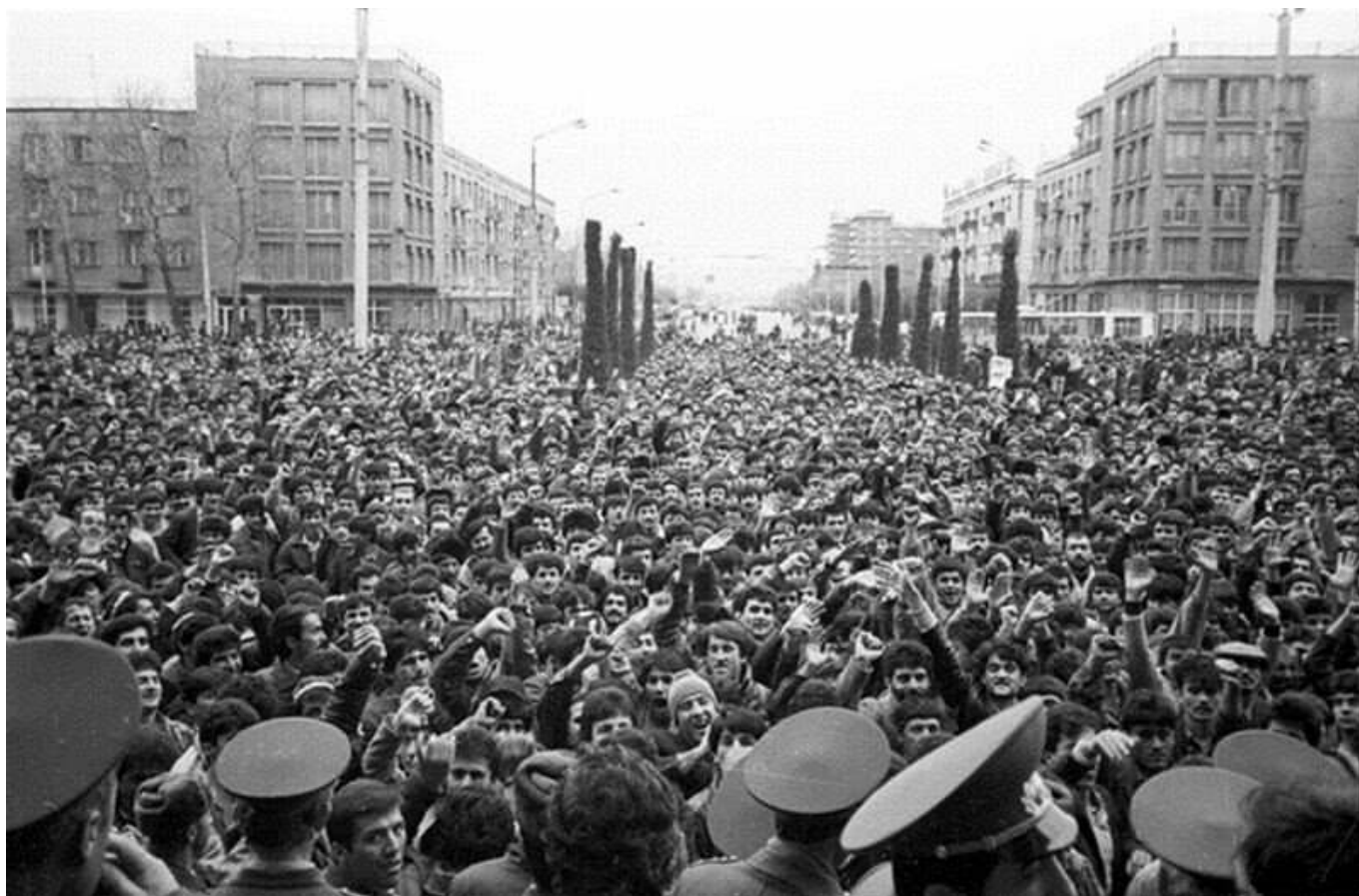
Рис. 3. Митинг в г. Душанбе.