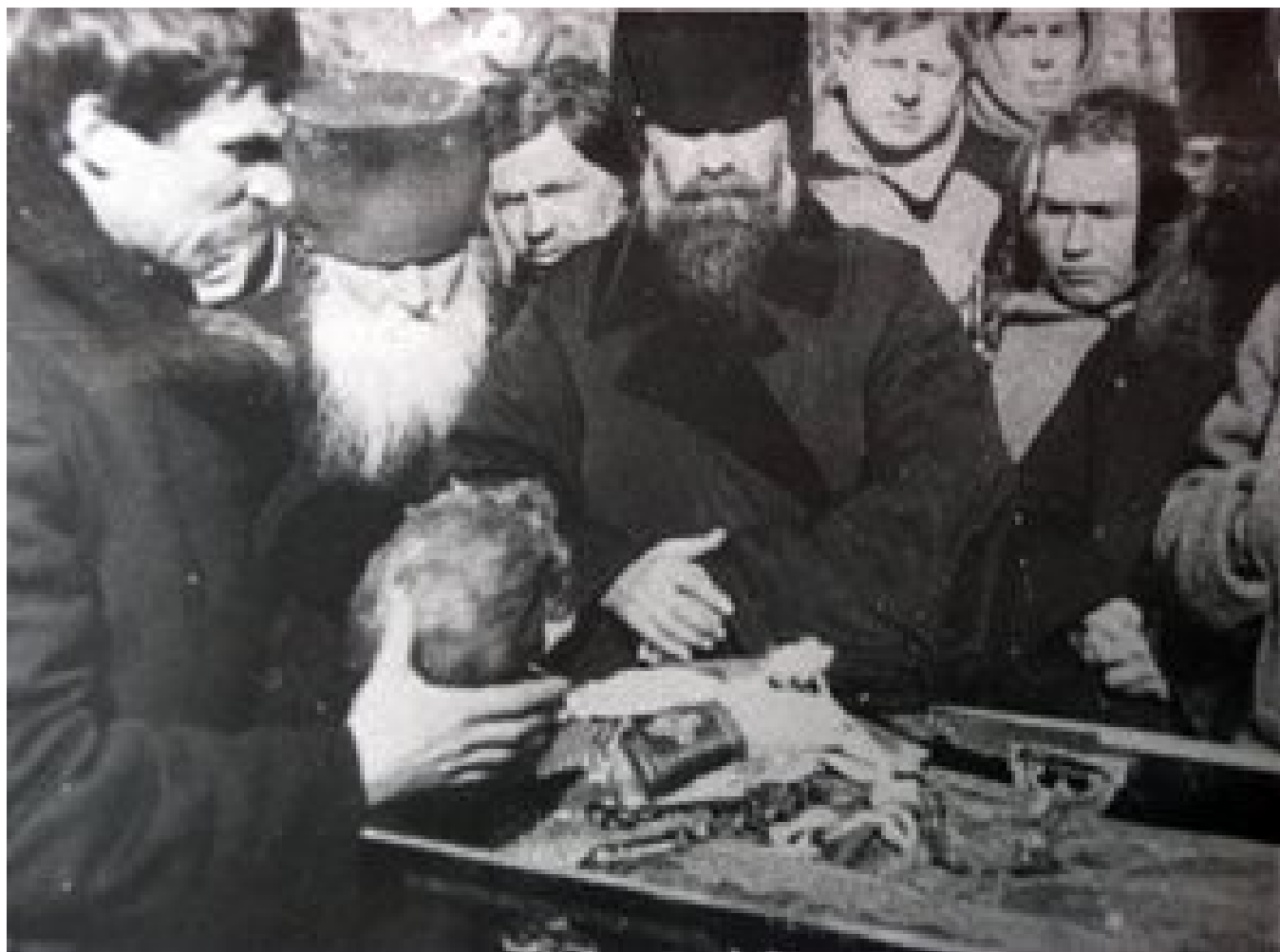
Рис. 1. Вскрытие и осквернение мощей святителя Тихона Задонского.

5. Ряд действий полномочных представителей советской власти в ходе компании по ликвидации мощей и изъятию церковных ценностей осуществлялся в строгой секретности, больше присущей действиям диверсантов в тылу врага, по причине противодействия основной массы населения святотатственным действиям советской власти.