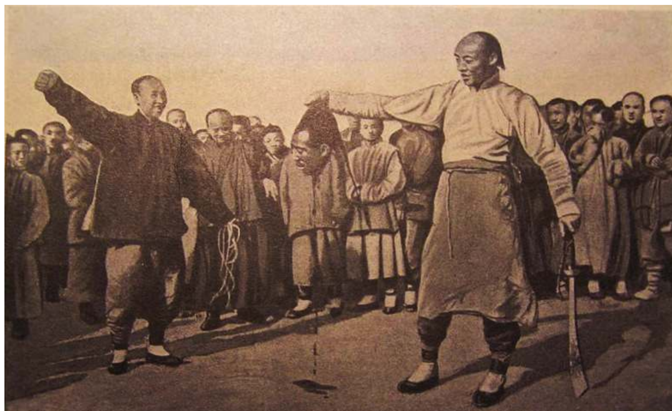
Рис. 2. Казнь хунхузов китайскими властями.