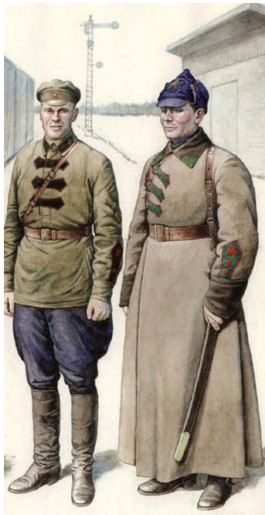
Рис. 4. Пограничники 1922 - 1924 гг.