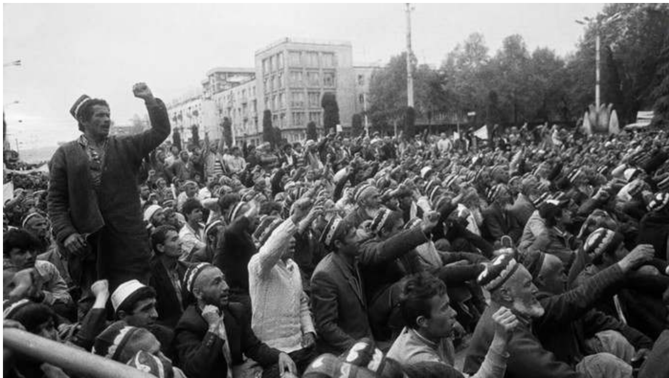
Рис. 1. Митинг в г. Душанбе.