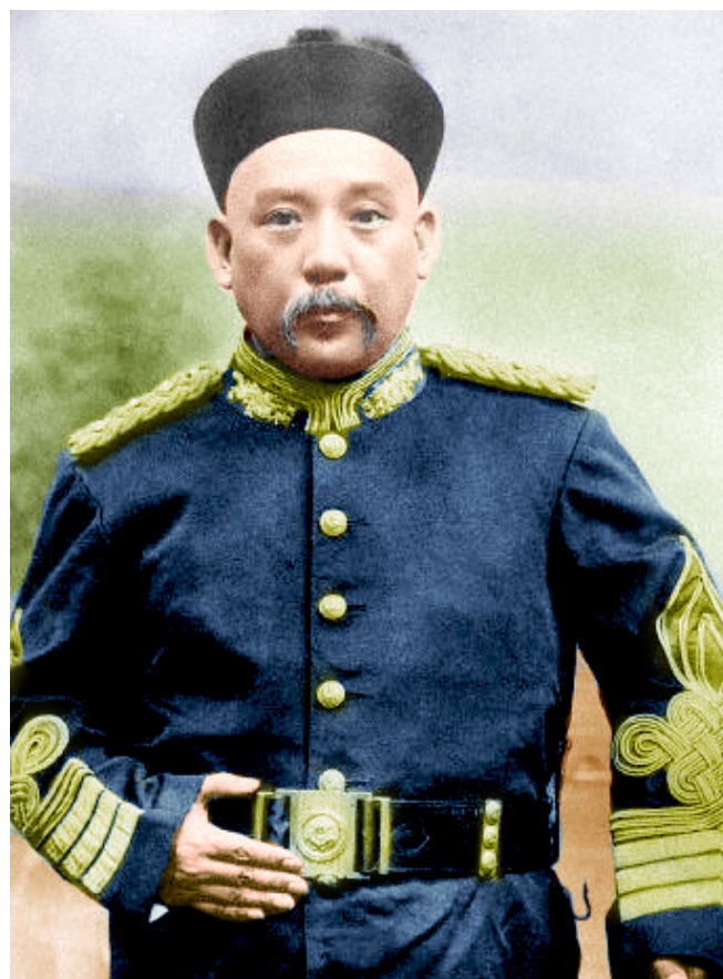
Рис. 4. Юань Шикай.