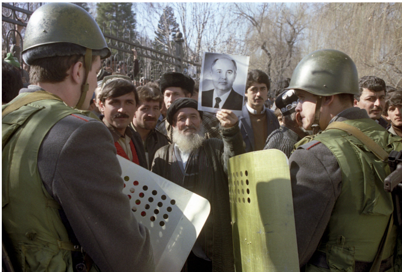
Рис. 2. Солдаты внутренних войск на митинге в Душанбе.