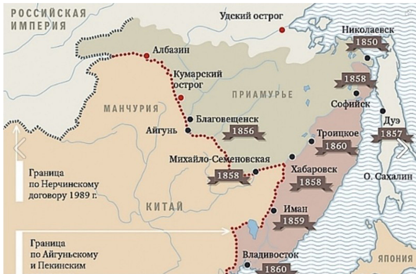
Рис. 1. Граница России и Китая во второй половине XIX в.