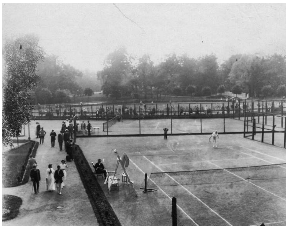
Рис. 2 Лаун-теннис в начале XX в.