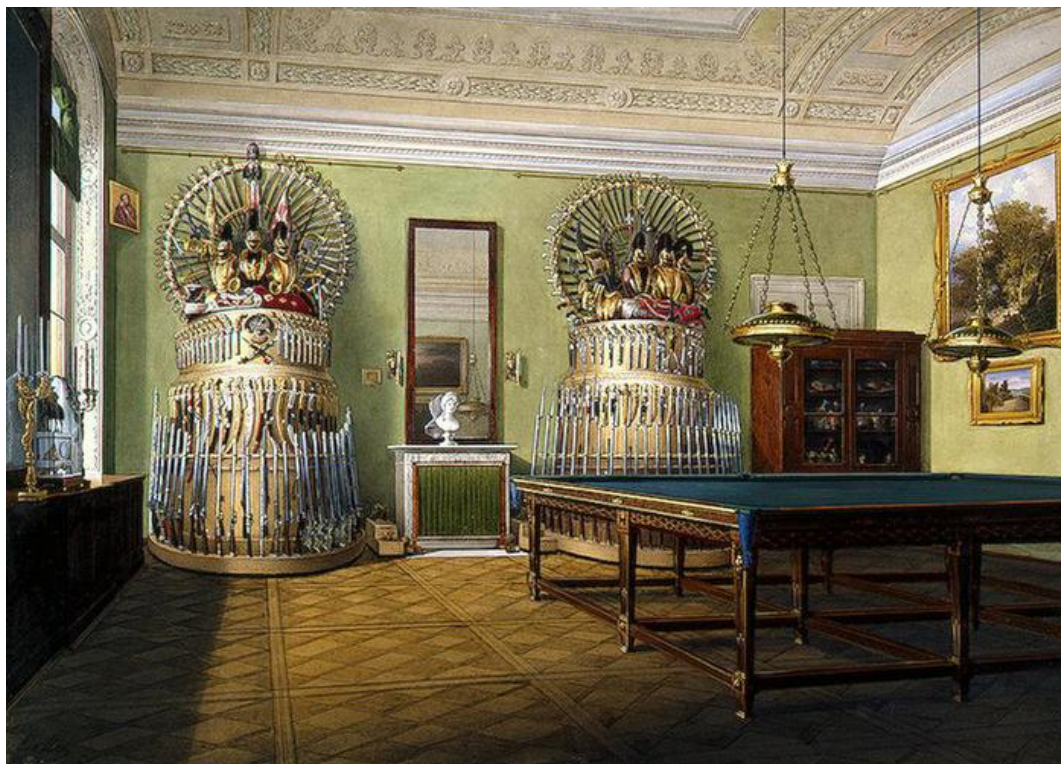
Рис. 1. Бильярдная комната в Зимнем дворце.

благотворительное и социальное значение. На них в ходе конкурсов и иных развлекательных мероприятиях жители Воронежской губернии в начале XX в. собирали солидные денежные пожертвования для создания бесплатных общественных столовых и в помощь малоимущих и нуждающимся воронежским семьям. Отсюда, не спортивные мероприятия в Воронежском яхт-клубе помогли существенно снизить социальную напряженность в общественной жизни края в начале XX в.