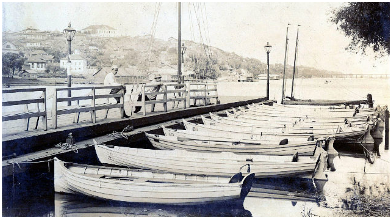
Рис. 3. Пристань воронежского яхт-клуба.