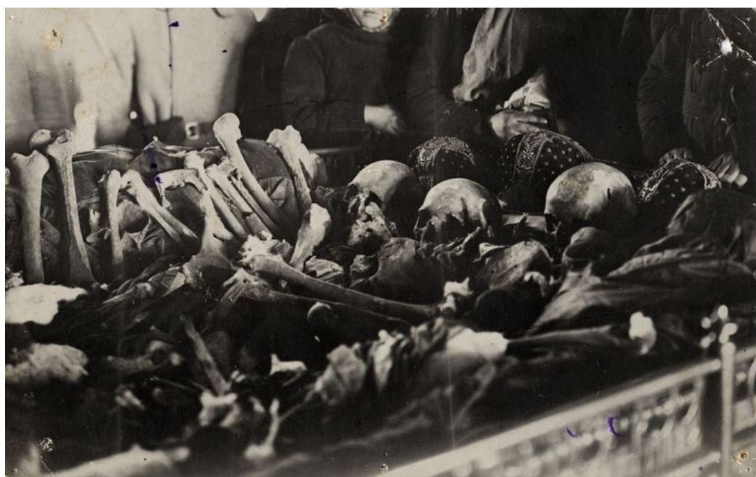
Рис. 3. Вскрытие мощей святых Константина, Федора и Михаила в соборе Благовещенского мужского монастыря.