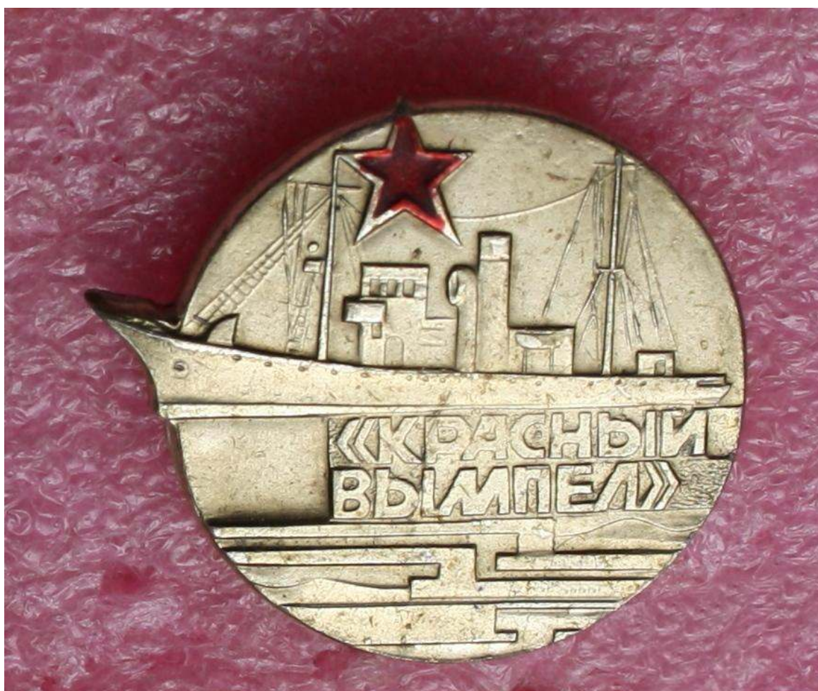
Рис. 2. Памятный значок "Красного вымпела".