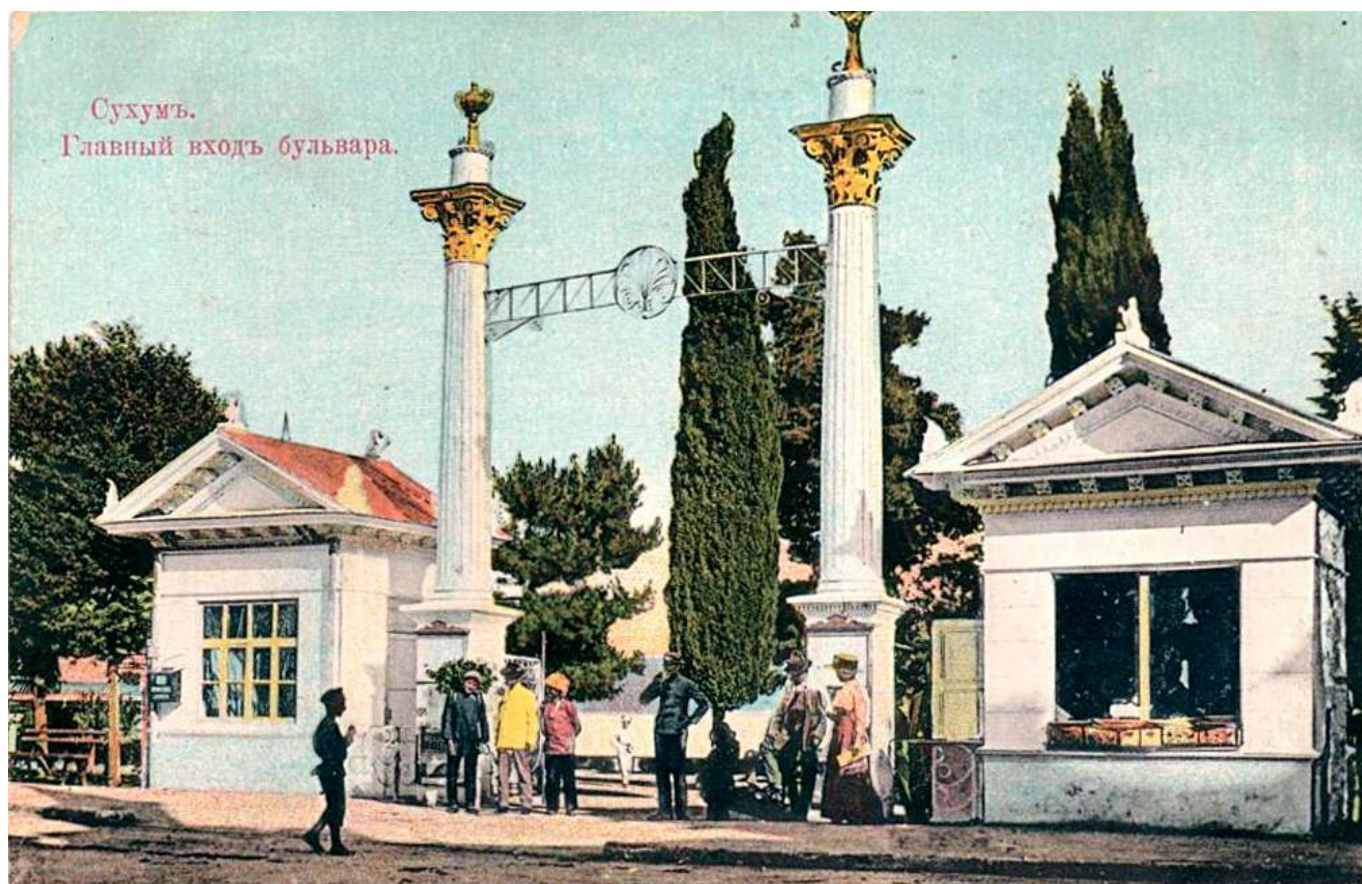
Рис. 3. Сухуми в начале XX в.