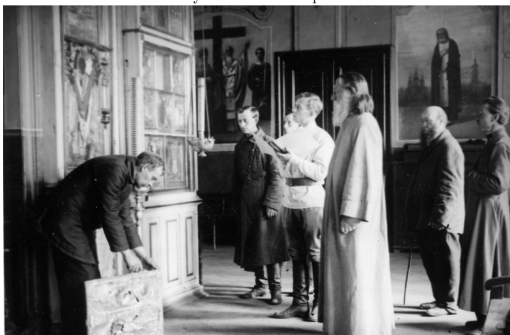
Рис. 4. Процесс изъятия церковных ценностей в одном из православных храмов.