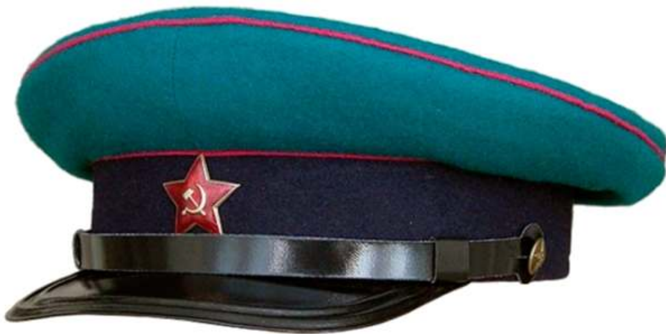
Рис. 5. Пограничная фуражка 1923 г.