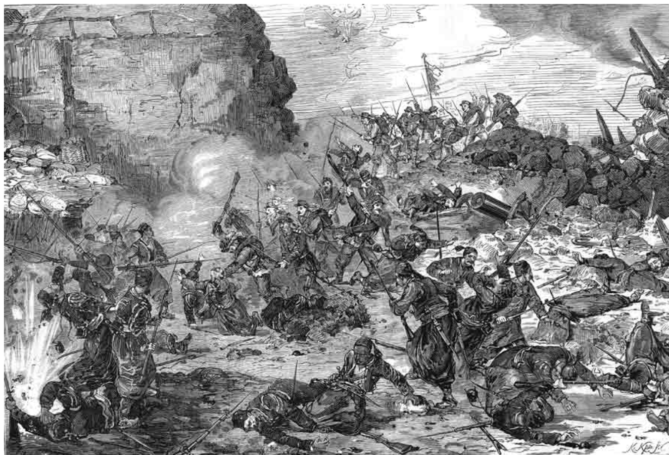
Взятие крепости Ардаган русскими войсками.