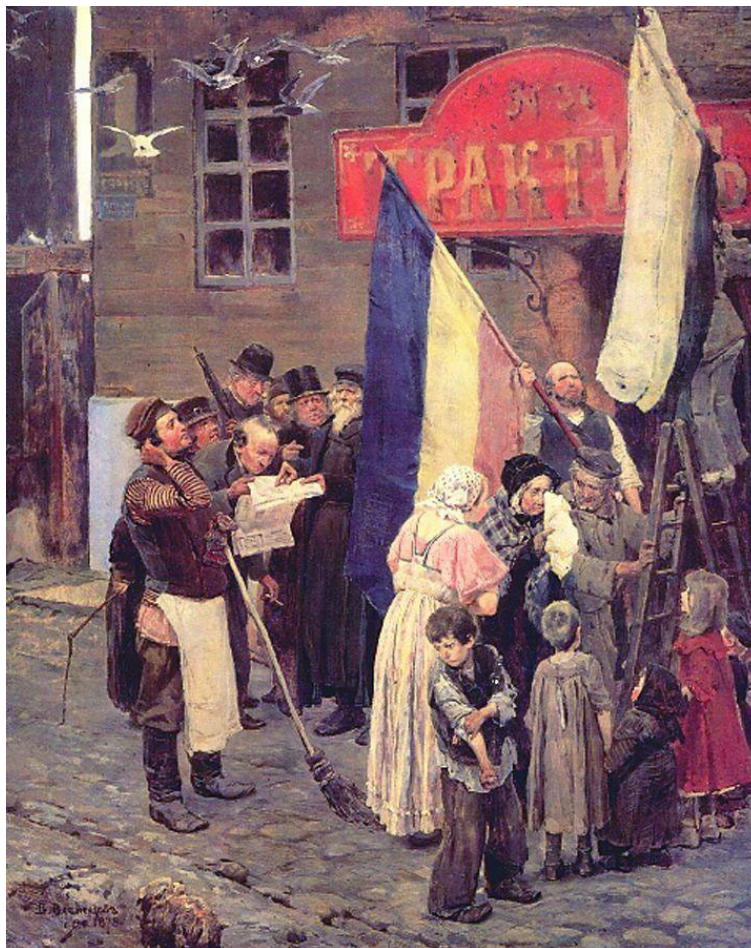
Известие о взятии крепости Карс.