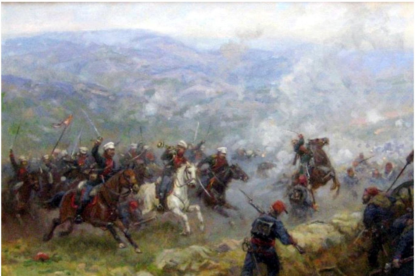
Атака конных гренадер под Горным-Дубняком.

Нельзя не отметить, что официальная власть на примере молодых офицеров, выпускников Михайловской Воронежской военной гимназии» помимо патриотизма пропагандировала благородные цели российских вооруженных сил в русско-турецкой войне 1877 – 1878 гг. Отсюда, их подвиги вызвали закономерное сочувствие у воронежских обывателей и желания по возможности способствовать победе русского оружия над турками.