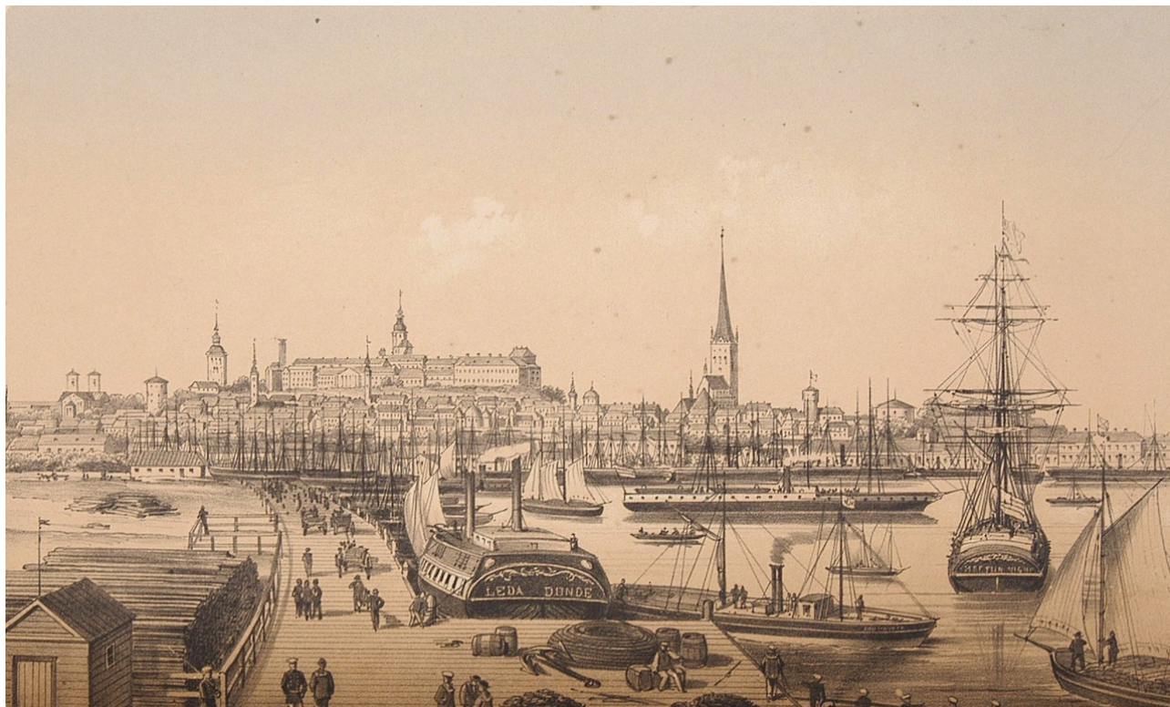
Рис. 3 Вид на ревельский порт в XIX в.