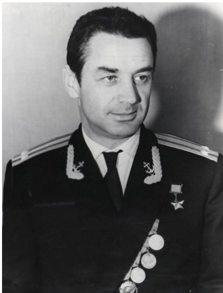
Рис. 3 Герой дальнего перехода подводных лодок И.Р. Дубяга.