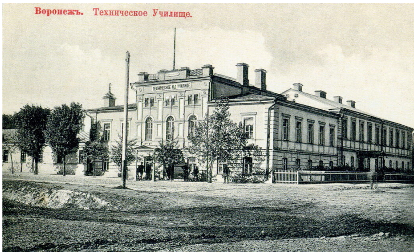
Рис. 1 Воронежское техническое железнодорожное училище.

В свою очередь, газеты «Воронежский телеграф» и «Дон» активно освещали судьбы воронежских добровольцев на фронтах Первой мировой войны, что, безусловно, способствовало патриотическим настроениям среди населения губернии.