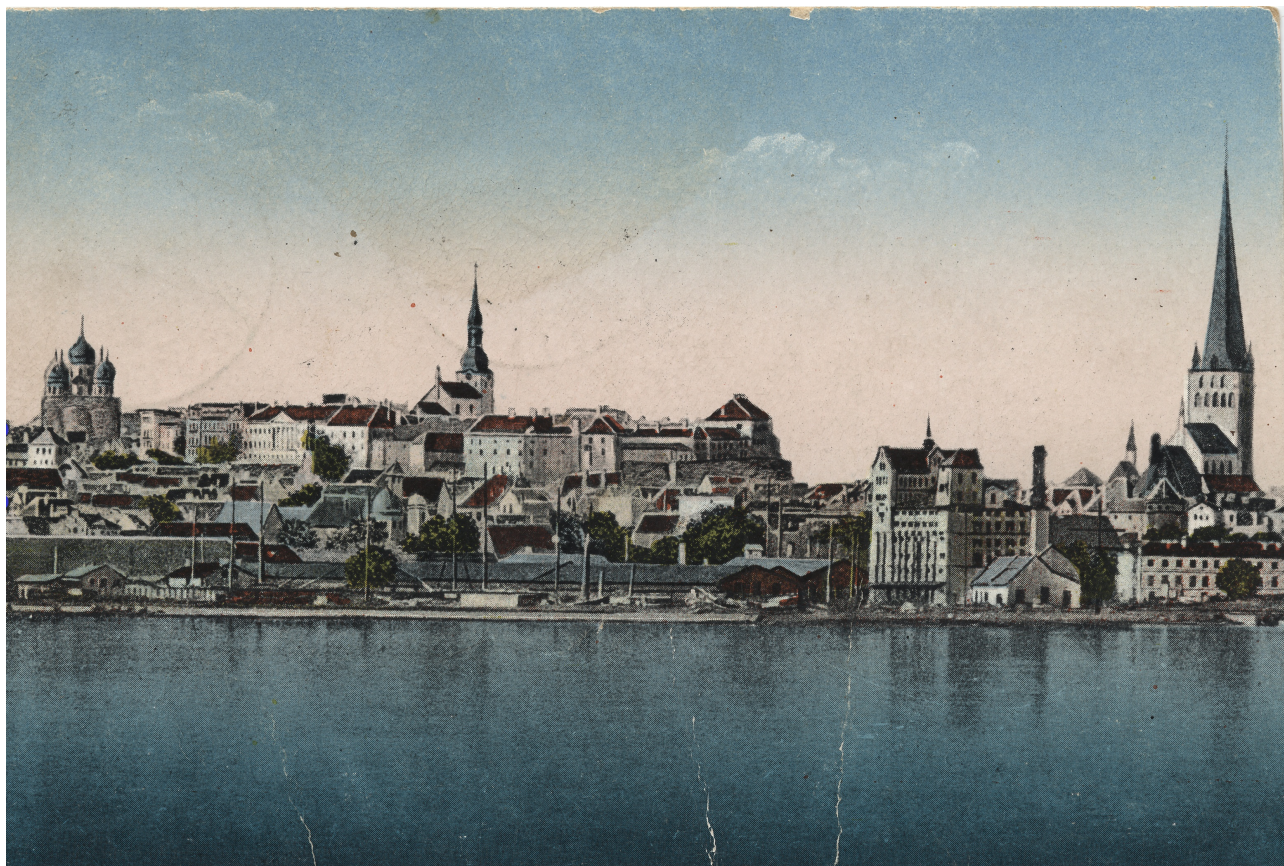
Рис. 1 Ревель до 1917 г.

определенные традиции занятия водным спортом. Впоследствии данные традиции стали основой для прибалтийских яхт-клубов Российской Империи, достигших в начале XX в. значимых спортивных достижений на всероссийском и международном уровнях.