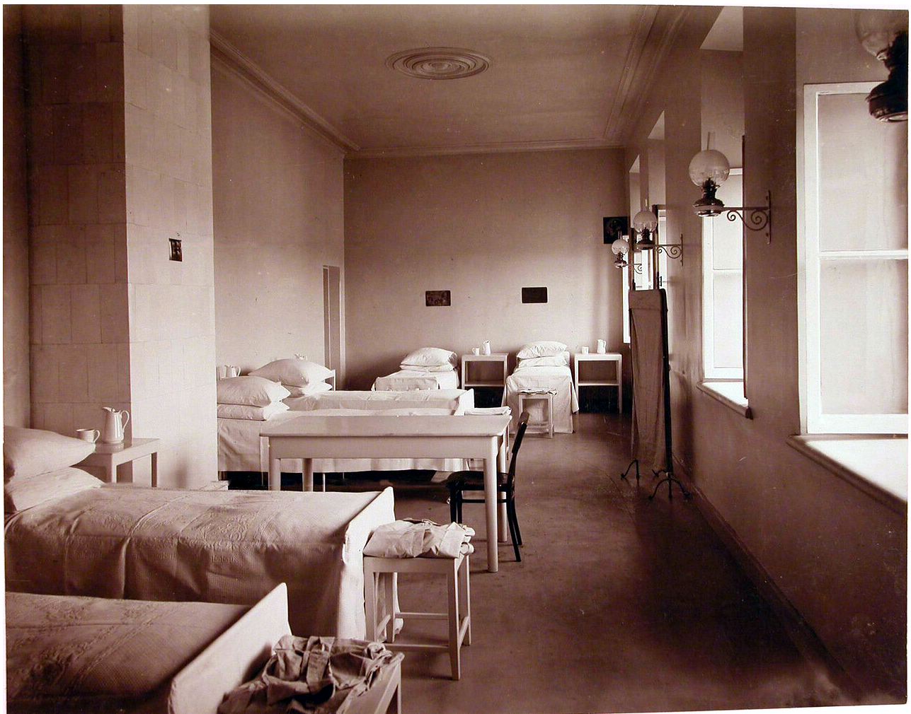
Рис. 3 Палата хирургической больницы при Николаевской общине сестер милосердия.