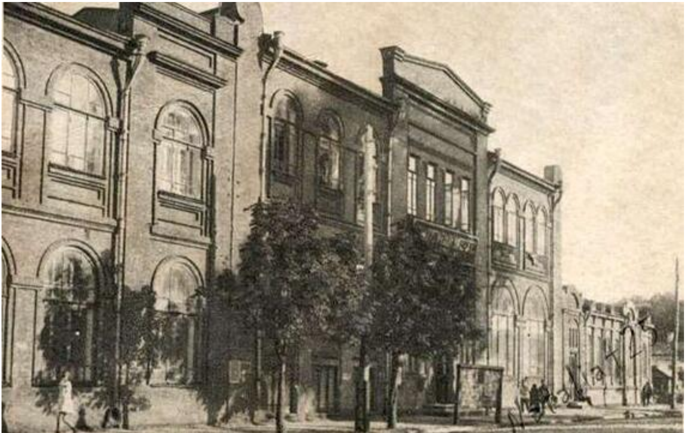
Рис. 2 Гизназия С.М. Морзовой.