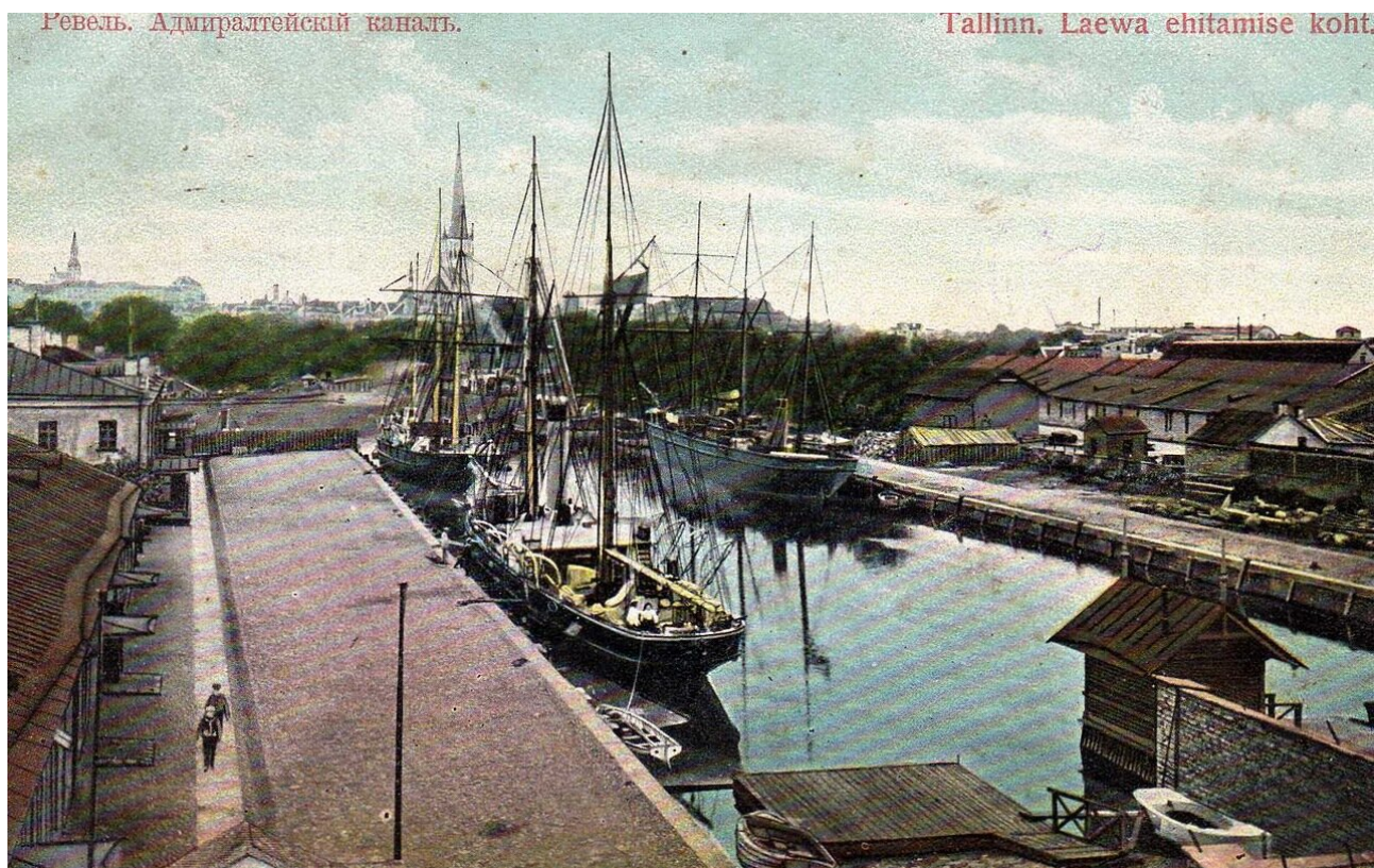
Рис. 2 Ревель. Адмиралтейский канал.