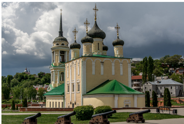
Рис 1. Успенский Адмиралтейский храм

Приведенный нами пример наглядно иллюстрирует повседневную деятельность «Общественного консультативного межконфессионального Совета при областной Думе» по организации взаимодействия с представителями органов власти и различных религиозных конфессий.