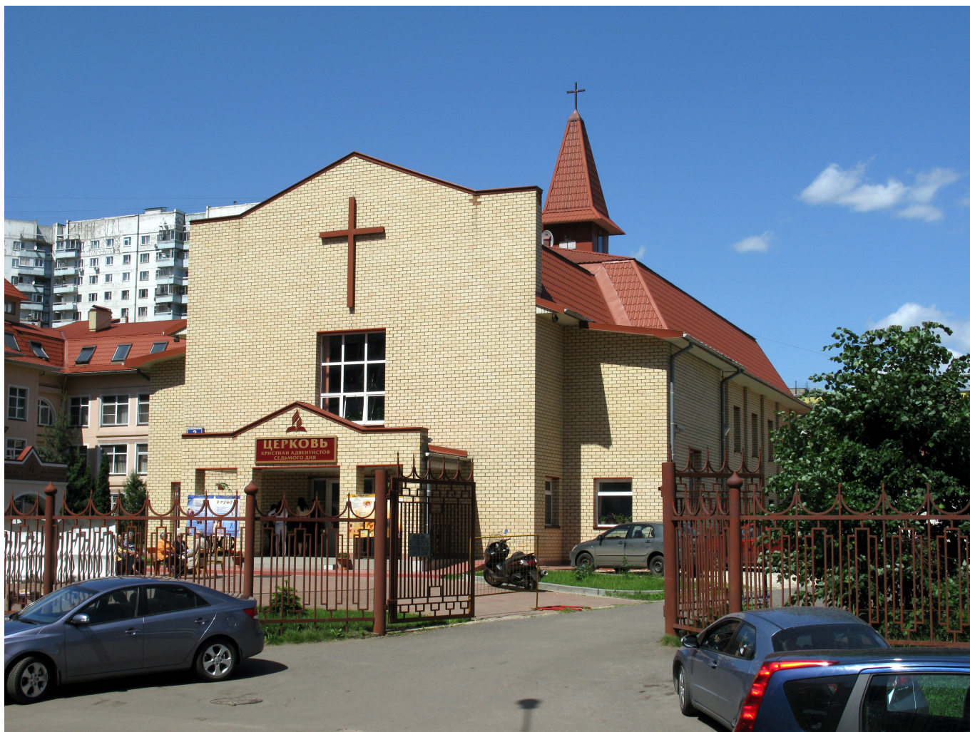
Рис. 1 Церковь адвентистов